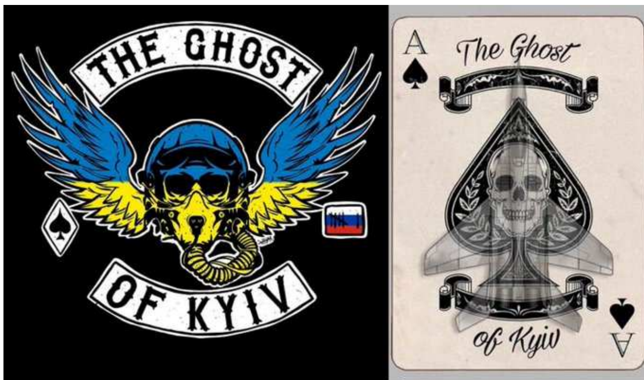
Figure 1 - Le «fantôme de Kyiv», pilote de chasse à la cocarde bleu et jaune, aurait abattu six avions ennemis. Un mythe, en dépit de la résistance réelle de l'aviation ukrainienne.

guerre, relaient en continu des vidéos prises par des citoyens sur les principaux points chauds du pays avant d'être authentifiées, analysées et publiées par des cellules de fact checking des médias ou par de simples internautes maîtrisant les techniques d'investigation en source ouverte, bientôt, chaque ville dispose de sa propre chaîne. Les attaques répétées sur Kharkiv, deuxième ville du pays, ont été ainsi largement documentée à partir de sources Telegram souvent rediffusées sur Twitter 96 . Le 25 février, les internautes peuvent ainsi admirer un combat tournoyant entre trois avions de chasse évoluant à basse altitude au-dessus de Kyiv. Si le descriptif du poste laisse croire à une victoire du pilote ukrainien, le contenu s'avère être un montage réalisé à partir du simulateur de vol DCS, connu pour son réalisme et renforcé par les exclamations en off d'une femme 97 .