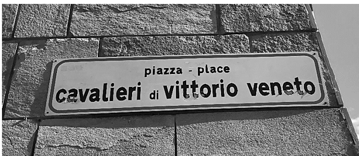
Fig. 7, Fig.8 : signalisation bilingue