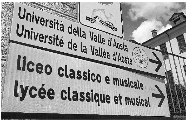
Fig.3 : bilinguisme intégral franco-italien