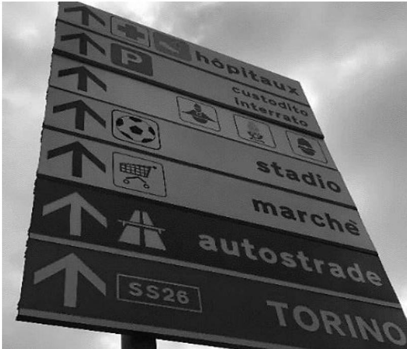
Fig.1 : signalisation routière majoritairement en italien