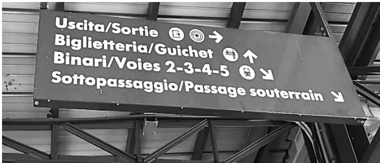
Fig.2 : signalétique bilingue italien-français à la gare d'Aoste