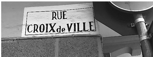
Fig.4, Fig.5, Fig.6 : affichage seulement en français

qu'héritage historique et culturel mais aussi incarnation d'une langue véhiculaire internationale.