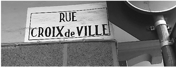
Fig.4, Fig.5, Fig.6 : affichage seulement en français