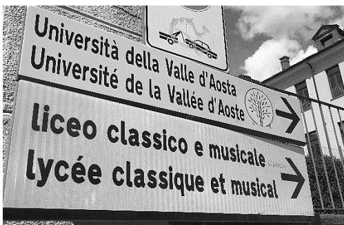
Fig.3 : bilinguisme intégral franco-italien

Le français apparaît légèrement moins souvent que l'italien comme si sa connaissance n'est pas spécialement répandue malgré le bilinguisme officiel de la région. En revanche, les deux langues nationales prédominent fortement dans les inscriptions publiques concernant le milieu éducatif.