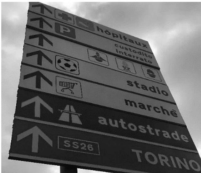
Fig.1 : signalisation routière majoritairement en italien

Avant d'analyser les affichages en question il est important de donner des éclaircissements sur leur mise en œuvre. En effet, la Région ne peut pas légiférer en matière linguistique. Ses compétences sont étendues au secteur scolaire et historico-culturel 109 . Donc, les inscriptions publiques relevant du gouvernement autonome résultent en deux langues voire seulement en italien ou en français ; en revanche, les signalisations routières ne suivent pas des pratiques systématiques au Val d'Aoste.