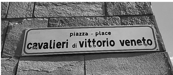
Fig. 7, Fig.8 : signalisation bilingue