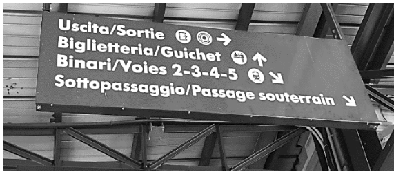
Fig.2 : signalétique bilingue italien-français à la gare d'Aoste