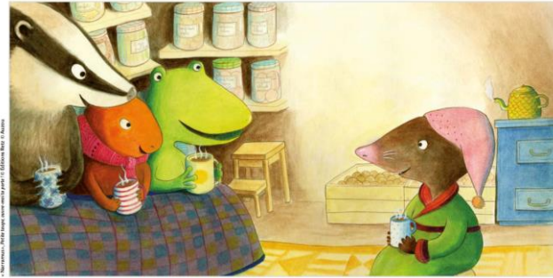
pp.14-15 La petite taupe le fait entrer et l'installe sur le canapé. Mais... TOC-TOC-TOC! Qui frappe à la porte ?