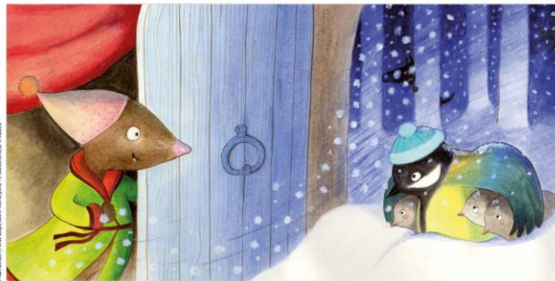
pp.16-17 C'est une mésange et ses petits. Il fait bien trop froid dans leur nid.