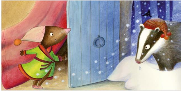
pp.12-13 Un pauvre blaireau qui prend l'eau.