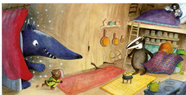
pp.20-21 AHHHHH ! Un horrible loup !