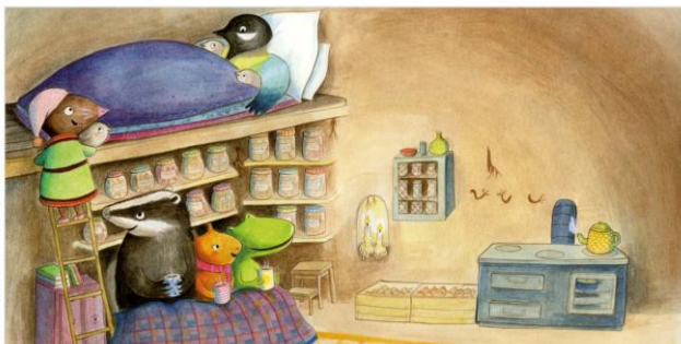
pp.18-19 La petite taupe les fait entrer et les installe dans son lit. Mais... TOC-TOC-TOC! Qui frappe encore à la porte ?