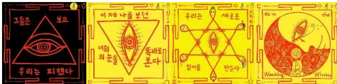
Figure 1 : Publications Instagram de Kali Hong 84 .

« Ils ont regardé et nous les avons évités. Maintenant je regarde droit dans vos yeux qui regardent. Nous créons un nouvel ordre (organisation). Nous sommes les sorcières qui regardent 83 . »