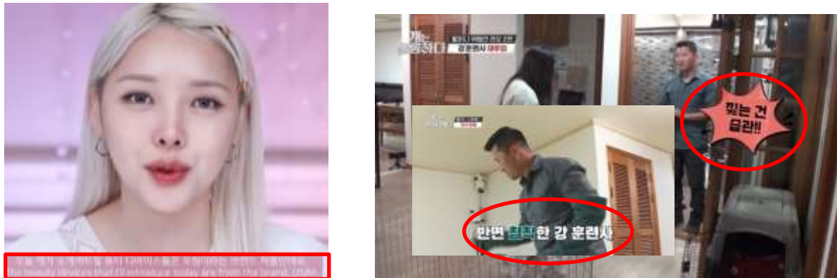
Figure 4 : Sous-titres types de la chaine KBS WORLD TV 103 .