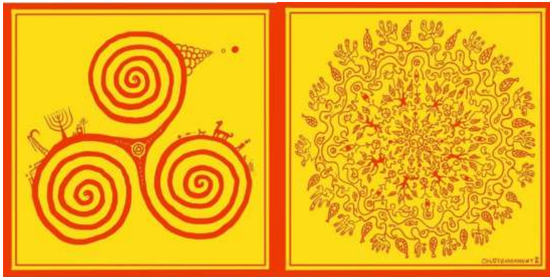
Figure 7 : Pujŏk de purification de Kali Hong 121 .

problématiques sociétales telles que la guerre, le bien-être animal, la condition de la femme et l'environnement. Les thématiques en question sont des éléments majeurs influençant son travail, ils axent sa façon d'appréhender la vie et en conséquence sa façon de travailler. Un autre élément intéressant de cet épisode concerne les chŏnghwa'bujŏk , ou talisman de purification. Les deux dernières vignettes sont des talismans censés purifier des énergies négatives.