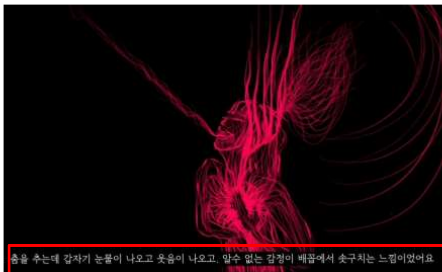
Figure 5 : Sous-titres types de la chaine 홍칼리 Kali Hong 104 .