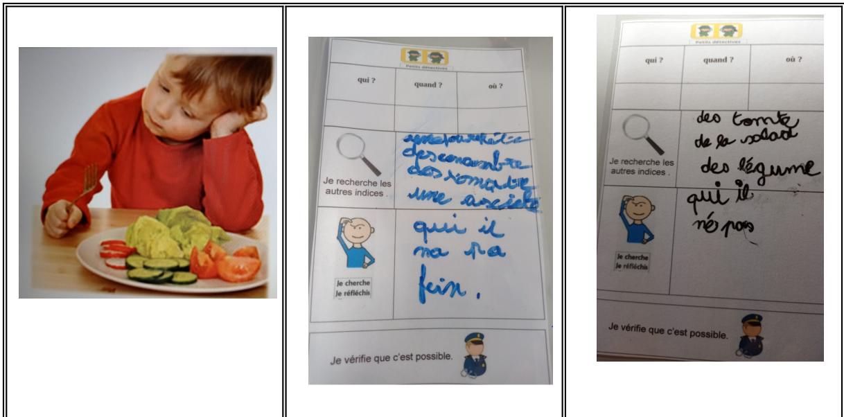
Document 13 Photographie projetée et référent individuel de chaque élève

Durant cette phase, j'ai introduit un nouvel outil : le référent de la stratégie individuel.