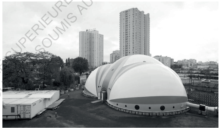
Centre d'accueil, Paris-Nord, 2017

"L'enjeu premier de ce centre d'accueil est qu'il y a des gens qui arrivent et se retrouvent dehors car ils ne connaissent pas les règles du jeu ici, en France." 3 p.149