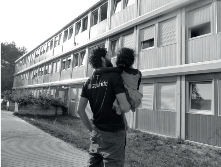
ContainerDorf, Berlin, 2018

article 34 sur son terrain de recherche qui est le “premier foyer de conteneur installé à Berlin en décembre 2014” 34 p.3 et duquel elle développe un propos sur les organisations entre acteur.ices de ces Containerdorf, espace-temps du transitoire allemand.