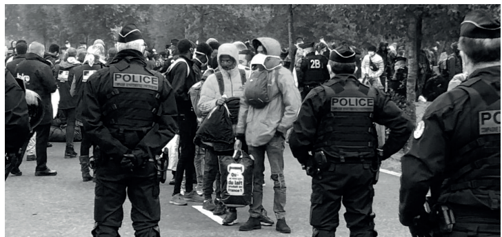
Action policière, Calais, 2021

À la suite de ce développement mon propos se tournera sur le développement de cet espace-temps comme un phénomène discriminant, excluant, qui fait partie intégrante de notre système-monde.