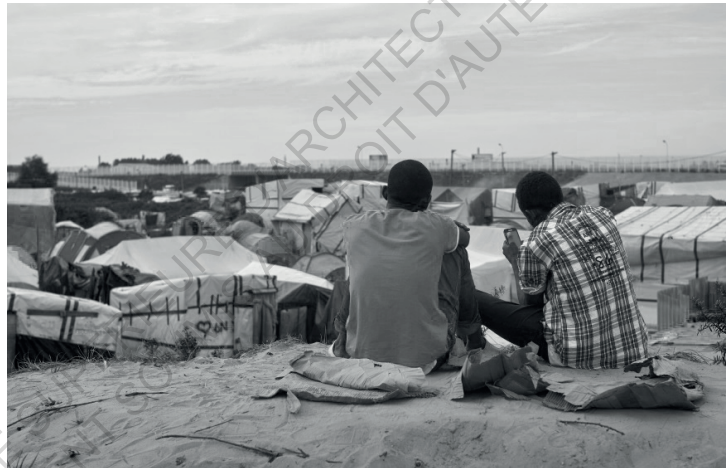
Centre d'accueil d'urgence, Lampedusa, 2017

"Le rassemblement des migrants soutenu par l'infrastructure du campement devenu une cité manifeste leur droit à une existence politique, l'acte porte en lui-même leurs revendications" 3 p.53