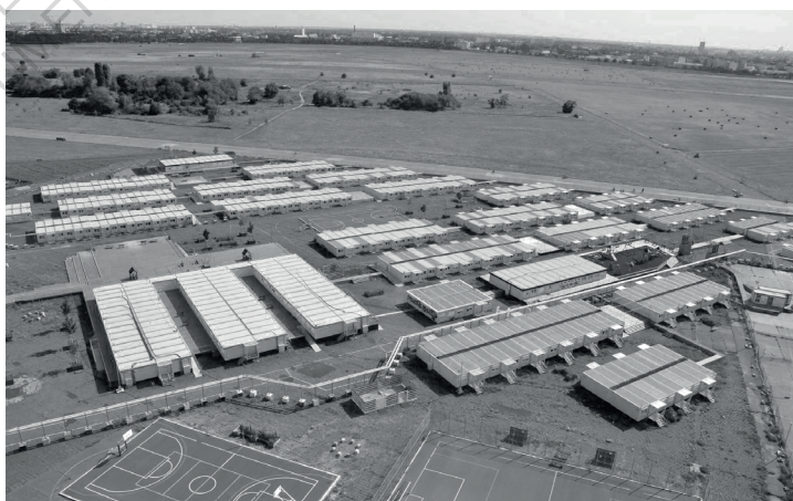
ContainerDorf, Tempelhofer Feld, Berlin, 2016

Tout ce qui faisait vie avant ce lieu est défait. L'exilé.e vit alors dans la perte de soi car c'est la seule possibilité avancée par le cadre légal. Forcer de retenir son besoin de déployer sa "puissance vie" 2 p.38.