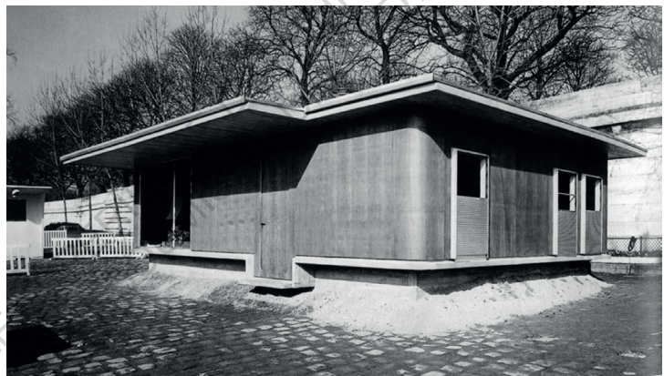
Maison des jours meilleurs, Quais de Seine, Paris, 1956

Avant l'hiver 1954 et l'appel de l'Abbé Pierre pour loger en urgence les personnes vivant dans la précarité et dans la rue la notion de transitoire appartenait au vocabulaire militaire et à ses campements montables et déplaçables. C'est alors que Jean PROUVE introduit le terme de transitoire dans le monde civil en produisant sa maison des jours meilleurs 7 , en réponse à l'appel de l'Abbé Pierre et pour produire un logement d'urgence, de passage entre le monde de la précarité absolu et celui du logement "de droit commun" 8 .