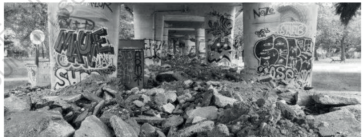
Square Vertais, Nantes, 2018

Arrive alors le point de non-retour et cette non-réponse assumée des services publics quant à la gestion de ce besoin d'hébergement d'urgence. Pelleuse en action, le square est retourné, dévisagé. Tout cela pour éviter le retour de nouvelles.aux voisin.es qui "font taches" dans cette métropole en plein développement et pourtant supposément socialiste.