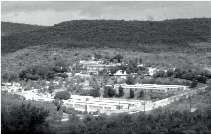
Centre de Moria, Lesbos, 2017