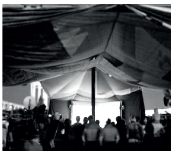
Interventions du P.E.R.O.U., bidonville de la Folie, Grigny, 2014