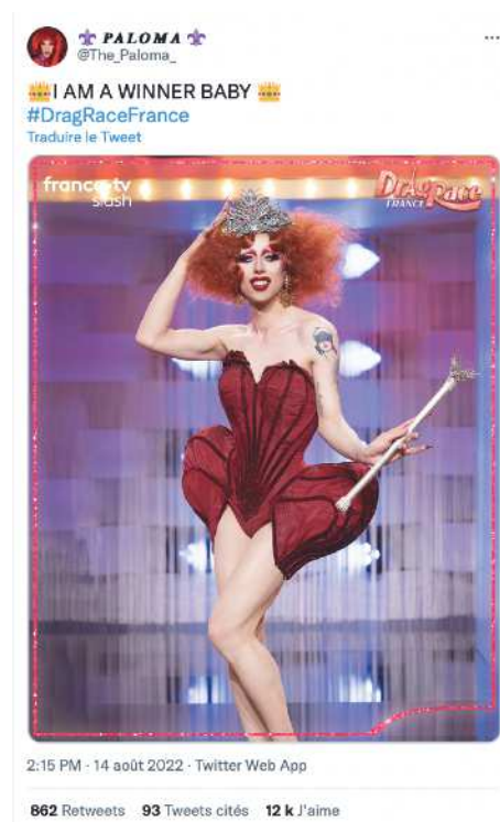
Paloma [@The_Paloma], « I am a Winner Baby », Twitter , 14 août 2022, URL