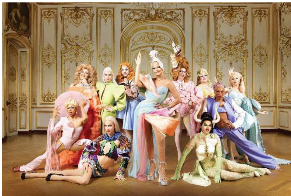
Figure 3. Casting de Drag Race France

« Drag Race France Saison 1 - Casting », France Télévisions , 2022.