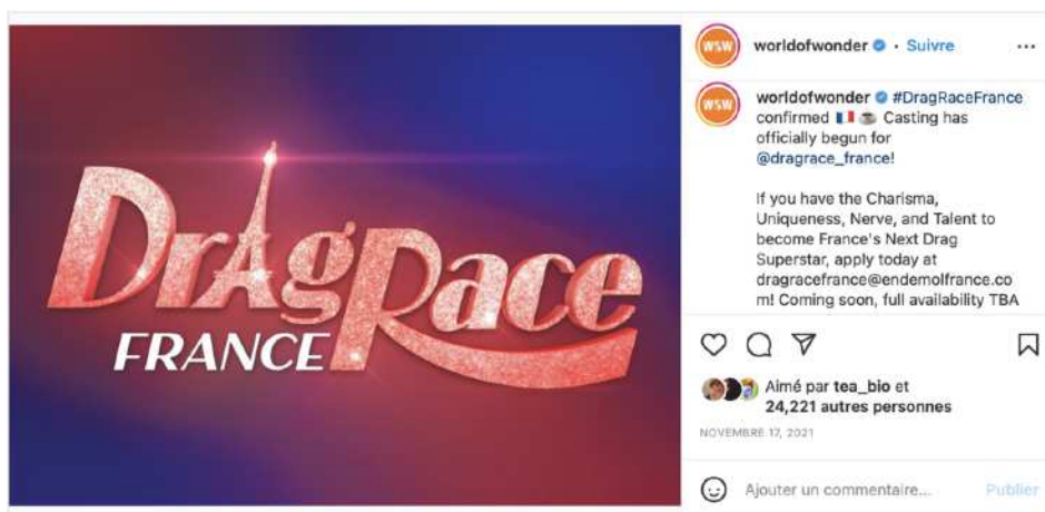
Figure 2. Post instagram d'annonce de Drag Race France de WOW

[@worldofwonder]. « Drag Race France confirmed ». Instagram , 17 novembre 2021, URL