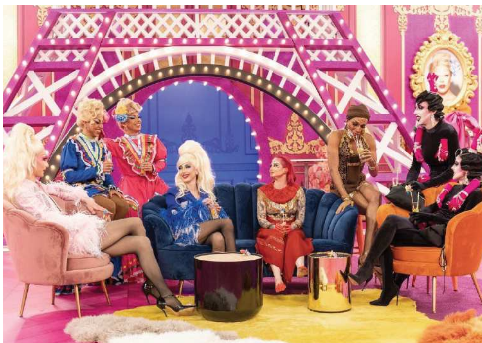
Capture d'écran - Drag Race France . 2022. Saison 1, Episode 7, « Sororité », Réalisé par Raphaël Cioffi. Diffusé le 25 juin 2022 sur France 2.

Il a été également choisi de mettre en place des éléments visuels rappelant la France au sein du décor de Drag Race France . Nous pouvons voir dans le visuel ci-haut la présence d'une reproduction du bas de la Tour Eiffel au niveau de l'entrée de la workroom 77 . Utilisé alors comme un symbole de la France, le choix du monument n'est pas anodin. Gilles Teissonnières explique « La tour Eiffel constitue [...] le véhicule de valeurs auxquelles sont conviés à participer et à témoigner les visiteurs du monde entier. Ce cadre spatial donne force à l'événement et fournit à l'extérieur des frontières une certaine image de la France. En cela,