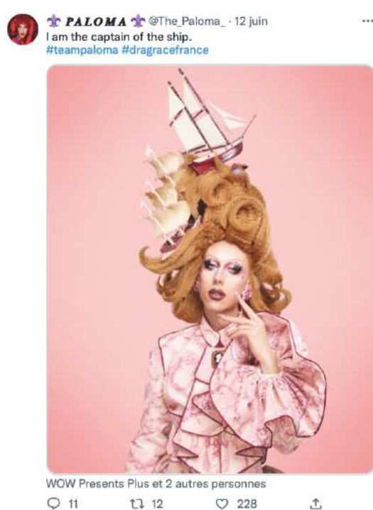
Paloma [@The_Paloma], « Annonce participation DRF », Twitter , 12 juin 2022, URL