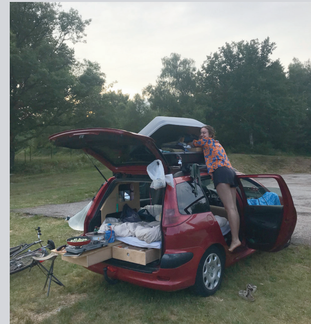
1 Photo de la 206SW de Lucie

Je pense que pour moi c'est temporaire. Mais c'est quand même une grosse période. Genre je me vois pas juste faire ça 2 semaines par ci par là. Je trouve ça agréable de vivre dedans. J'aimerais beaucoup vivre dans ma voiture tout l'été. Enfin, pouvoir vivre dans la voiture la belle saison quoi. Et après avoir un appartement quand il fait froid, genre de octobre, novembre à avril.