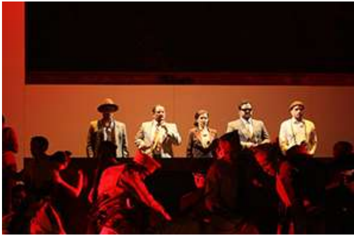
Mise en scène de Gilberto Valenzuela, Fine arts center, San Juan, 2011.

La mise en scène de Gilberto Valenzuela met l'accent sur cette structuration de l'espace par la lumière. On remarque ainsi que lorsque les journalistes entrent