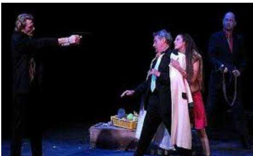
Mise en scène de Ladislav Chollat, Compagnie Vingtième théâtre, La Comédie de Picardie, Amiens, 2009.

Il décide également d'utiliser des costumes modernes. Les hommes sont vêtus de costumes avec cravates. La corruption de la justice corinthienne est représentée par ces costumes qui assimilent Créon et ses gardes à la mafia.