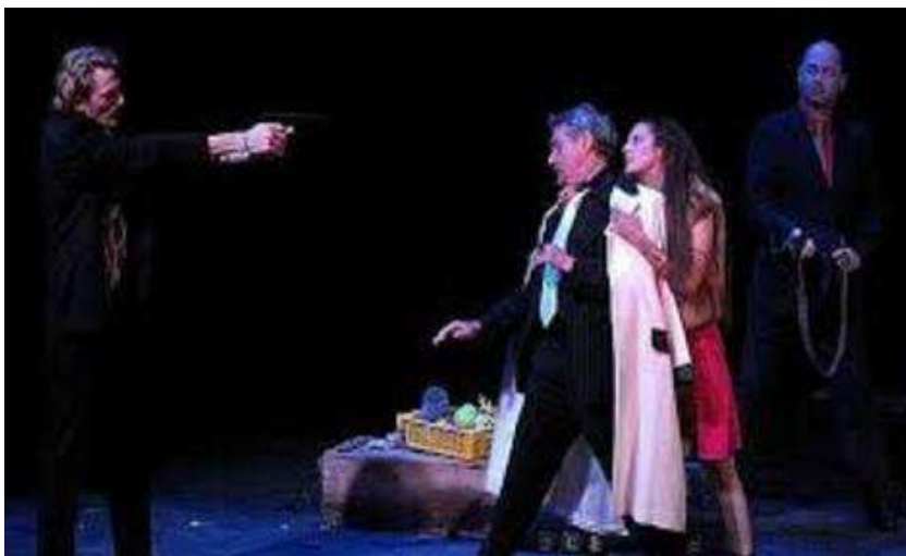
Mise en scène de Ladislav Chollat, Compagnie Vingtième théâtre, La Comédie de Picardie, Amiens, 2009.

Il décide également d'utiliser des costumes modernes. Les hommes sont vêtus de costumes avec cravates. La corruption de la justice corinthienne est représentée par ces costumes qui assimilent Créon et ses gardes à la mafia.