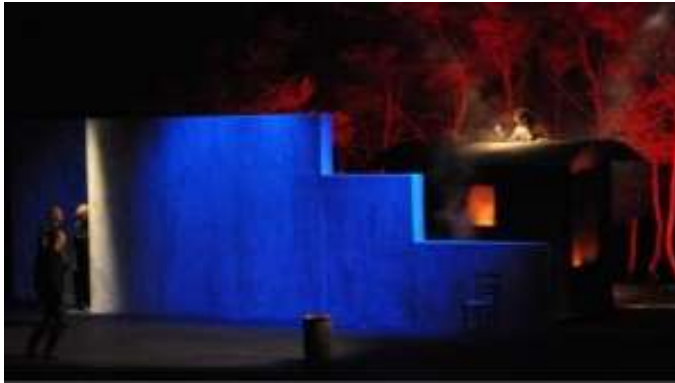
Mise en scène de Laurent Ziveri, Uppercut théâtre, Carqueiranne, 2010.

En effet, les deux gardes semblent être des hommes de main armés, tandis que Créon est habillé d'un long manteau blanc qui l'assimile au parrain, chef de la mafia. Un an plus tard, Laurent Ziveri met en scène Médée dans une scénographie proche de celle de Ladislav Chollat. Les mêmes éclairages sont présents, ainsi que la roulotte de Médée.