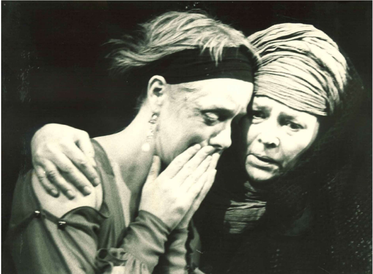
Mise en scène de Lennart Olsson et Dan Nemteanu, théâtre de Malmö (suède), 1981.

À côté d'Œnone, Phèdre est représentée en détresse, victime de violence. Bien qu'elle ait des boucles d'oreilles, bijoux qui rappellent son statut royal, son visage est marqué et ses cheveux semblent avoir été rapidement coupés. Elle est représentée en victime de violences conjugales. Au portrait de ce Thésée suédois vêtu en guerrier, répond la représentation de Vincent Dussart. Dans sa pièce, seul Thésée a un costume modernisé.