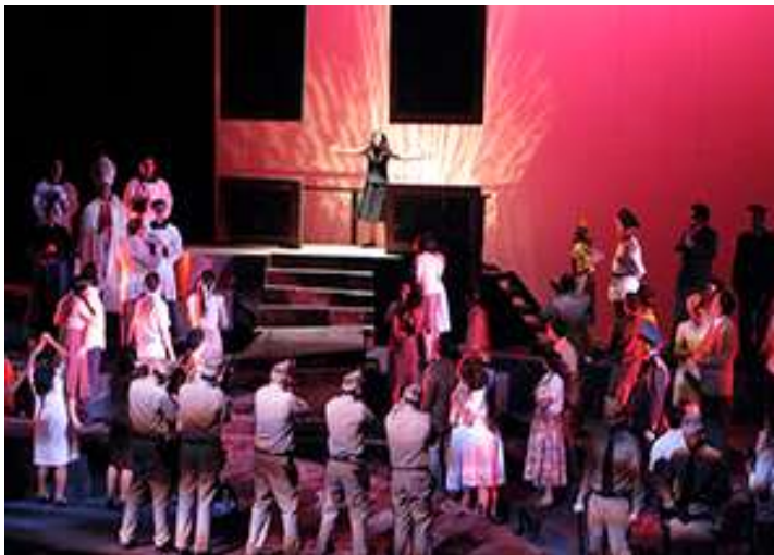
Mise en scène de Gilberto Valenzuela, Fine arts center, San Juan, 2011.

en scène, la lumière porte sur eux. Cependant, au premier plan la foule se débat avec l'armée dans une lumière rouge plus obscure. Ce jeu de plans et de lumières vient signifier ce qui se cache derrière la mise en scène du régime. Dans la dernière scène de la pièce, un jet de lumière porte sur Antigone.