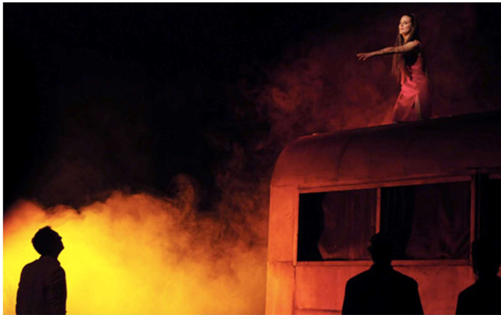
Mise en scène de Ladislav Chollat, Compagnie Vingtième théâtre, La Comédie de Picardie, Amiens, 2009.

de décor semble indiquer qu'ils restaient sur scène à surveiller Médée, ce qui renforce sa marginalisation. Cependant, la roulotte que Médée enflamme à la fin de la pièce n'est pas présente dans cette maquette. Les autres metteurs en scène ont décidé de la faire paraître sur scène. Ainsi, Ladislav Chollat nous montre Médée sur la roulotte en feu grâce à un jeu d'éclairage.