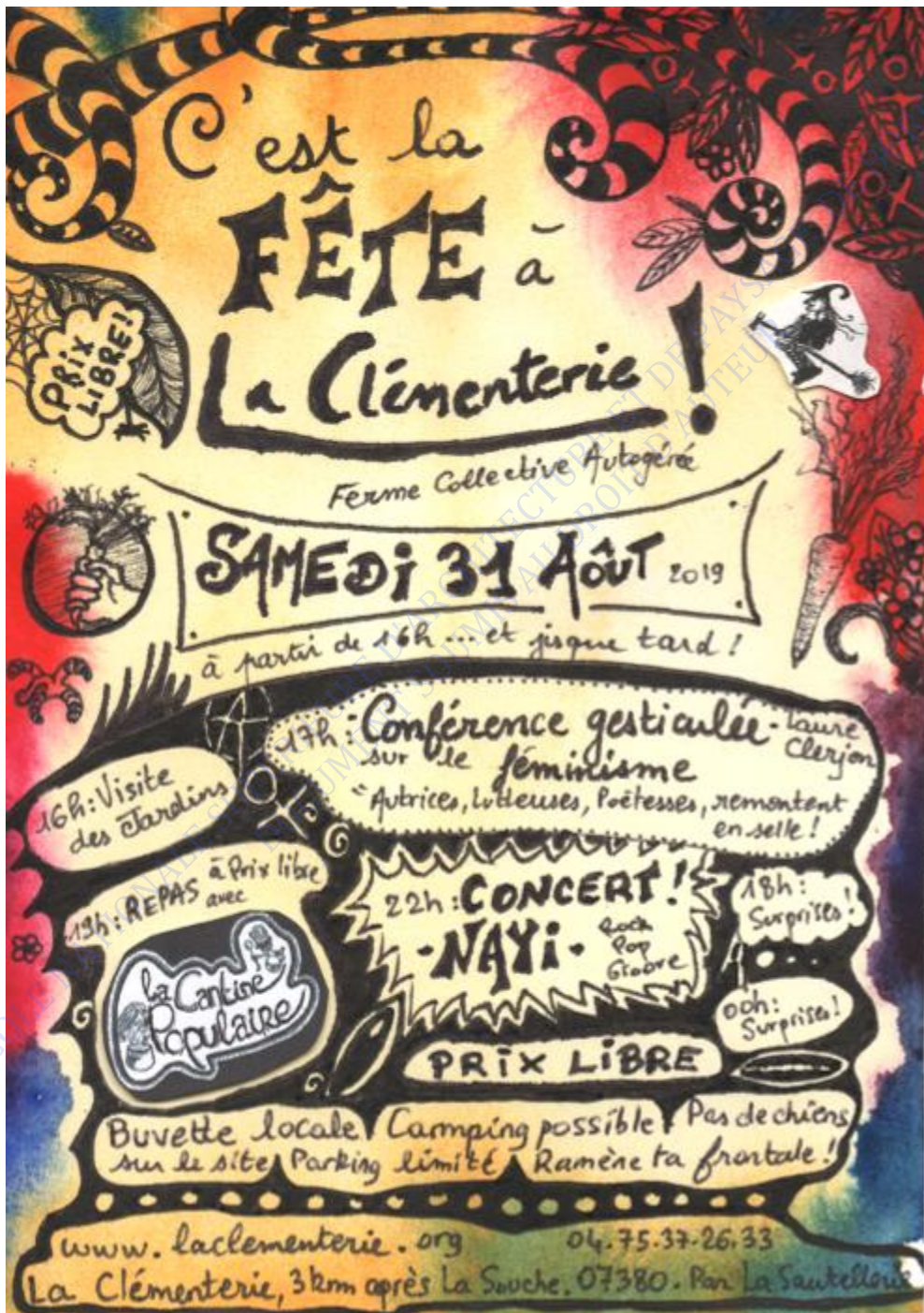
Affiche pour une fête à la Clémenterie, auto-produite à la main, rendant compte de la dimension politique de ce lieu de vie (repas à prix libre, conférence sur le féminisme) et d'un certain esprit de "débrouillardise".

Seulement, chaque collectif partage des approches communes, tissées entre elles. Le point commun intrinsèque aux collectifs est souligné par Madeleine Sallustio. Pour qui les néo-paysans et plus particulièrement ceux qui s'organisent en collectif sont animés par la volonté "d'accroître leurs possibilités d'émancipation individuelle tout en construisant une critique des rapports de production du capitalisme industriel et du consumérisme qui l'accompagne" (Sallustio 2020).