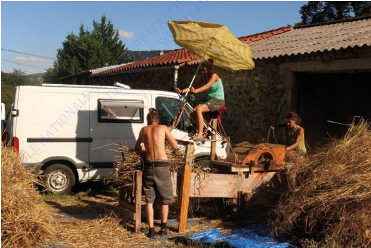
Batteuse à vélo - Collectif de Bertizène.

On constate que les collectifs, au-delà de la polyvalence des activités, se réapproprient des savoirs anciens tels que la traction animale, pratiquée par les deux collectifs. Cette redécouverte des savoirs et des outils anciens n'est pas issu d'un sentiment nostalgique à leurs égards, mais bien d'une volonté de réappropriation en faveur de leur combat pour l'autonomie. Les outils et les savoir-faire de l'avant pétrole sont pour les néo-paysans, un puits de ressources intarissable. Nombreux sont les exemples d'outils hybrides, bricolés, ré ajustés aux nécessités des collectifs, comme les faucheuses-lieuses ou la batteuse à vélo de la ferme de Bertizène étudié par Madeleine Sallustio.