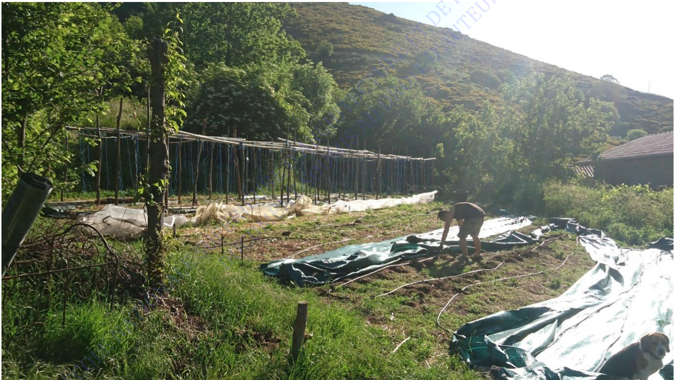
Préparation des Faysses, les tuteurs pour le maraîchage sont fait des gaulis de châtaigniers, arbre aux milles ressources. Ficelles agricoles, goutte à goutte, paillages sont utilisés tous les ans.

Le collectif a saisi l'opportunité de construire un bâtiment agricole pour y inclure un logement et palier aux besoins, en s'affranchissant des règles qui interdisent l'ajout d'un logement dans un bâtiment qui n'a pas cette vocation. En travaillant conjointement avec les charpentiers et les maçons sur le chantier de la miellerie, ils ont pu baisser les coûts et suivre au jour le jour l'avancement des travaux. Récemment, le collectif s'est doté d'une serre de pépiniériste en verre (après plusieurs années sans serre, une occasion intéressante s'est présentée), n'hésitant pas à faire plusieurs centaines de kilomètres pour se doter d'un outil de travail pratique, résistant et économique.