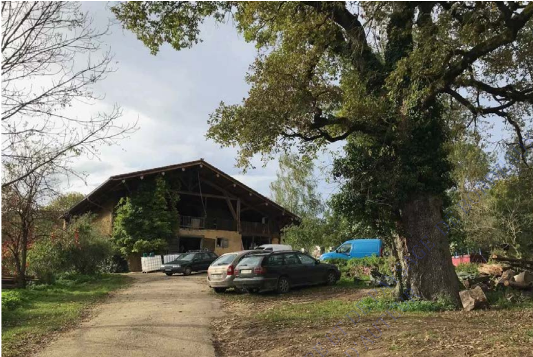
“Bâtiment principal de Bragat, derrière les cuves l'étable” source