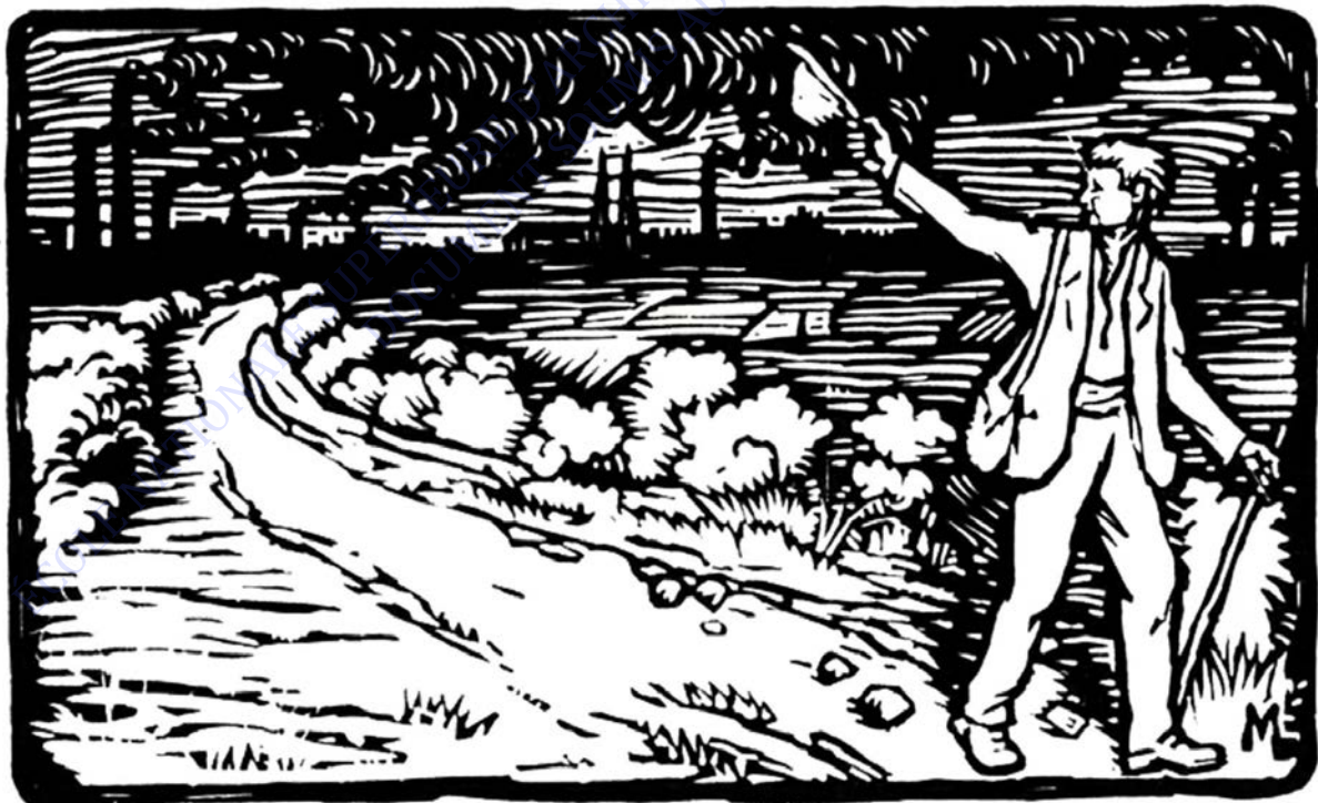
"L'En dehors" hebdomadaire anarchiste, gravure de Louis Moreau de 1922, l'ouvrier canne en main, renonce aux vapeurs des usines et s'en va rejoindre les champs.

Ces lieux expérimentent de nouveaux modèles collectifs d'organisation, autour de l'autonomie, de modes d'organisation horizontale, la réduction des besoins, une "vie simple" ayant pour but de démontrer d'autres façons d'habiter la Terre (Beaudet 2006 cité par De Galzain 2016). Ces initiatives anarchistes du début du siècle dernier font écho au mouvement de repaysannisation actuel.