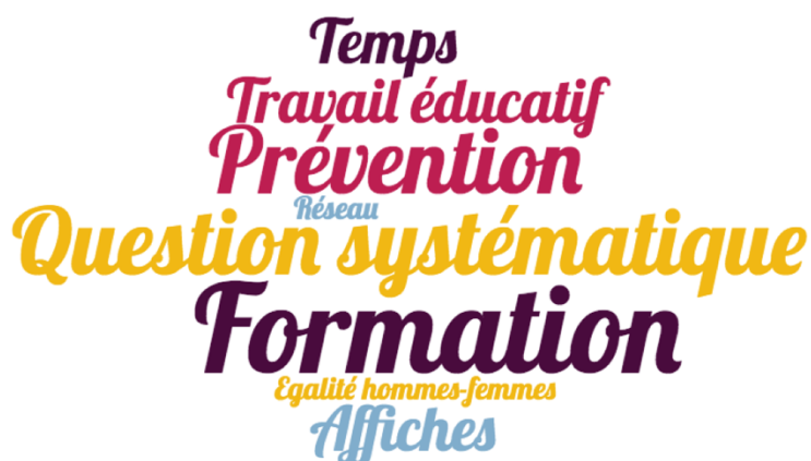
Figure 2 : Axes d'amélioration du repérage et de la prise en charge des violences

La moitié des professionnels interrogés pensent qu'il faut davantage de formations sur le thème des violences conjugales que ce soit dans la formation initiale ou pendant la carrière.