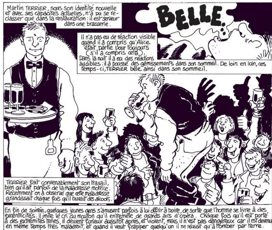
Illustration extraite de Manchette - Tardi, La position du tireur couché , Paris, Futuropolis, 2010.

(Jean-Patrick Manchette, La position du tireur couché , Paris, Gallimard, 1981, p. 197)