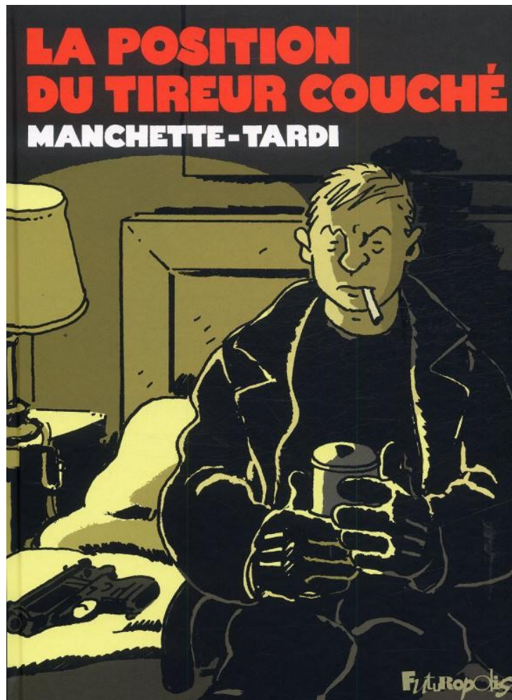
Illustration extraite de Manchette - Tardi, La Position du tireur couché , Paris, Futuropolis, 2010.

Le tueur à gages est un avatar de la Mort qui accumule toute une symbolique moderne à l’heure de la culture de masse et du mondialisme. C’est un personnage déclassé et marginal, traînant souvent derrière lui un passé trouble, et qui vit dans l’ombre et l’anonymat, tout en servant les intérêts des classes néo-aristocratiques.