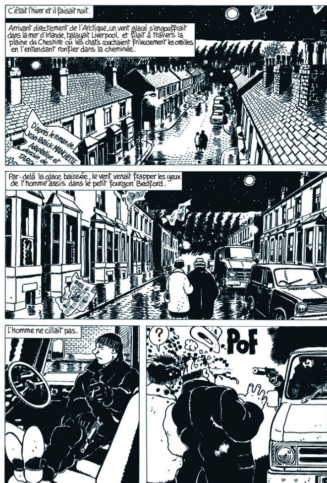
Illustration extraite de Manchette - Tardi, La position du tireur couché , Paris, Futuropolis, 2010.

(Jean-Patrick Manchette, La position du tireur couché , Paris, Gallimard, 1981, p. 9)