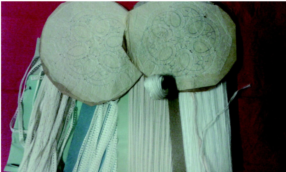
Source privée, matériels pour réaliser un napperon en dentelle.