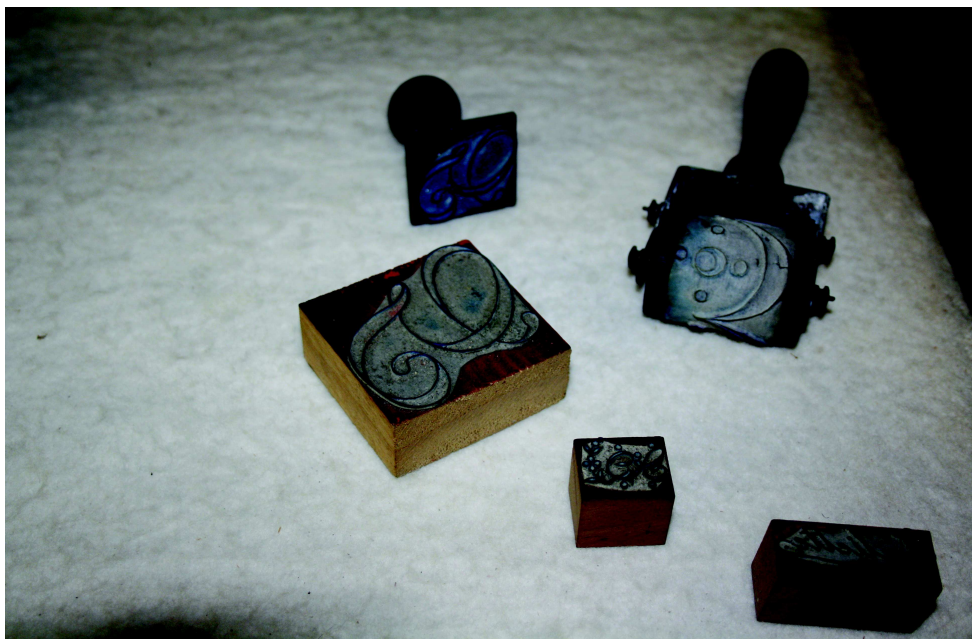
Tampons issus de la collection de l'Ecomusée de Fougerolles datant du XXe siècle.

Pour résumer, il faut retenir que les patrons que ce soit de dentelle ou bien encore de broderie sont des créations qui dépendent de la tendance de la mode.