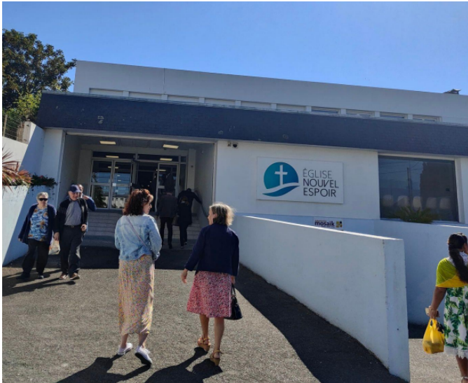
Annexe 2 : Position géographique des Églises à Brest