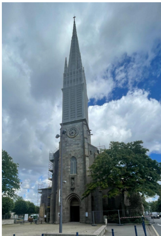
Annexe 7 : Église ACER Brest (Assemblée chrétienne pour l'évangélisation et le Réveil)