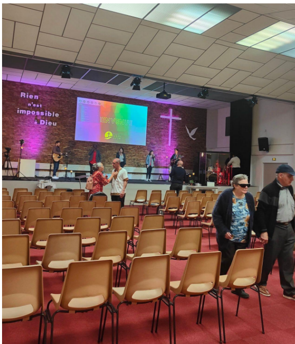
Annexe 5 : Église Protestante Unie, rue Voltaire