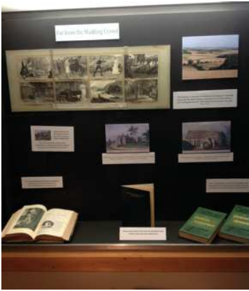
Vitrine sur Far From the Madding Crowd