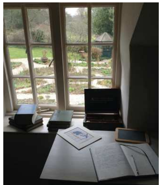
Le bureau de Thomas Hardy dans sa chambre - vue sur le devant de la maison