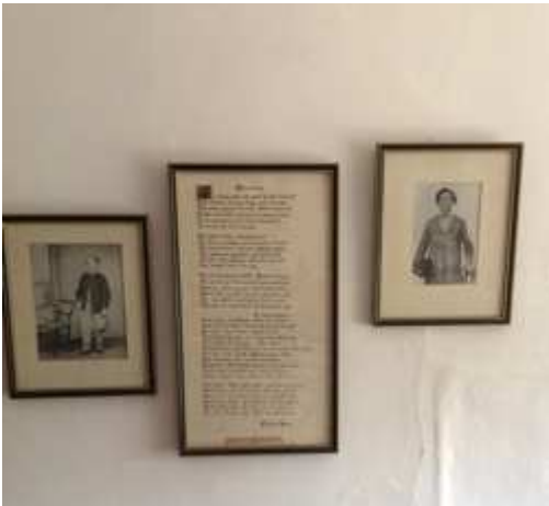
Au mur, des photos de lui jeune et un de ses poèmes