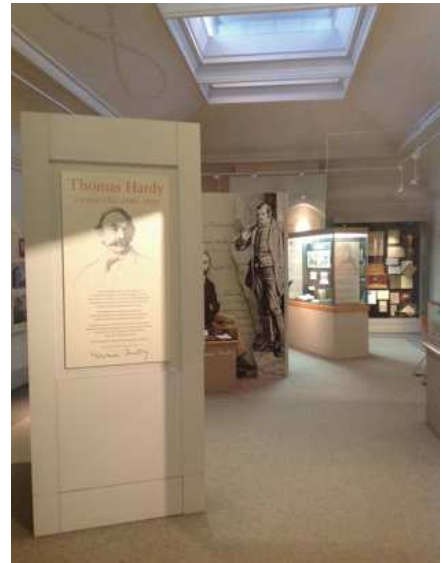
Vue de la pièce principale à l'entrée