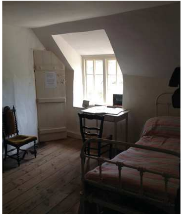
Chambre de Thomas Hardy et son bureau