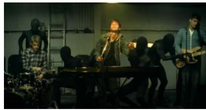
Des corps-machines et marionnettes dans « Houdini » [1:01 - 1:32].