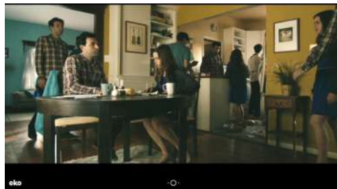
Espace dérangé et multiple dans Possibilia.

Liés par le thème du multivers, de nombreux éléments de Possibilia se retrouvent dans EEAAO . En mettant en parallèle toutes ces scènes, les Daniels prouvent qu'ils cherchent à capturer la complexité de la vie par le médium filmique. Ils jouent avec le temps et l'espace pour tenter de recréer les paramètres qui font du monde que l'on connaît ce qu'il est, et pour ça ils passent par des techniques cinématographiques, des médiums différents qui cherchent à absorber, intégrer le tout qui fait la réalité.