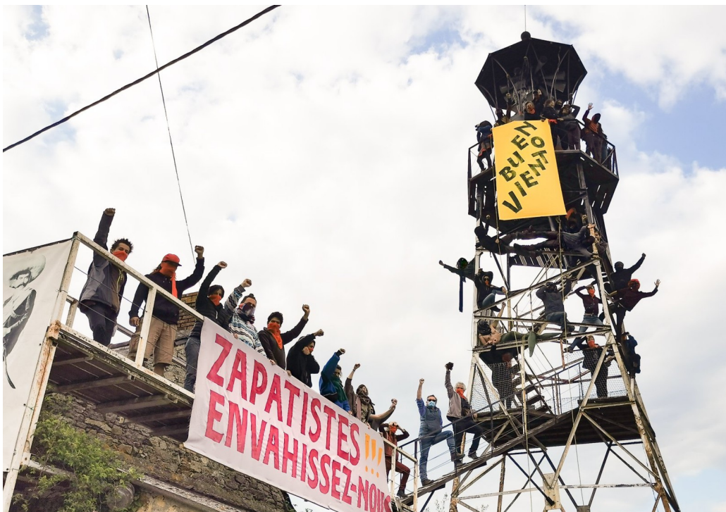
Image : « Zapatistes, envahissez-nous », banderole étendue à la ZAD de Notre-Dame-Des-Landes, 3 mai 2021, https://www.facebook.com/zadnddlif