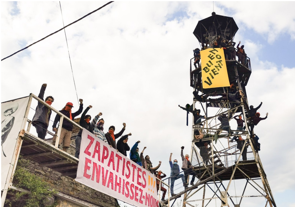
Image : « Zapatistes, envahissez-nous », banderole étendue à la ZAD de Notre-Dame-Des-Landes, 3 mai 2021