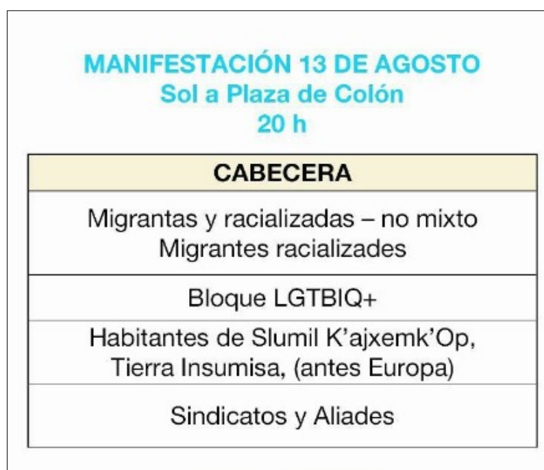
Image 8. Schéma du cortège de la manifestation du 13 août 2021, à Madrid (photographie téléchargée sur un canal Telegram comptant environ 500 abonné.es)

Pour mettre en place une solidarité intersectionnelle, les positions de privilège ou d'oppression doivent être reconnues, afin de ne pas perpétuer l'invisibilisation et la domination. Des mécanismes sont mis en place, dans les coordinations d'accueil des zapatistes et au moment des mobilisations, pour limiter ces rapports de domination. Malgré cela, des dynamiques de pouvoir restent à l'œuvre dans les coordinations.