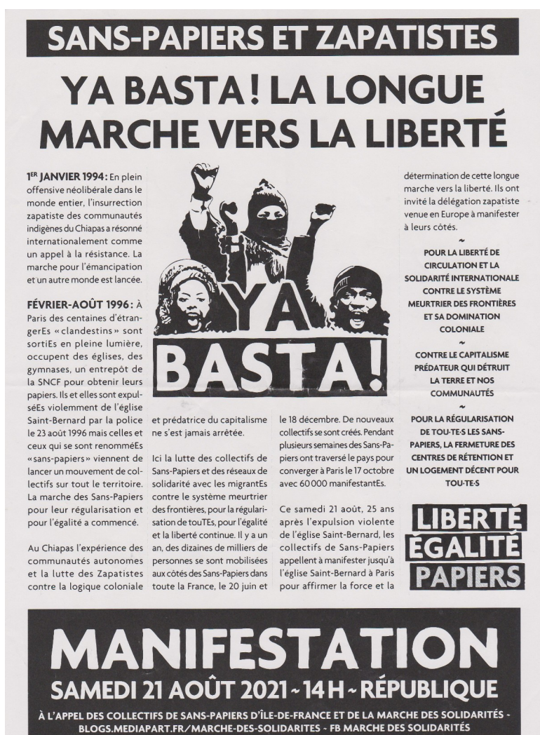
Image 2. Tract annonçant la manifestation de Sans Papiers du samedi 21 août 2021, distribuée à l'assemblée parisienne du mercredi 21 juillet

Un premier ensemble de dispositifs de sensibilisation mobilisés relève de dimensions visuelles. Une certaine esthétique militante se crée autour du voyage des zapatistes, qui peut émouvoir par la mise côte à côte d'éléments esthétiques ou symboliques propres à plusieurs luttes distinctes. Par exemple, un tract annonçant une marche du mouvement des sans papiers juxtapose des éléments propres à ce mouvement et des éléments zapatistes. Ce tract annonce la manifestation du 21 août 2021, à Paris. Le titre et slogan principal est « Basta Ya ! », qui reprend le « ya basta » zapatiste et fait écho au slogan repris dans les manifestations de sans papiers : « y'en a marre ». Sur l'image centrale, une personne cagoulée à la manière des zapatistes accompagne deux autres personnes racisées, le poing levé.