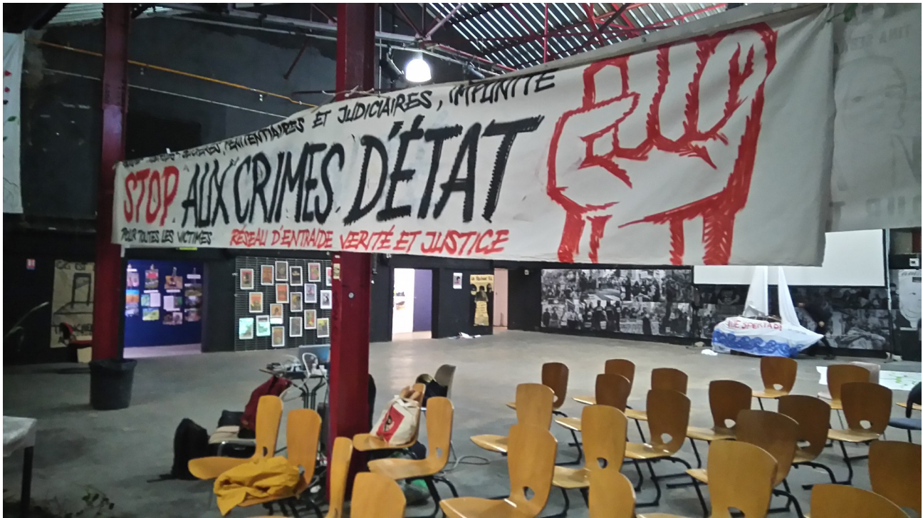
Image 4. A droite des gradins, plusieurs rangées de chaises débordent sur l'autre partie de la salle (photographie prise le 10 juillet 2021)

Au dos de cette banderole, une autre reprend des affiches zapatistes. Au fond de la salle, un militant d'Extinction Rébellion a accroché des dessins en noir et blanc dénonçant l'urgence climatique et l'inaction des gouvernements. Autour de la scène, aux positions les plus centrales, se trouvent les banderoles qui portent un message de bienvenue aux zapatistes. L'accumulation des banderoles et des signes militants s'accompagne d'une forte hétérogénéité des messages et des esthétiques.