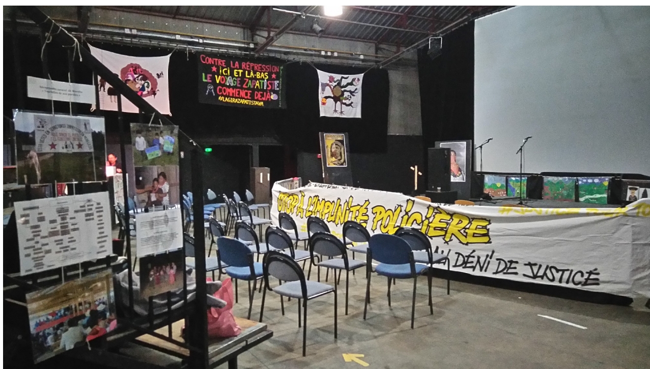
Image 3. Installation et décoration de la salle de la Parole Errante pour l'accueil de l'Escadron 421 (photographie prise le 10 juillet 2021)

D'autres banderoles ont été installées. En haut des gradins, deux autres banderoles appellent à la « justice et vérité » pour des victimes de violences policières, suivant une esthétique de graffitis urbains. A droite des gradins, une autre banderole très large (image 4) indique « stop aux crimes