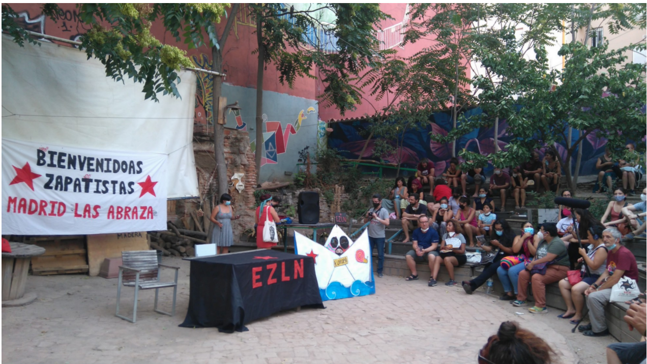
Image 5. Événement de rencontre de militant.es européen.nes à Madrid (photographie prise le 11 août 2021)

Lors de ces événements, nombreuses sont les militant.es qui portent des tee-shirts sérigraphiés évoquant le voyage des zapatistes. Cet élément visuel génère un sentiment d'appartenance, en créant un signal vestimentaire commun.