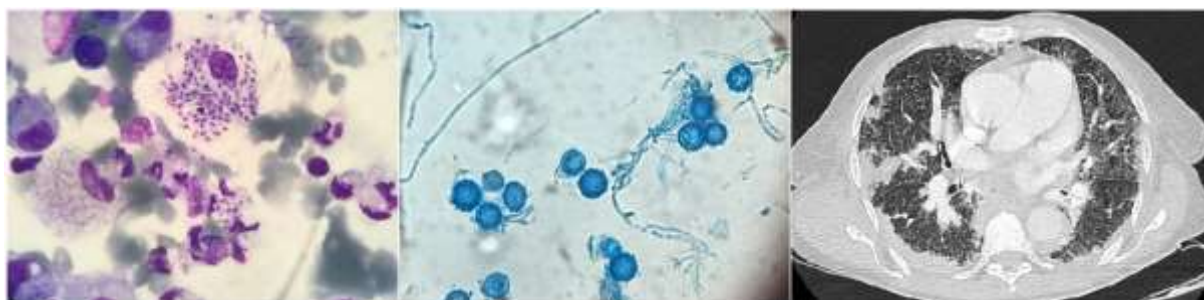
Figure 1: Image 1 : Histoplasma intra cellulaire sur examen direct de moelle osseuse ; Image 2 : Histoplasma sous forme filamenteuse après culture ; Image 3 : Scanner thoracique Mme A. : atteinte réticulo nodulaire, condensations sous pleurale et adénopathies péri-hilaires

Nous avons inclus les patients rétrospectivement via le diagnostic microbiologique d'histoplasmose et à partir des données du Département d'Information Médicale (DIM) pour lesquels le codage CIM établissait le diagnostic d'infection par l'histoplasmose (code CIM B39).