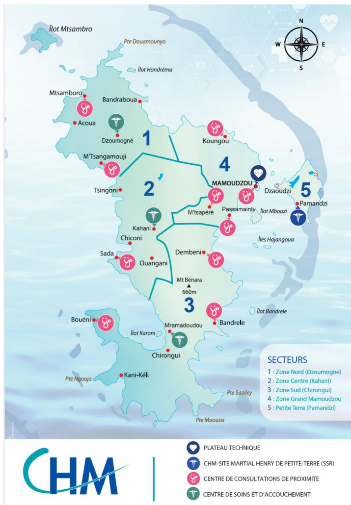
Figure 2: Carte de la démographie

L'offre de soin publique est gérée par le CHM sur l'ensemble du territoire :