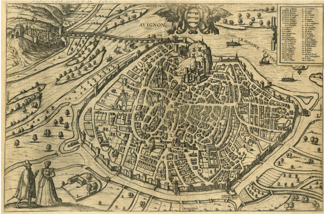
Annexe 6 : Plan d'Avignon, XVIe siècle. Gravure -Musée Calvet. Extrait du Theatrum de Braun, 1572.