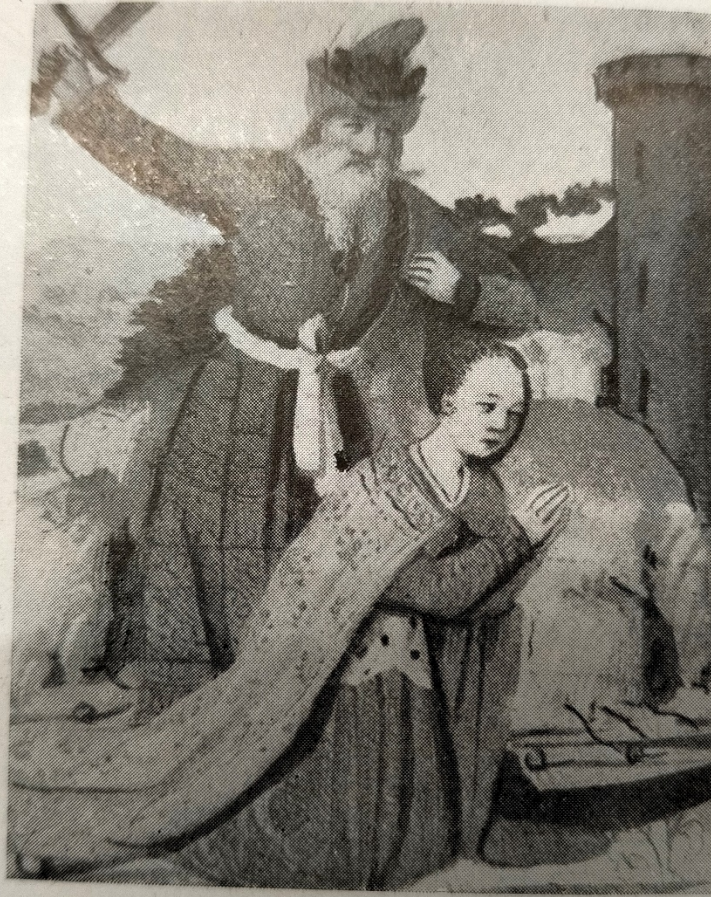
Martyre de sainte Barbe. Miniature du Missel de Souvigny , xv e siècle.

Annexe 7 : Missel de Souvigny, Martyre de sainte Barbe , XVème siècle. Image tirée de l'ouvrage de Paul de Lapparent, Sainte Barbe , 1926.