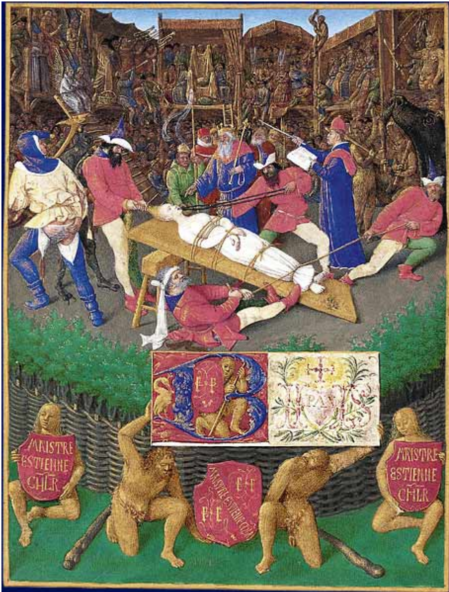
Annexe 5 : Représentation du Mystère de Sainte Apolline , Jean Fouquet. [Image disponible en ligne : http://libretheatre.fr/le-theatre-au-moyen-age/ ].