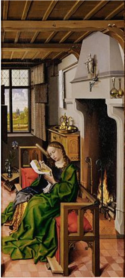
Annexe 10 : Robert Campin, Sainte Barbe , Madrid, Museo del Prado, 1438.