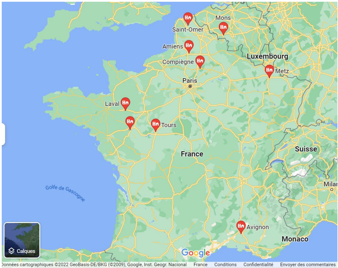
Annexe 3 : Situation des différentes villes, sur Google Maps, où furent représentées Sainte Barbe avant 1500.