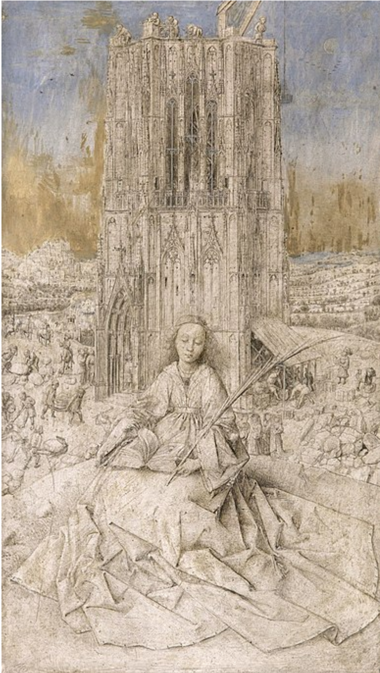
Annexe 8 : Jan Van Eyck, Sainte Barbe , Musée d'Anvers, 1437. Image disponible en ligne : https://fr.wikipedia.org/wiki/Sainte_Barbe_(van_Eyck)