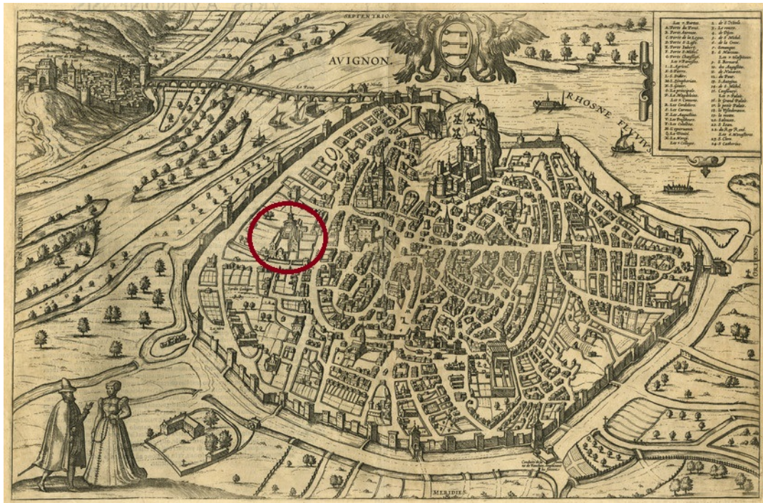
Annexe 1 : Situation du couvent des Dominicains sur le plan d'Avignon, XVIe siècle. Gravure -Musée Calvet. Extrait du Theatrum de Braun, 1572.