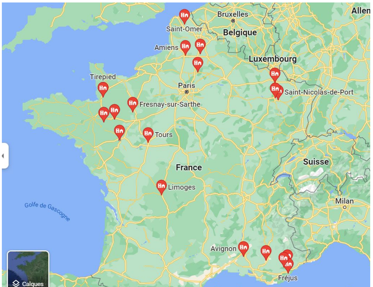
Annexe 2 : Situation des différentes villes, sur Google Maps, où furent représentées Sainte Barbe entre le XV ème et le XVI ème siècle.