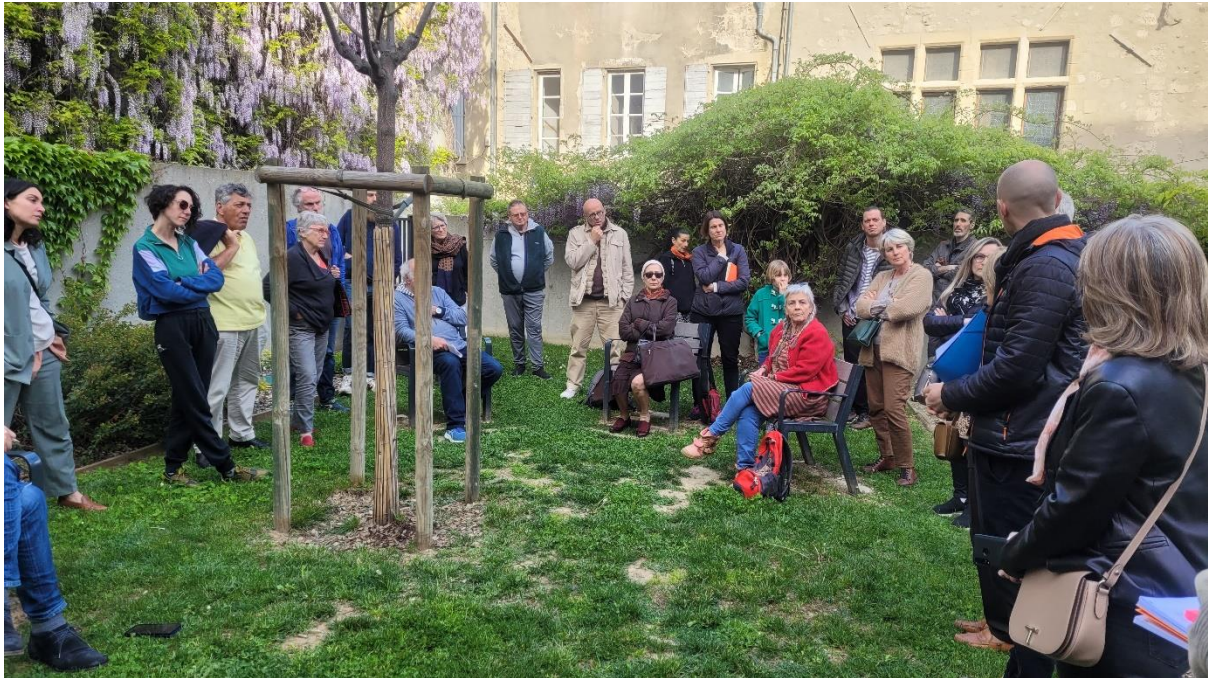
9 : L'atelier participatif du 25 avril 2023 à Romans-sur-Isère

climatique) 9 . Au contraire du Verger Participatif à Echirolles, le Permis de Végétaliser de Romans-sur-Isère se base sur une action individuelle des habitant·es, focalisant les individu·es sur leur propre performance (Gourgues, 2018).