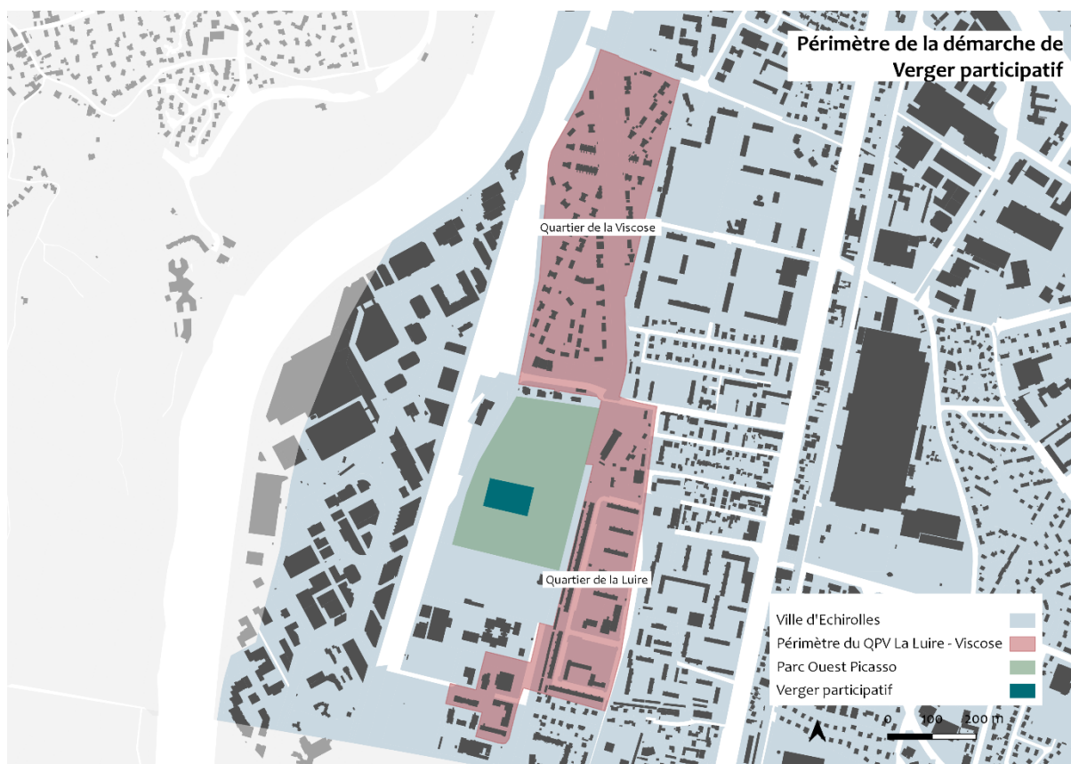
3 : Le périmètre de la démarche du Verger Participatif Réalisation : Axelle Bauzély