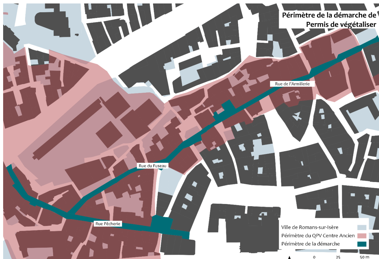
4 : Le périmètre du projet de Permis de Végétaliser à Romans-sur-Isère Réalisation : Axelle Bauzély

Romans-sur-Isère est donc une ville moyenne qui forme une agglomération avec Bourg-de-Péage, mais entourée de communes rurales. Le quartier du centre historique est un quartier avec un patrimoine architectural du Moyen-Âge, et investi aujourd'hui par de nombreux-ses commerçant-es d'artisanats d'art et des commerces de bouches, ce qui fait que le quartier reste attractif et touristique malgré l'insalubrité des bâtiments et la précarité des habitant-es.