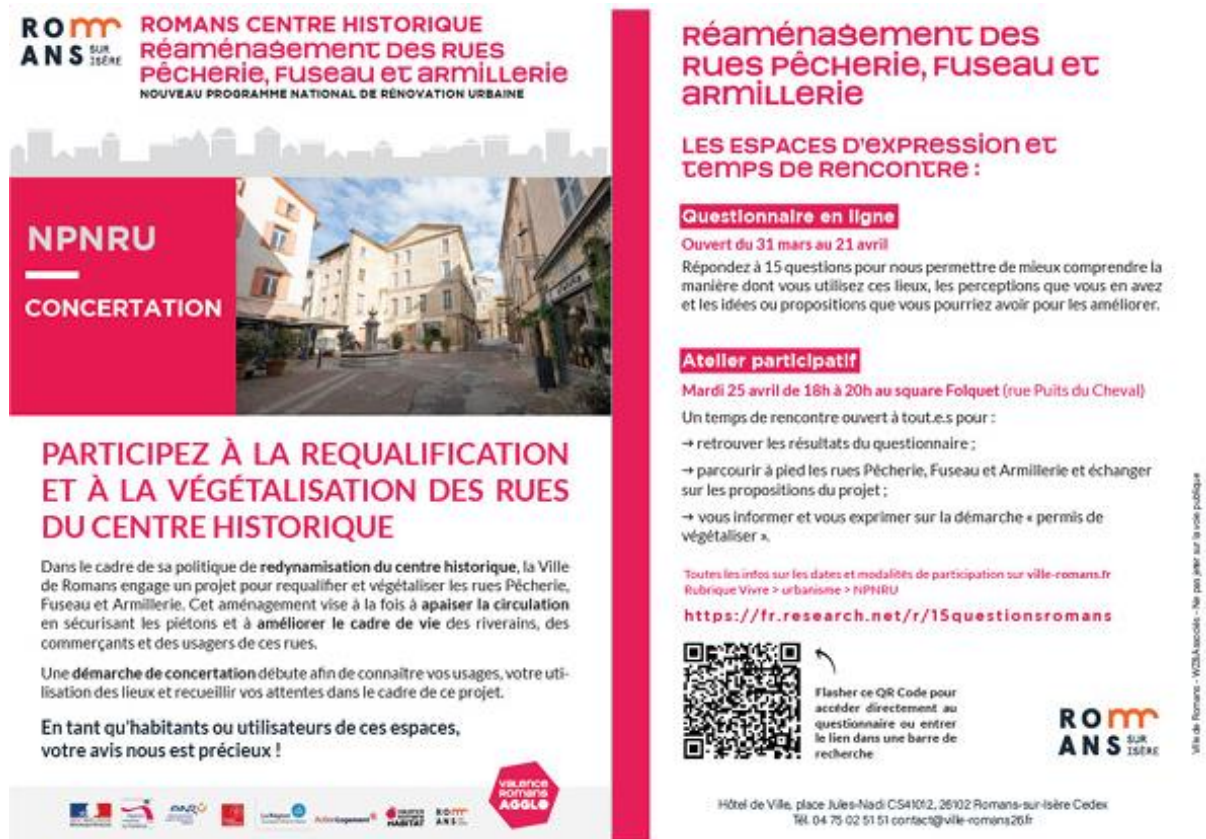
10 : Le flyer distribué pour mobiliser les habitant-es autour du Permis de Végétaliser à Romans-sur-Isère

démarche. Le projet de Permis de Végétaliser n'est qu'au stade embryonnaire et doit être précisé par la Ville avant d'être mis en place dans les rues du centre historique.