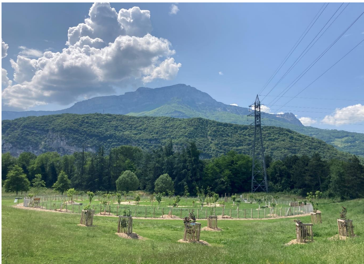
7 : Les plantations du Verger Participatif dans le Parc Ouest Picasso à Echirolles

écologique, adapter la Ville au changement climatique et démontrer, diffuser et promouvoir l'action de la commune en faveur de la transition écologique et de l'adaptation au changement climatique 4 . On retrouve ainsi sur le site Internet de la commune 5 , un item « La fabrique Citoyenne » et un autre « Echirolles territoire durable » : la ville communique autour de ses objectifs en termes de participation citoyenne et d'enjeux environnementaux.