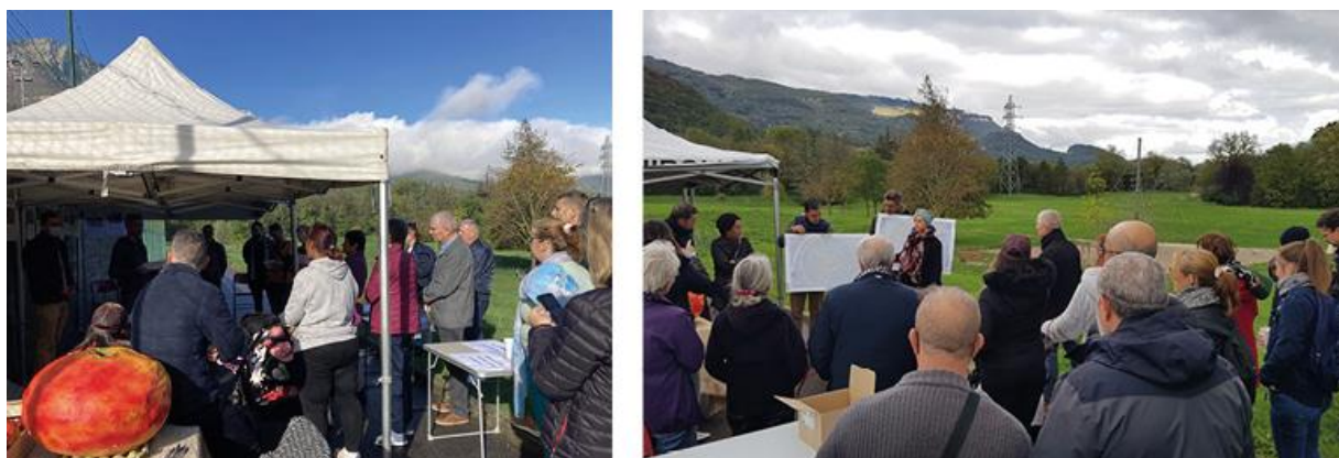
5 : Les deux ateliers participatifs permettant de recueillir les questionnements, envies et idées des habitant-es. A gauche : l'atelier du 22 octobre 2022 ; à droite, l'atelier du 5 novembre 2022.

Dans ces deux quartiers, des démarches sont mises en place par les Villes. A Echirolles, le projet initié par la Mairie ne correspond pas à une demande précise des habitant-es du quartier, contrairement à Romans-sur-Isère où les habitant-es et commerçant-es de certaines rues du centre historique souhaitent plus de végétation. Les deux Villes ont fait appel à WZ et Associés pour matérialiser un projet au plus proche des habitant-es et usager·ères.