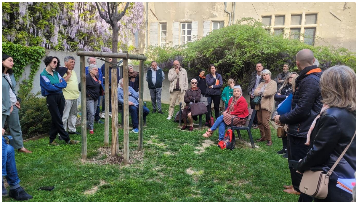
9 : L'atelier participatif du 25 avril 2023 à Romans-sur-Isère

climatique) 9 . Au contraire du Verger Participatif à Echirrolles, le Permis de Végétaliser de Romans-sur-Isère se base sur une action individuelle des habitant·es, focalisant les individu·es sur leur propre performance (Gourgues, 2018).