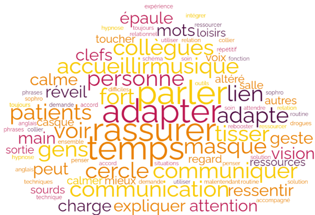
Figure 6 : mots-clefs cités par les IADE à l'évocation des techniques de prise en charge d'une situation de communication altérée

Le maître-mot de ces stratégies semble être « S'ADAPTER ».