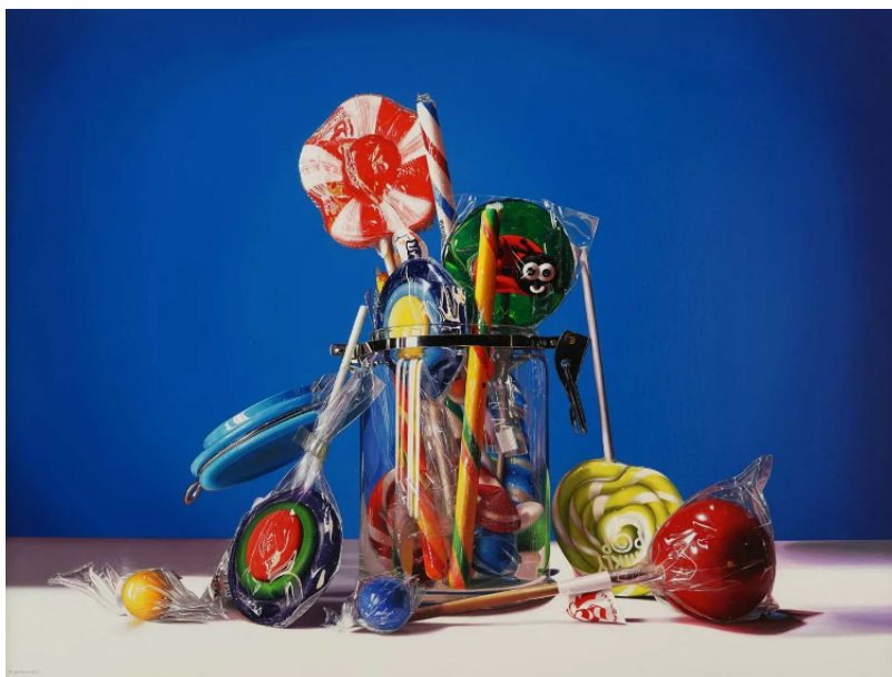
Roberto Bernardi, La girandola rossa , 2017, huile sur toile, 130 x 100 cm, galerie Mucciaccia Gallery, Singapour © Roberto Bernardi