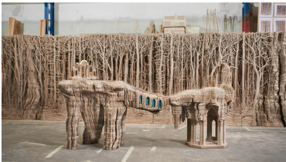
Eva Jospin, photographie de Flavien Prioreau © Eva Jospin