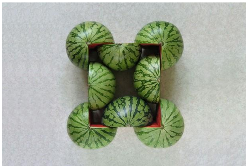
Photographie de Sakir Gökçebag © Sakir Gökçebag