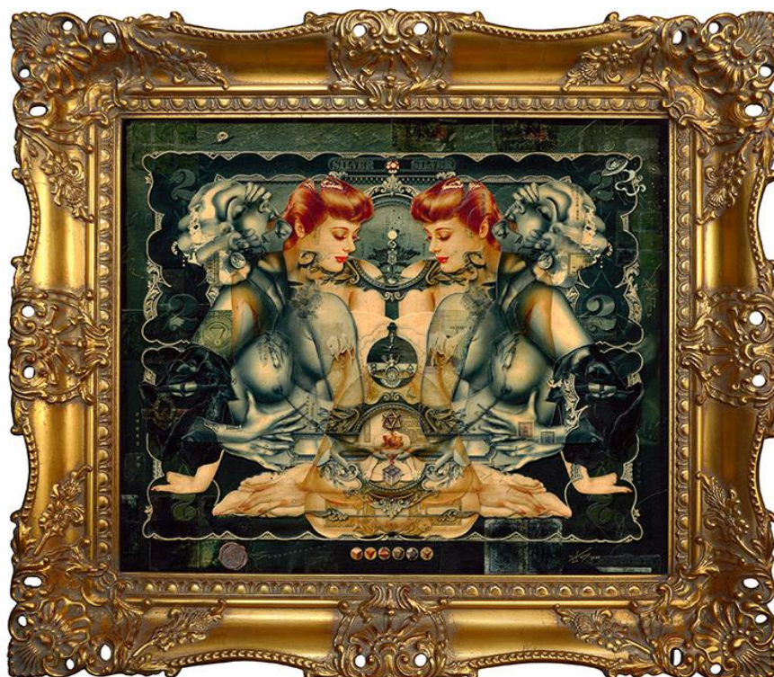
Handiedan, Goddess in us , 2020, papier, matériaux trouvés, stylo, vernis mat sur panneau de bois et cadre ornemental, 80 x 70 cm (avec cadre), 60 x 50 cm (sans cadre), collection privée © Handiedan