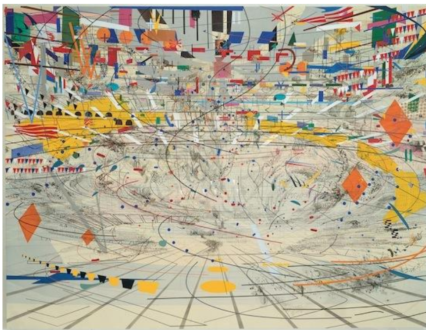
Julie Mehretu, Stadia II , 2004, encre et acrylique sur toile, 274 x 366 cm, Carnegie Museum of Art, Pittsburgh © Julie Mehretu