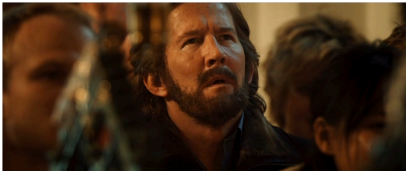
Figure 16. La Chasse