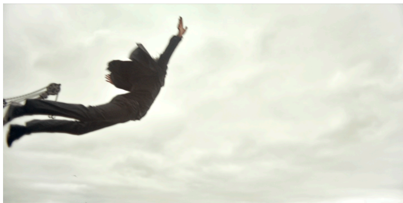
Figure 13. Drunk