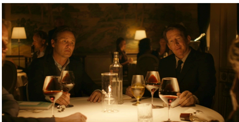
Figure 8. Drunk

Le repas s'impose comme le moment où les failles se révèlent. On peut ici le comparer au banquet de Noël partagé par la famille Ekdahl dans Fanny et Alexandre . Lors de ce dîner, « les failles et les ruptures s'annoncent déjà, sous l'apparence de gaieté. Le déroulement de ce premier repas du film met surtout l'accent sur la faiblesse des hommes » 86 . Plusieurs indices nous sont donnés à voir : « l'ivrognerie de Carl, [le] sentimentalisme de Lydia, sa femme » ; « [la] tristesse d'une bonne, [l']infidélité de Gustave-Adolphe, [la] maladie d'Oskar ». De la même manière, le repas partagé par Martin et ses amis au début de Drunk est annonciateur des failles de chacun. L'alcoolisme latent de Tommy nous est laissé à deviner dans la disposition des bouteilles et des verres qui l'entourent (figure 8). Au cours du repas, il sera le seul autour de la table à avoir toujours un verre supplémentaire (plein) devant lui, cumulé au vin, vodka et autres boissons qui s'enchaînent. Mais la faille la plus visible est évidemment celle de Martin, qui verbalise ici son mal-être que nous percevons déjà depuis plusieurs minutes de film.