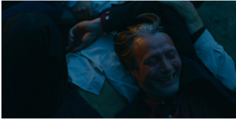
Figure 4. Drunk