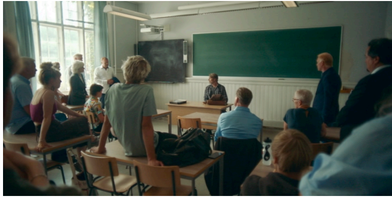
Figure 7. Drunk