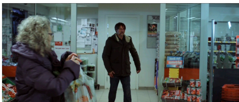
Figure 10. La Chasse

Cette séquence reproduit la dynamique d'opposition que l'on trouve dans la chasse, entre l'animal et l'homme, et où la situation peut se retourner, laissant le chasseur devenir lui même une proie. Elle réunit en son sein ce qui caractérise les raisons de la violence, à savoir « deux facteurs déterminants : l'appétit de puissance et le désir d'améliorer sa condition humaine » 100 . L'appétit de puissance se retrouve ici chez les employés du magasin, qui portent la responsabilité de l'exclusion de Lucas sur la base d'un conflit qui ne les concerne pas mais dans lequel toute la communauté s'implique. Le désir d'améliorer sa condition se retrouve quant à lui chez Lucas, pour qui la situation se débloquera uniquement en passant par la violence physique, car recourir à la violence signifie alors se faire entendre et commencer à retrouver une place.