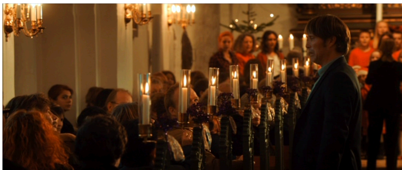
Figure 18. La Chasse