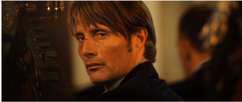
Figure 15. La Chasse