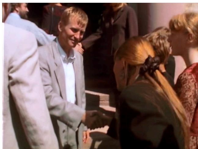
Figure 2. Festen