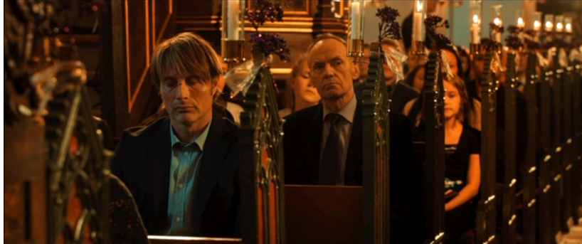
Figure 17. La Chasse