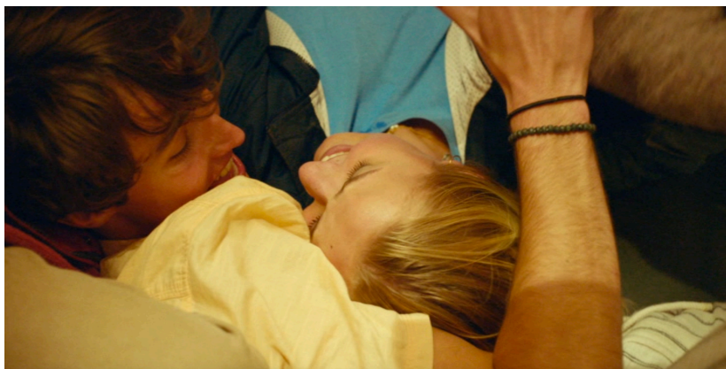
Figure 3. Drunk