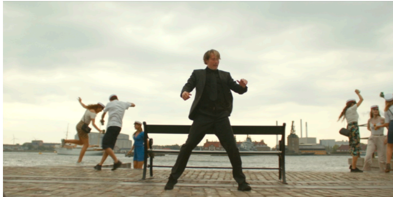
Figure 12. Drunk

(figure 12), ou en contre plongée, qui le montrent dans tous les cas au centre, au premier plan. Cette danse enivrée et enivrante dont « chaque pirouette et entrechat expriment la liberté, l'amour et la vie » 104 , mais aussi l'envolée finale qui l'accompagne (figure 13), symbolisent ce lâcher prise recherché tout au long du film. A travers les épreuves traversées, Martin s'est finalement libéré de la différence et du décalage qu'il ressentait.