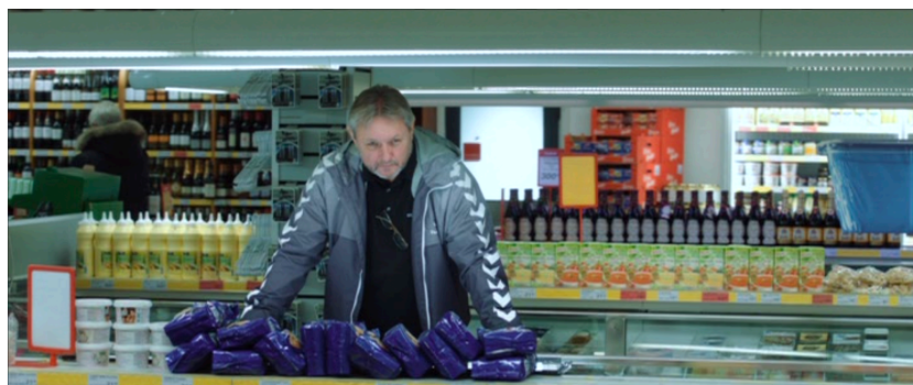
Figure 9. La Chasse

égales. Il suffira d'un seul et unique coup rendu pour mettre à terre le boucher et pour que les employés acceptent qu'il fasse ses achats.