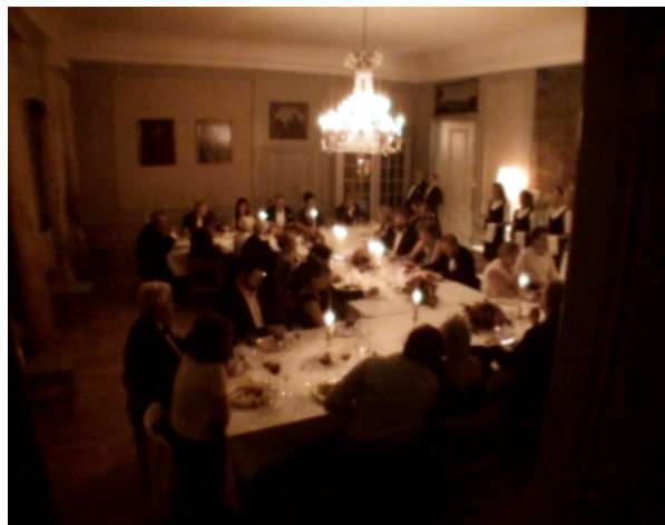
Figure 14. Festen

Dans Festen , c'est à partir du moment où Hélène lit publiquement la lettre de sa soeur que l'opinion des convives bascule. En choisissant de lire la lettre (bien qu'elle y soit poussée par son frère), elle affirme publiquement qu'elle croit en tout ce qu'à dit Christian et confirme alors la véracité de ses propos. Après qu'elle ait terminé sa lecture, Helge demande aux serveurs présents de servir un porto à Hélène, pour pouvoir trinquer avec sa fille. Mais aucun des serveurs ne réagira, malgré son énervement. La situation a basculée et l'unité s'en est retrouvé changée. Dans un plan d'ensemble, nous voyons maintenant les invités et l'équipe de serveurs dans le même cadre, signe qu'ils s'unissent ici dans une opposition au patriarce qui instaure alors l'association de groupes jusqu'ici opposés (figure 14). Les invités regardent Helge, ou regardent dans le vide et sont ailleurs mentalement. Dans tous les cas, ils ne répondent plus à ses ordres, ce qui forcera le père et la mère à quitter la salle. Le rituel reprend lorsque Helmuth, toujours maitre de cérémonie, propose aux invités de passer dans la pièce d'à côté pour partager une danse, vraisemblablement sans le couple parental. De cette manière, Helmuth prend lui même son envol et se détache de la figure d'Helge dont il était jusqu'ici un miroir. C'est donc Hélène qui permet, à travers son investissement, la remise en question de l'autorité.