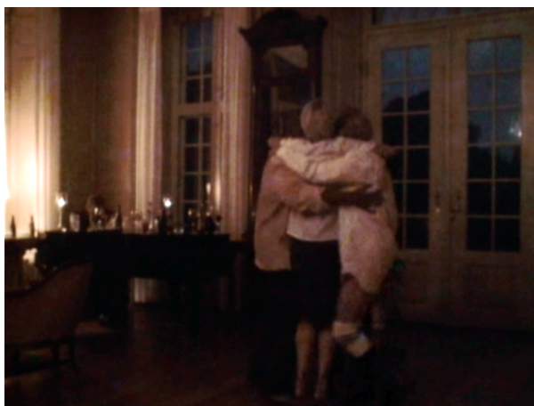
Figure 11. Festen

Pour autant, une séparation nette entre les groupes ne doit pas être établie. Ce second groupe, privilégiant l'identité interne, peut justement être trouvé à l'intérieur même du premier groupe. Ainsi dans Festen , à la suite de cette soirée bouleversée et alors que tout le monde est parti se coucher, Christian, Hélène, Pia et Gbatokai se retrouvent autour du piano. Ils chantent, dansent, et tombent dans les bras les uns des autres (figure 11). Si Hélène n'a jamais vraiment été une figure d'opposition pour Christian lors de ses discours dénonciateurs, elle n'a pas non plus été d'un véritable soutien et s'est plutôt terrée dans un semi silence. Ici, la musique se présente comme l'élément marquant la distinction du groupe dans le groupe. Le plan est large et montre les personnages en tant qu'individus distincts mais aussi entremêlés les uns avec les autres, formant un groupe intime éclairé à la lueur des bougies disposées au quatre coins de la pièce.