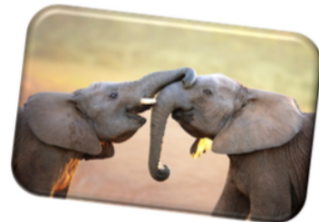
L'éléphant barrit !