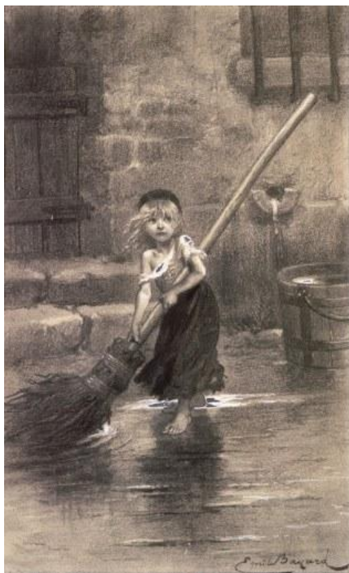
Émile Bayard, Cosette balayant devant la maison des Thénardier (1879-1880)