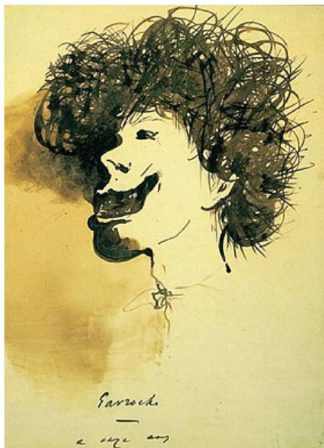
Gavroche à onze ans, dessin de Victor Hugo (encre et lavis, 1850)