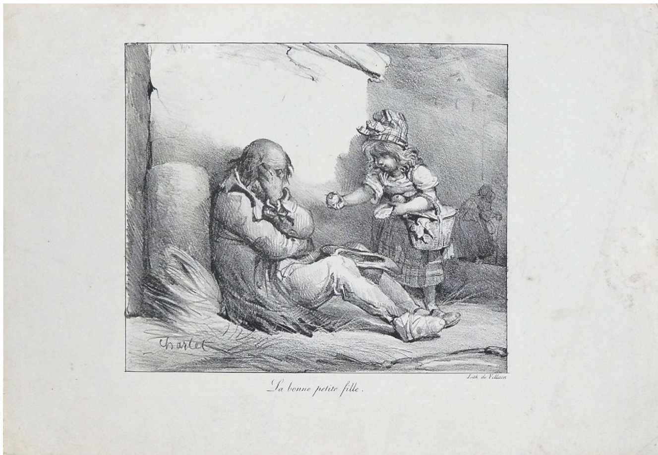
La bonne petite fille , lithographie de Nicolas-Toussaint Charlet (1792-1845)

En vous appuyant sur tous ces extraits (textes et document iconographique) et sur ceux étudiés en classe, vous répondrez à la question suivante :