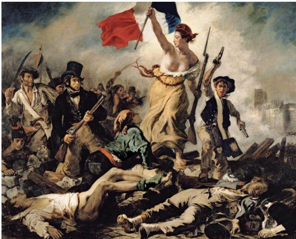
La Liberté guidant le peuple , Delacroix (peinture à l'huile, 1830)