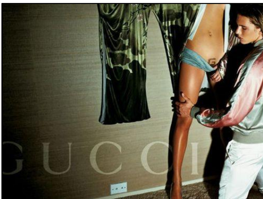
Figure 1. Publicité Gucci, 2003, Tom Ford

Les schémas sexistes dénoncés dans les productions pornographiques se retrouvent dans un ensemble de productions culturelles. Les auteurs de Parlez du porno à vos enfants avant qu'Internet ne le fasse , Anne de Labouret et Christophe Butstraen, écrivent que les codes du porno sont partout, déclinés par les publicitaires, les médias, de manière les plus explicites. L'hypersexualisation s'exprime dans l'ensemble des productions médiatiques. Selon Pierrette Bouchard, Natasha Bouchard et Isabelle Boily, autrices de La sexualisation précoce des jeunes filles , l'hypersexualisation est un « phénomène qui consiste à donner un caractère sexuel, à un comportement, ou à un produit qui n'en a pas en soi. » Il s'exprime par des tenues vestimentaires, des accessoires et des produits (maquillage, soutien-gorge, épilation), des postures exagérées suggérant une disponibilité sexuelle, des expressions de soumission. Au début des années 2000, l'imagerie du « pono-chic » a été déclinée dans les publicités pour des marques de luxe comme Gucci en 2003 (figure 1) et Dolce & Gabbana en 2007 (figure 2).