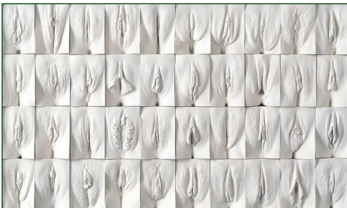
Figure 5 – « Vulva panel », moulages réalisés par l'artiste Jamie McCartney.

respectueuses de la réalité scientifique en fonction des œuvres. La figure 5 en présente un exemple. Afin de réaliser des ponts entre les notions scientifiques et les enjeux sociétaux, la professeure de SVT projette également une photo de Simone Veil et du manifeste de 343 lorsqu'elle aborde l'avortement. Des vidéos lui permettent d'aborder le consentement, d'ouvrir le débat.