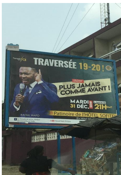
Image 3. Photographie d'une affiche pour une soirée à l'occasion d'un nouvel an à Kinsaha, mai 2022