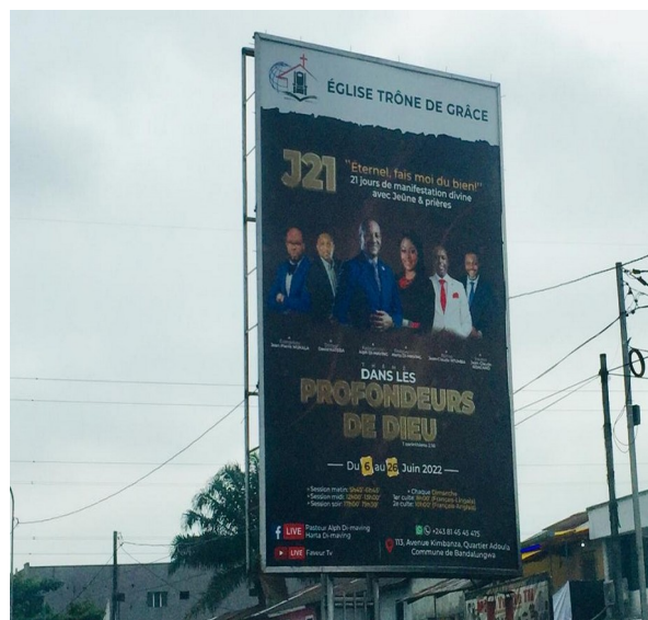
Image 2. Photographie d'une affiche d'une église à Kinshasa, mai 2022