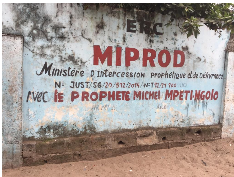
Image 1. Mur d'une église kinoise, photo personnelle, mai 2022.

parvenir des offrandes. En contrepartie, le pasteur doit assumer toute l'autorité qui correspond à son rôle de chef de village et être à la hauteur des attentes de ces fidèles. En RDC, les cultes hebdomadaires de « miracles », « de guérison » ou de « délivrance 207 » sont fréquents et apparaissent dans le programme des églises exposés dans les rues de la capitale, comme en témoigne la photo ci-dessous.