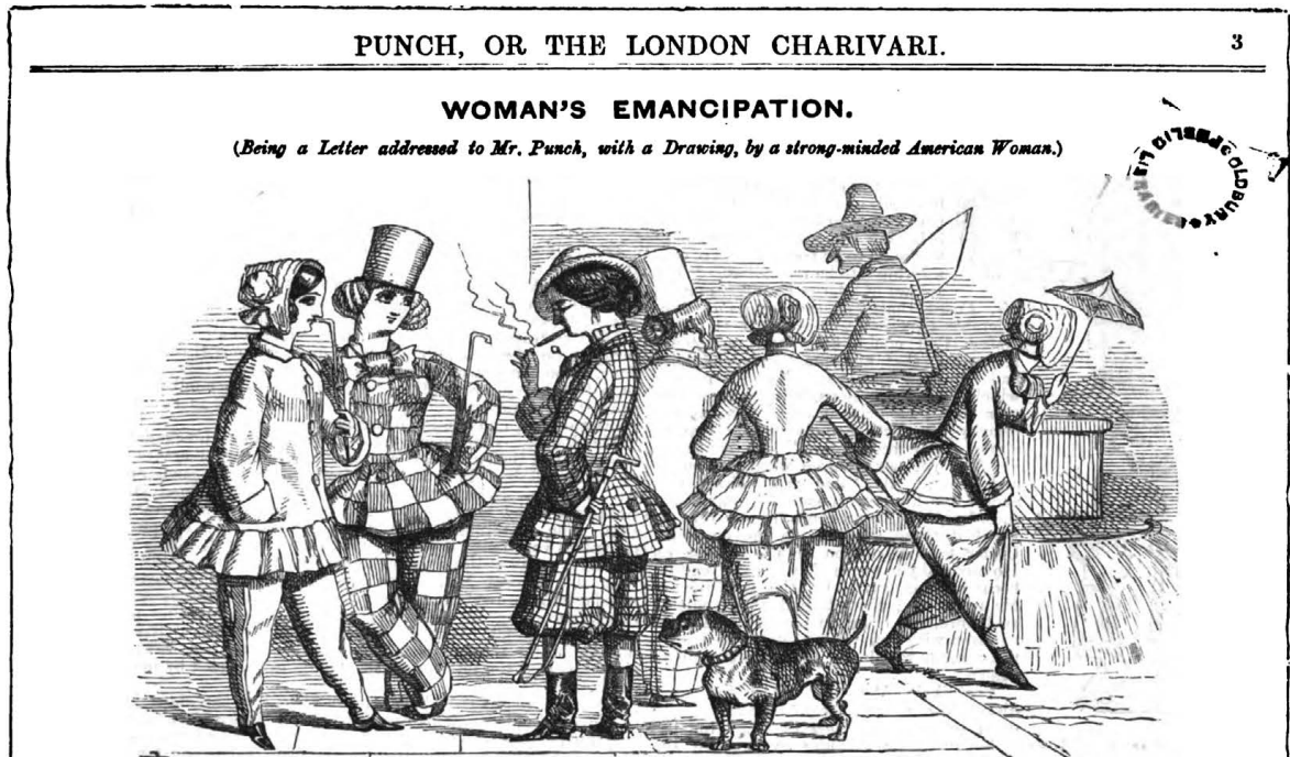
Illustration 2 : "Woman's Emancipation (Being a Letter addressed to Mr. Punch, with a Drawing, by a Strong-Minded American Woman)", Punch Magazine, 1851.

We are emancipating ourselves, among other badges of the slavery of feudalism, from the inconvenient dress of the European female. With man's functions, we have asserted our right to his garb, and especially to that part of it which invests the lower extremities 251 .