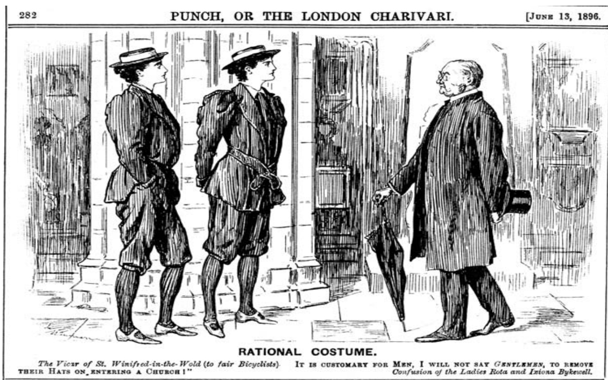
Illustration 8 : "Rational Costume", Punch Magazine, 13 juin 1896.

La dernière illustration que nous allons analyser est intitulée « Rational Costume » (illustration 8) et a été publiée dans le numéro du 13 juin 1896. La caricature représente deux femmes en pantalon, elles sont belles, grandes et élancées. Elles ont l'air confiantes et sûres d'elles, elles se tiennent droites, les mains dans les poches. Elles sont prises pour des hommes par le vicaire. La tenue des deux femmes s'éloigne énormément de la jupe culotte qui était d'abord proposée par la Rational Dress Society, mais se rapproche grandement de ce que certaines femmes portaient pour faire du vélo. D'ailleurs, le lien avec le vélo est sous-entendu grâce aux prénoms des deux jeunes femmes : Rota et Iziona Bykewell, qui peut se lire comme « Rode a bike well », c'est-à-dire « bien faire du vélo » et « Easy on a bike, well », qui peut se traduire par « A l'aise sur un vélo, en effet ». Cette dernière illustration apparaît comme un tournant, de la femme nouvelle à l'homme nouveau.