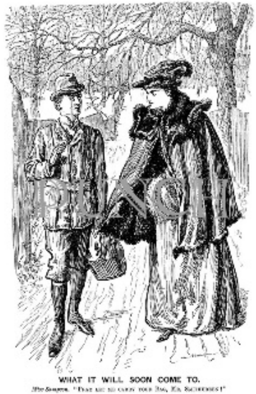
Illustration 7 : "What It Will Soon Come To", Punch Magazine , 1894.

étaient plus sévères, leurs tenues n'étaient pas flatteuses et presque même ridicules. « The Man and the Maid » (illustration 6), publiée le même mois, montre déjà les caractéristiques de la femme nouvelle que nous retrouverons par la suite chez Punch . Dans cette illustration, la tenue de la femme nouvelle est plus extravagante, et elle possède toutes les caractéristiques déjà mentionnées : elle est belle, indépendante et athlétique, elle fume et fait du vélo. L'illustration est accompagnée d'un texte 273 , il s'agit en fait d'une conversation dans laquelle la femme demande à l'homme si elle peut l'accompagner pour un tour en vélo. Il en résulte alors un échange entre les deux où la femme nouvelle demande à l'homme ce qu'il recherche chez une