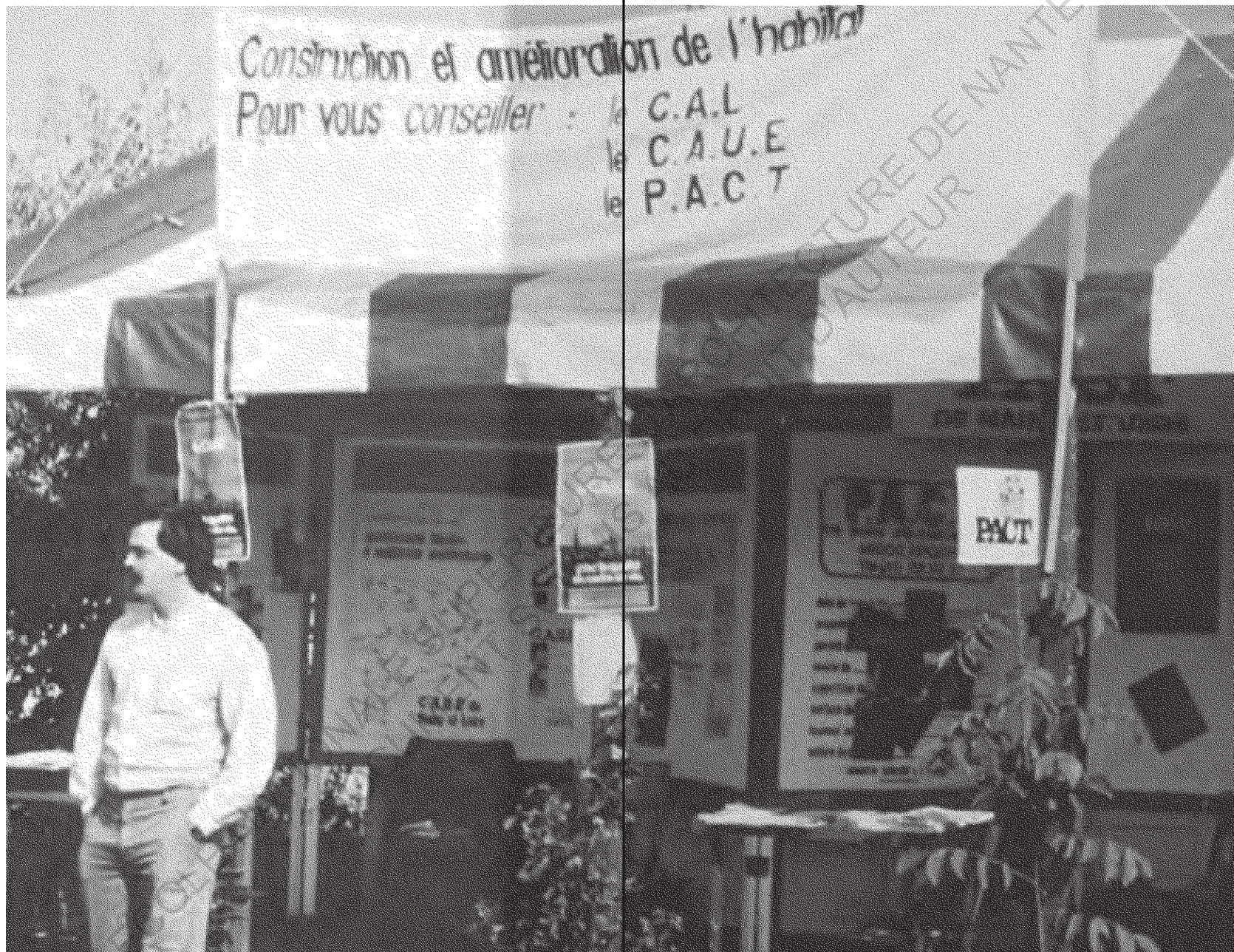
Illustration du guichet unique de la Maison de l'Habitat, en 1983, dans le numéro hors-série d'Imago « 1979-2019, 40 ans d'activités », juin 2019