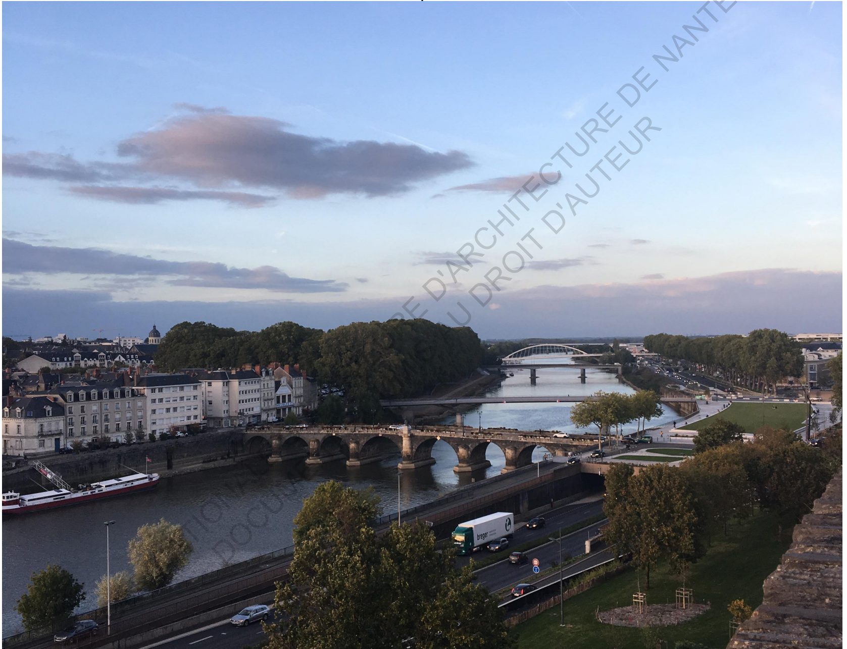
Angers, vue depuis la Promenade du Bout du Monde, novembre 2020