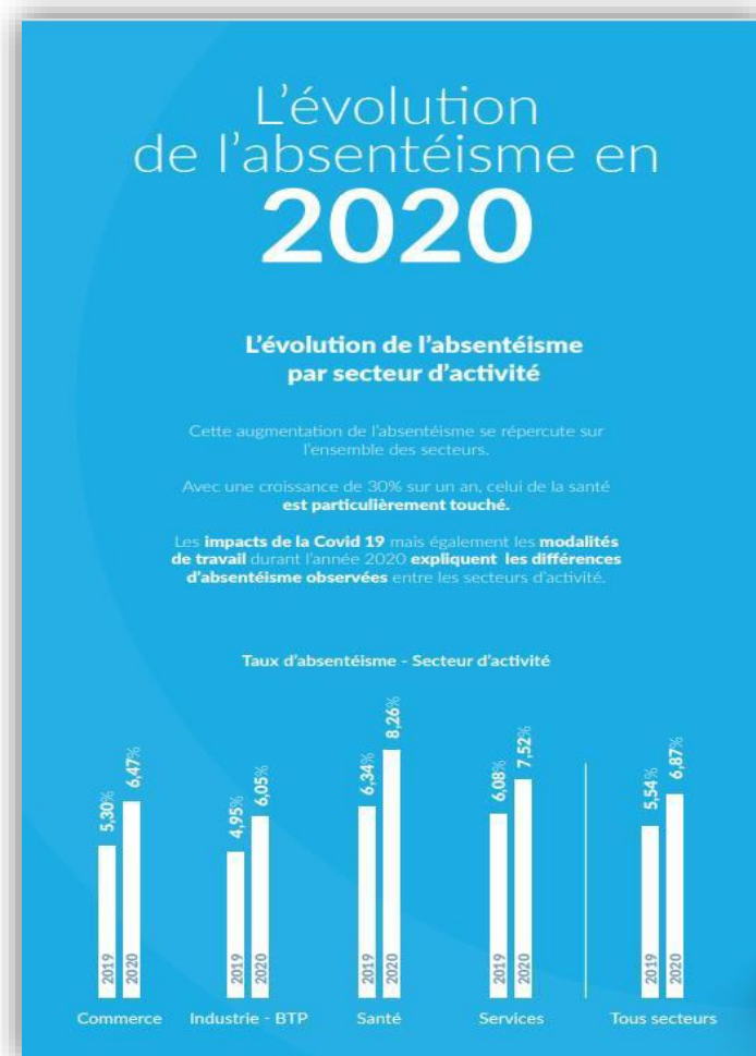
Figure 1 : baromètre de l'absentéisme au travail et de l'engagement (Ayming,2020)

L'ANACT, Agence Nationale pour l'Amélioration des conditions de Travail, considère que « L'absentéisme caractérise toute absence qui aurait pu être évitée par une prévention suffisamment précoce des facteurs de dégradations des conditions de travail entendus au sens large : les ambiances physiques mais aussi l'organisation du travail, la qualité de la relation d'emploi, la conciliation des temps professionnel et privé, etc. ». Cette définition identifie la seule responsabilité de l'entreprise tant dans l'organisation logistique qu'humaine comme facteur d'absentéisme. L'absentéisme apparaît donc comme un indicateur des conditions d'exercice, révélant des manques, des dysfonctionnements, des problèmes organisationnels. Il est aussi le marqueur du climat social, en réponse aux qualités relationnelles d'une structure avec ses collaborateurs, d'un style de management.