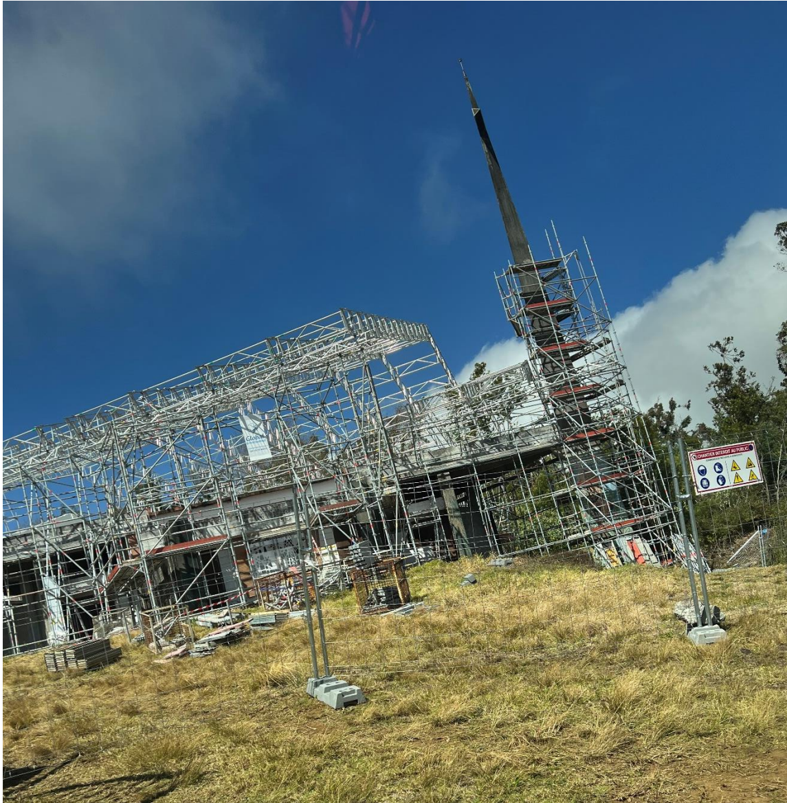
Photographie de l'ex-Chapelle de l'APECA en rénovation, 23 e km de la Plaine des Cafres, Caroline SARANE, 12 août 2022.