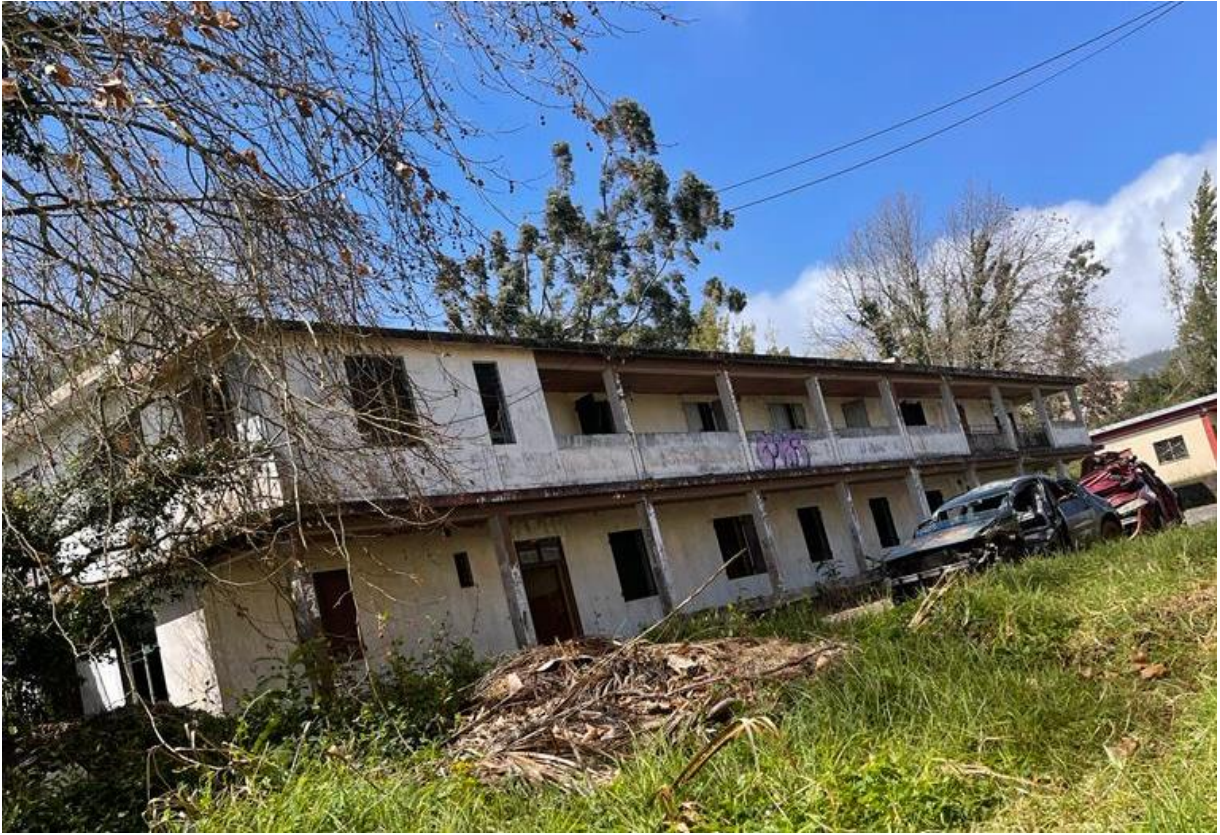
Photographie de l'avant du bâtiment de l'APECA pour filles, 23 e km de la Plaine des Cafres, Caroline SARANE, 12 août 2022.