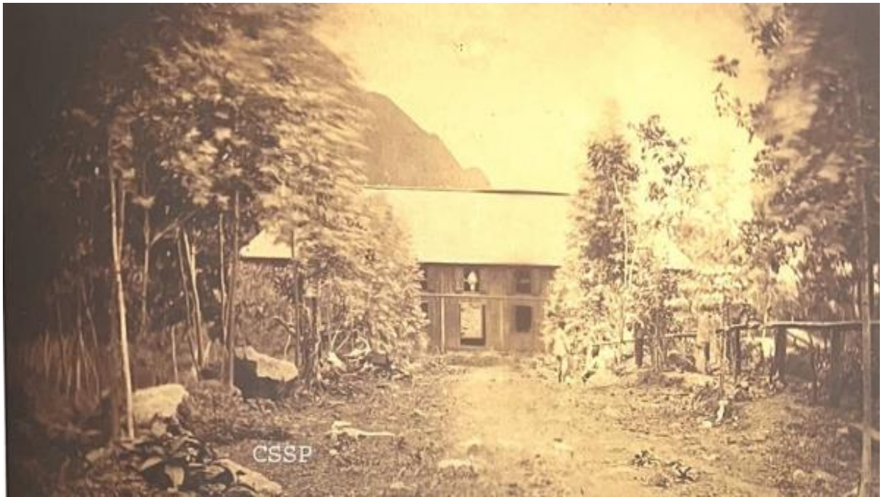
photographie du bâtiment de l'Ilet à Guillaume, 1868.