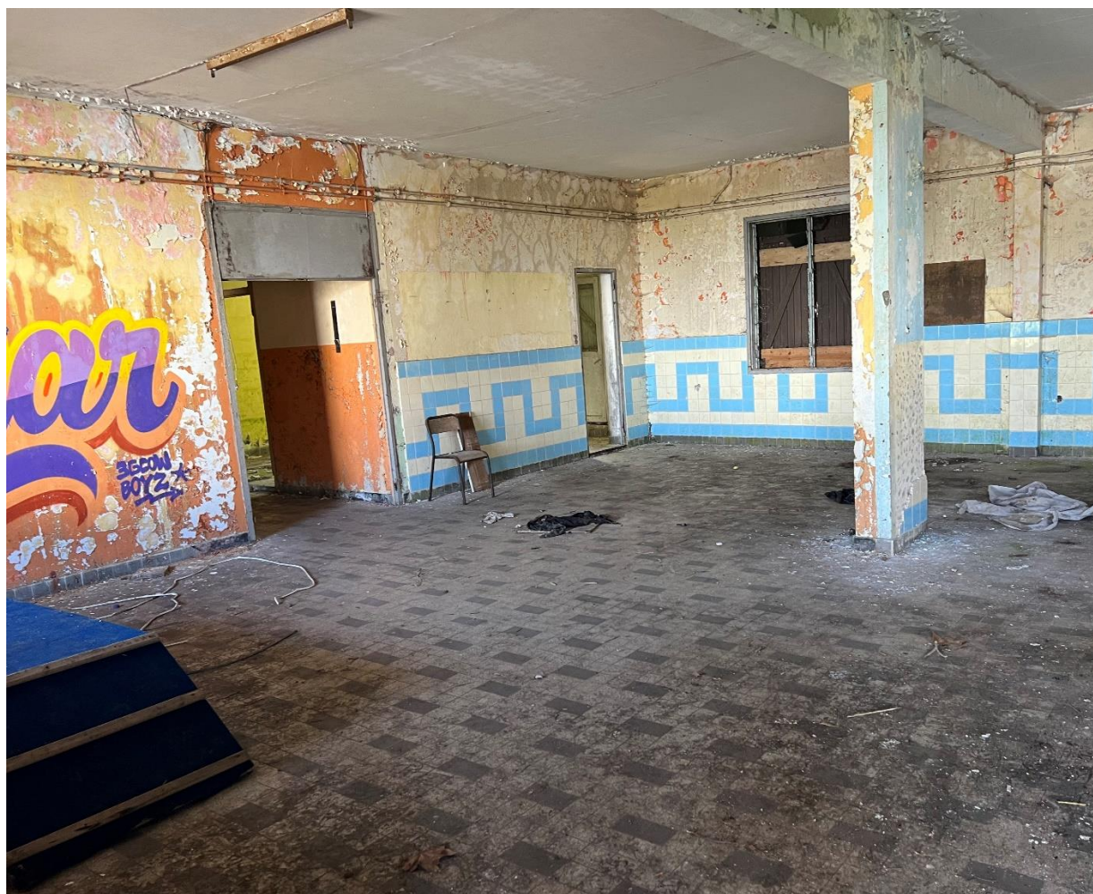
Photographie du réfectoire de l'APECA pour filles, 23 e km de la Plaine des Cafres, Caroline SARANE, 12 août 2022.