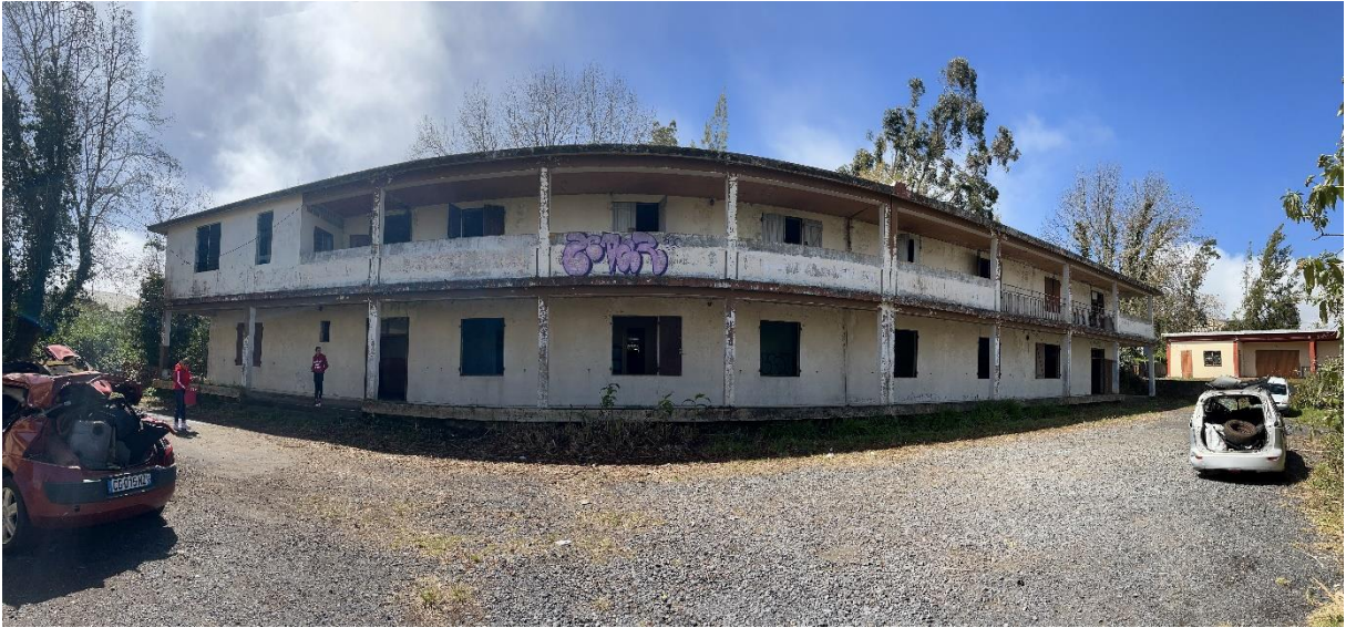
Photographie panoramique de l'avant du bâtiment de l'APECA pour filles, 23 e km de la Plaine des Cafres, Caroline SARANE, 12 août 2022.