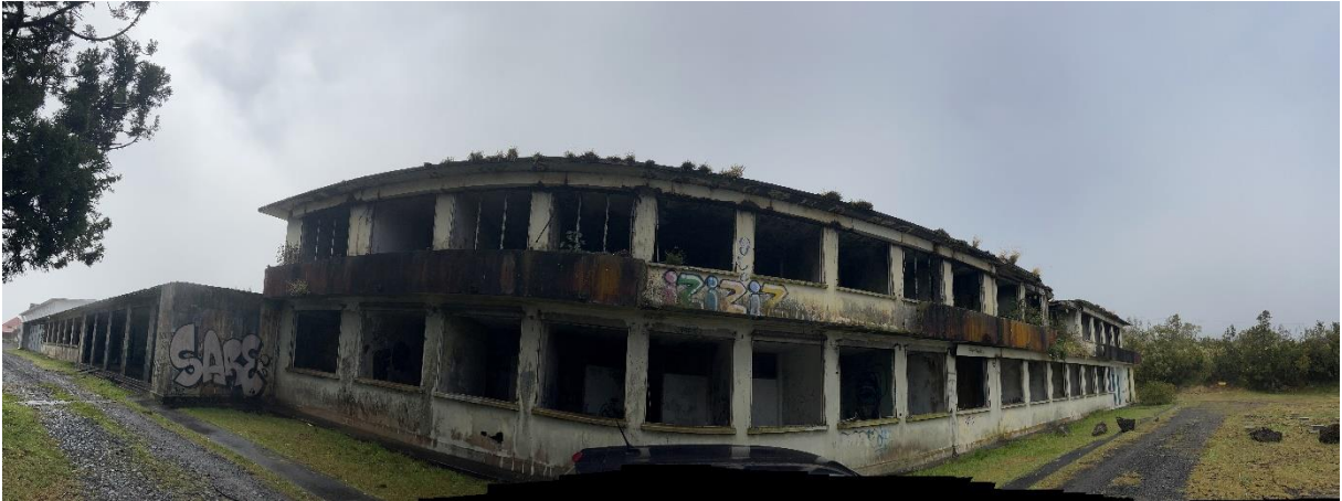
Photographie panoramique des locaux abandonnés de l'APECA pour garçons, 27e km de la Plaine des Cafres, Caroline SARANE, 12 août 2022.