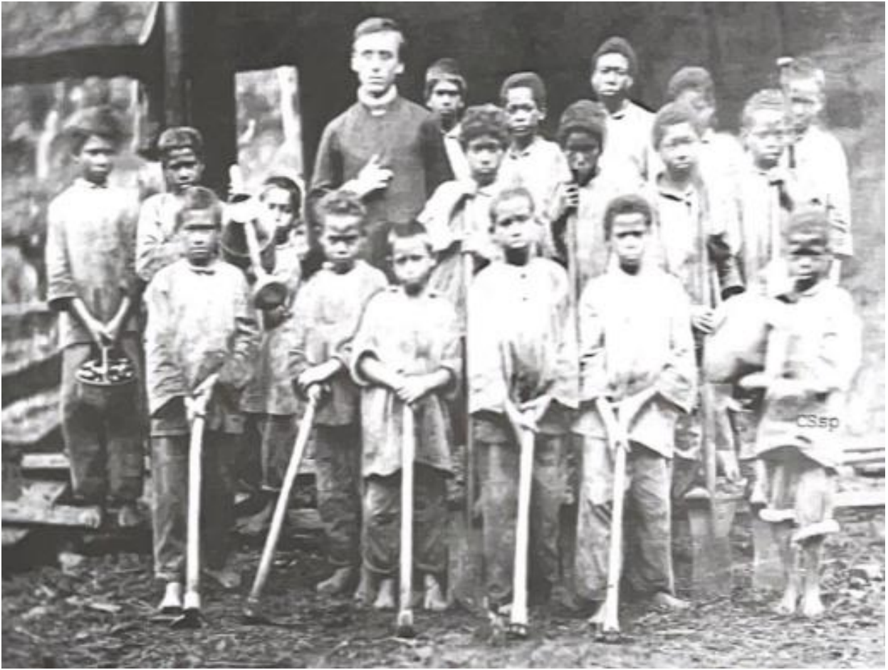
photographie du bâtiment de l'Ilet à Guillaume, 1868.