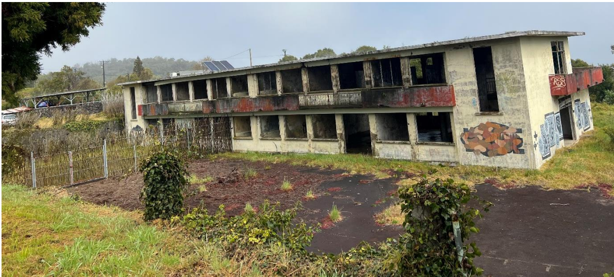
Photographie n° 1 des locaux abandonnés de l'APECA pour garçons, 27e km de la Plaine des Cafres, Caroline SARANE, 12 août 2022.