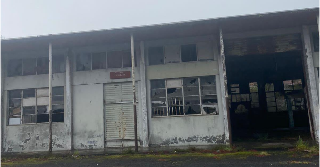
Photographie n° 1 de la recyclerie qui occupe une partie des anciens locaux de l'APECA, 27e km de la Plaine des Cafres, Caroline SARANE, 12 août 2022.