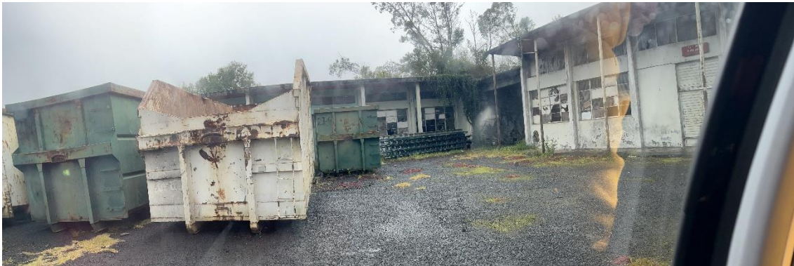
Photographie n° 2 de la recyclerie qui occupe une partie des anciens locaux de l'APECA, 27e km de la Plaine des Cafres, Caroline SARANE, 12 août 2022.