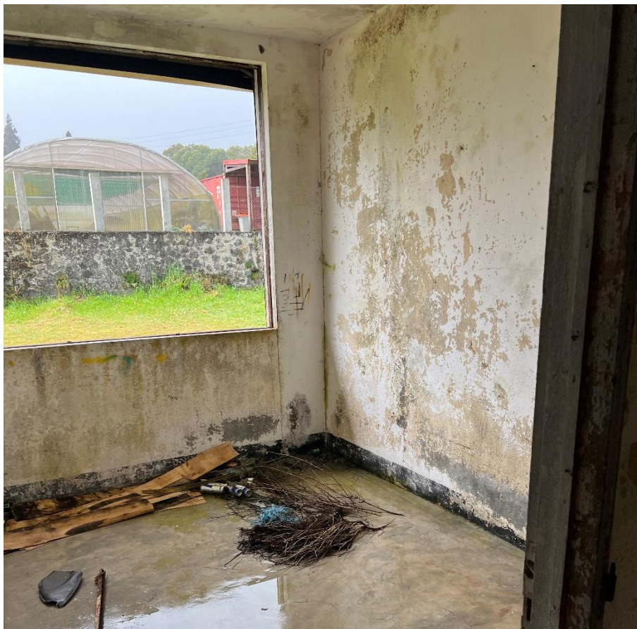
Photographie d'une des chambres abandonnées de l'APECA pour garçons, 27e km de la Plaine des Cafres, Caroline SARANE, 12 août 2022.