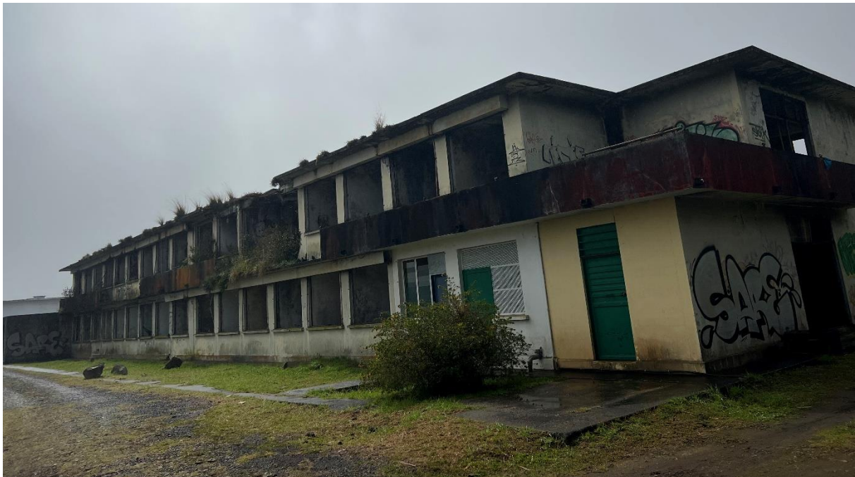
Photographie n° 2 des locaux abandonnés de l'APECA pour garçons, 27e km de la Plaine des Cafres, Caroline SARANE, 12 août 2022.