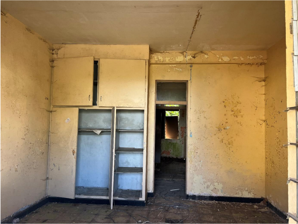
Photographie de l'une des chambres abandonnées de l'APECA pour filles, 23 e km de la Plaine des Cafres, Caroline SARANE, 12 août 2022.