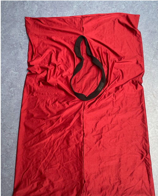
Poche en tissu