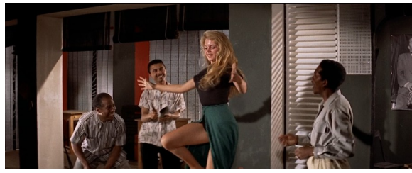
Et Dieu... créa la femme , 01:27:03/01:26:50