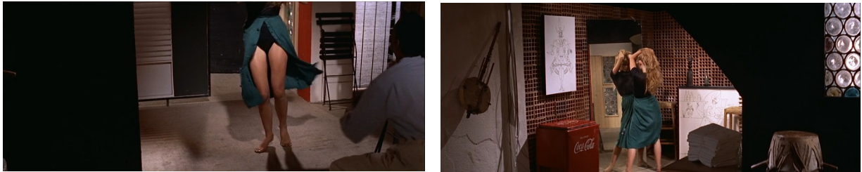
Et Dieu... créa la femme, 01:25:15/01:25:30

des deux. Aussi, les jambes de Juliette qui ondulent constituent un spectacle à part entière pour Carradine et, par la mise en évidence par le gros plan et par processus d'identification, au spectateur masculin.