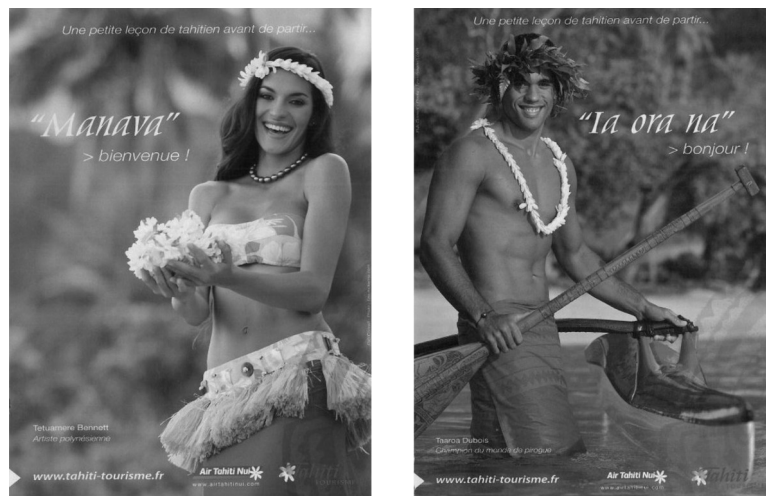
Campagne publicitaire Tahiti Tourisme extraite de l'article de Jean-François Staszak

union avec l'érotisme, le géographe Jean-François Staszak 110 parle d'« érotisation de l'exotisme » et d'« exotisation de l'érotisme ». Pour illustrer cette profonde symbiose, il s'appuie sur deux campagnes publicitaires de l'agence Tahiti Tourisme : au premier plan, ce sont les corps qui sont mis en valeur, le paysage n'est présent que dans le flou de l'arrière-plan. Pour évoquer le lieu, on use de ses clichés : le paréo, les fleurs de Tiaré et les perles du collier. La femme et l'homme sont à demi nus, souriants, elle tient des fleurs au niveau de ses seins, lui tient à la main sa pagaie dont l'emplacement, la taille et l'inclinaison constitue une image évidente ; les corps érotisent l'île.