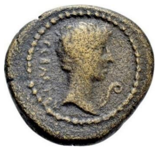
Figure 9. RPC I , 2337.

Au droit : tête d'Auguste tournée vers la droite précédée d'un lituus . Au revers : têtes de Caius et Lucius tournées vers la droite.