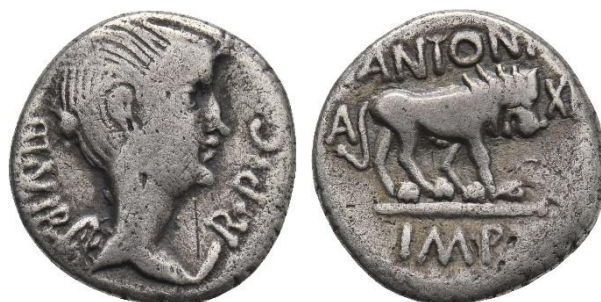
Figure 2b. RRC 489/6.

Au droit : buste d'une Victoire ailée. Au revers : lion marchant à droite.