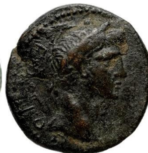
Figure 13. RPC I , 2736.

Au droit : tête laurée d'Auguste tournée vers la droite. Au revers : bâton enroulé d'un serpent (caducée ?)