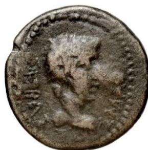
Figure 10. RPC I , 2338.

Au droit : tête d'Auguste tournée à droite. Au revers : tête de Livie tournée à droite.