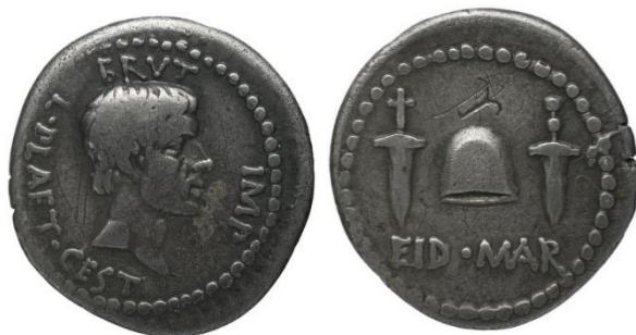
Figure 5. RRC 508/3.

l'émission que nous avons mentionnée ci-dessus 67 , mais également dans onze autres émissions réunies par Raphaëlle LAIGNOUX 68 . Un type monétaire particulièrement célèbre et rapproché de ce thème est celui de la monnaie aux deux poignards et au pileus surmontant la légende EID·MAR, autrefois décrit par Dion Cassius 69 et dont nous avons retrouvé quelques exemplaires (fig. 5). En se présentant de la sorte, les Libérateurs s'inscrivent dans le sillage du grand Flamininus, dont les actions avaient déjà trouvé un écho particulier dans les cités insulaires, notamment à Cos où une base de statue en son honneur a été retrouvée 70 . On l'aura compris : les références au thème de la liberté sont pléthoriques dans la propagande de Brutus et de Cassius. Mais là encore doit se poser la question du destinataire de cette iconographie monétaire, et de la réception auprès des populations grecques de cette sémantique.