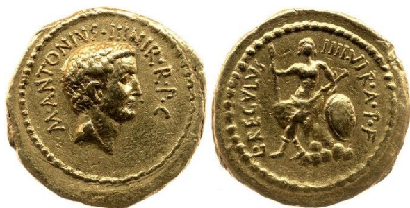
Figure 1. RRC 494 2a.

Rhodes à laquelle il concède quelques îles en dédommagement des dégâts et des prises de Cassius dans la cité 36 . Générosité, évergésie et philhellénisme mis de côté, c'est également très tôt après la victoire de Philippes qu'Antoine revendique des liens avec le héros Hercule-Héraclès et le dieu Dionysos.