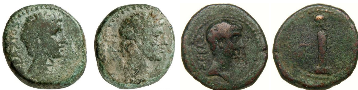
Figure 6. RPC I , 1734.

Au droit : tête d'Auguste tournée vers la droite. Au revers : tête laurée d'Apollon, lyre (?).