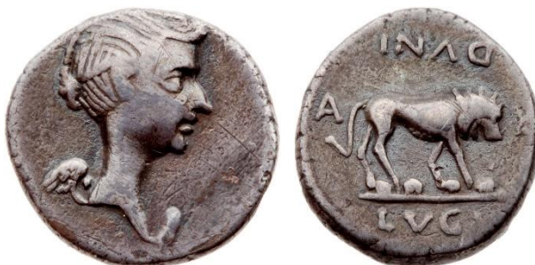
Figure 2a. RRC 489/5.

Au droit : buste de Marc Antoine tourné vers la droite. Au revers : Hercule assis de face sur un roche, lance dans la main droite et épée dans la main gauche, la léontè est drapée sur ses genoux. À sa droite, un bouclier orné du gorgonéion .