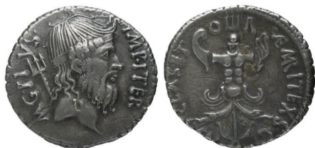
Figure 4 : RRC 511/2.

Au revers : crabe tourné vers la droite, tenant un aplustre dans ses pinces. À gauche une rose et un diadème dénoué.