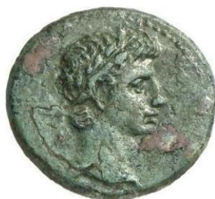
Figure 12. RPC I , 2732.

Au droit : tête laurée d'Auguste tournée vers la droite. Au revers : tête laurée d'Asclépios.