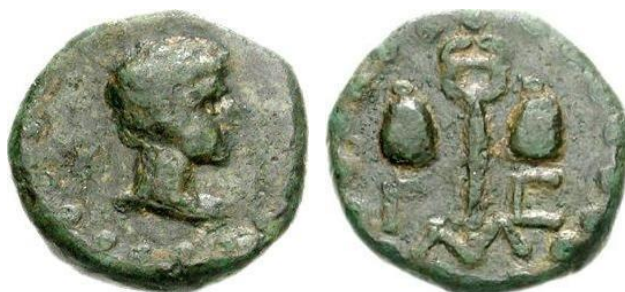
Figure 8. RPC I , 1737.

Au droit : tête laurée d'Auguste tournée à droite. Au revers : pilier hermaïque ithyphallique.