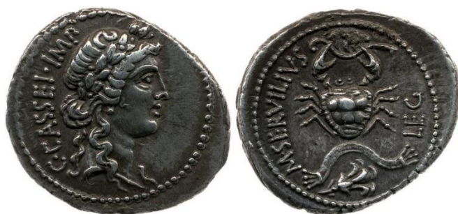
Figure 3. RRC 505/3.

une sorte de jeu de mots jouant sur la ressemblance entre les noms en grec de la cité de Rhodes et celui de la fleur, et qui viserait donc à symboliser la cité 61 . La composition d'ensemble est donc plutôt claire : elle vise à légitimer d'abord le vainqueur de Myndos et d'Ariobarzane III, c'est-à-dire Cassius. Ce qui est également frappant, c'est que l'ensemble de la composition fonctionne particulièrement bien avec le contenu des lettres grecques de Brutus dont une partie a été envoyée à Cos et qui utilisait la même victoire romaine contre Rhodes pour contraindre les habitants de l'île de leur prêter main-forte 62 . Le destinataire de cette iconographie monétaire n'est pas nécessairement clair, mais il est probable que les soldats de l'armée républicaine soient en bonne position pour l'être. Même si ce monnayage semble ne pas avoir servi comme outil de propagande ayant les cités grecques pour destinataires, c'est l'ensemble de la communication des Libérateurs, utilisant Rhodes comme argument de légitimité, qui nous intéresse ici : utilisée par Brutus et Cassius pour asseoir leur autorité auprès de leurs troupes ainsi qu'auprès des autres cités, Rhodes et sa défaite le sont également pour se légitimer auprès des Grecs, par différents moyens complémentaires.