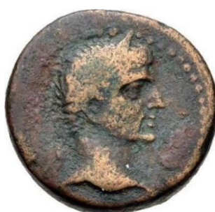
Figure 11. RPC I , 2681.

Au droit : tête laurée d'Auguste (?) tournée vers la droite. Au revers : paon debout tourné à droite sur un caducée et un sceptre.