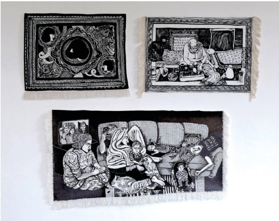
[01] ATUL DODIYA, Family Tree , 2006