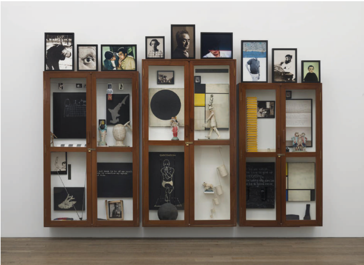
[17] ATUL DODIYA, Meditations (With Open Eyes) , 2011