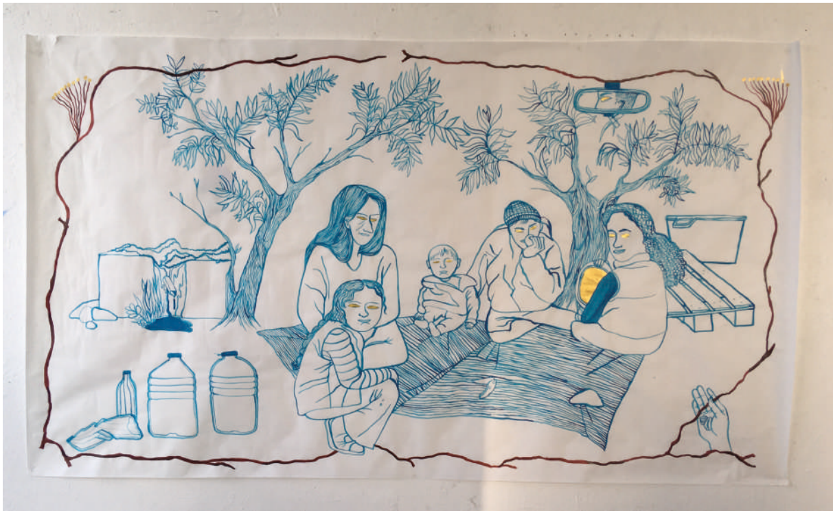
[11] LÉNA JEANNE-MARQUISE, Pique-nique à la fontaine , 2022