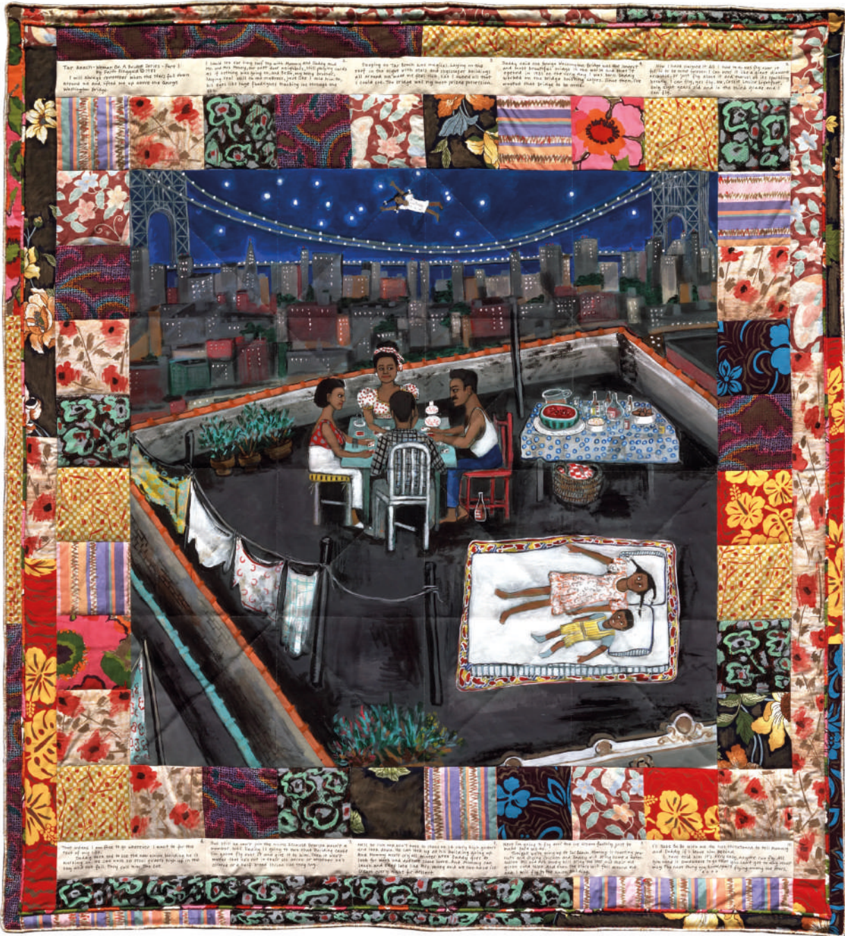
[12] FAITH RINGGOLD, Woman on a Bridge. 1/5 Tar Beach , 1988