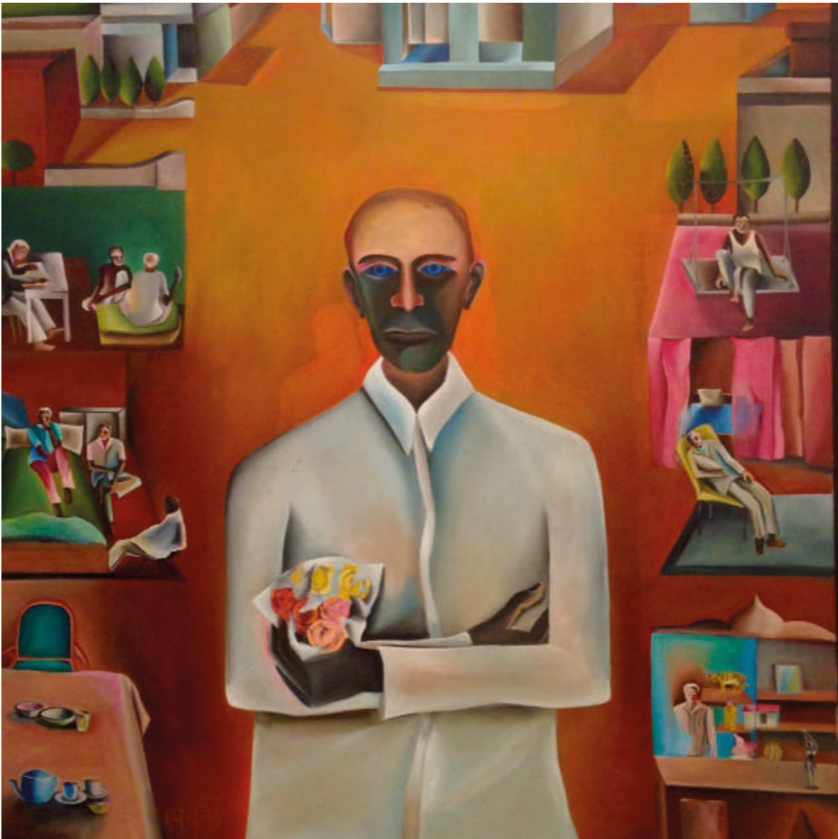
[13] BHUPEN KHAKAR, Man with a bouquet of plastic flowers , 1975