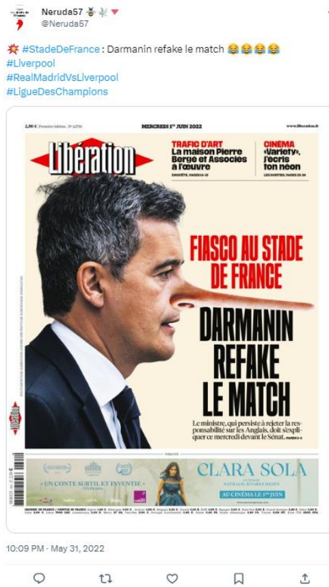
Légende : post dénonçant un mensonge du ministre de l'Intérieur

Cela montre à travers ce post que le gouvernement invente ses responsables. Ainsi, à travers Twitter, de nombreux internautes mettent en lumière la stratégie de diversion du ministre.