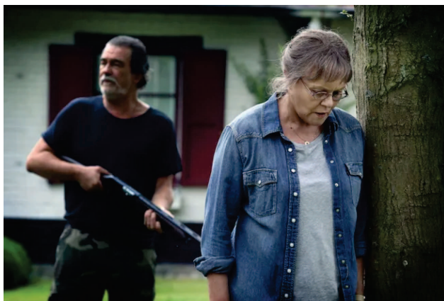
TF1 Titre: JACQUELINE SAUVAGE C'ÉTAIT LUI OU MOI Sous Titre: JACQUELINE SAUVAGE C'ÉTAIT LUI OU MOI Légende: OLIVIER MARCHAL NOAH DOR Photographe: Date De Reportage: 2018.05.24