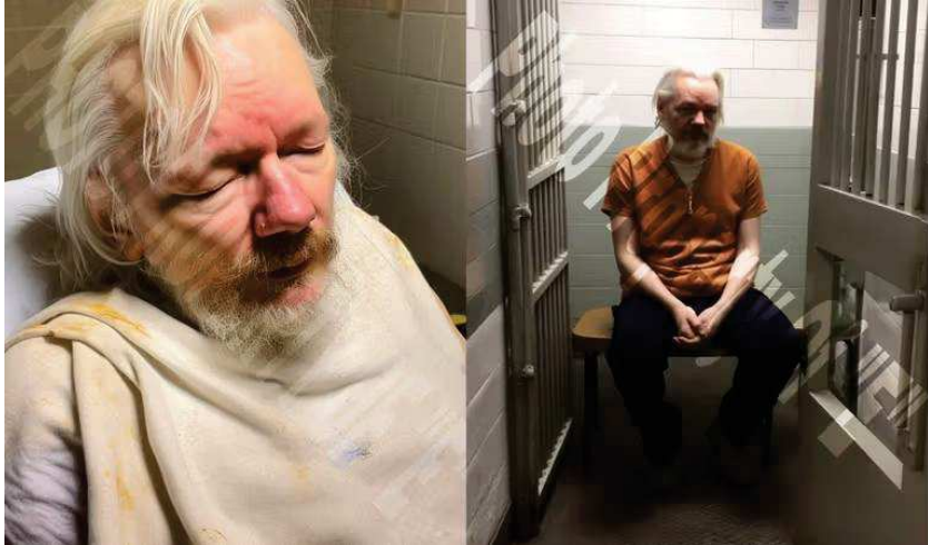
IX - 7 : Image générée par Midjourney de Julian Assange en prison