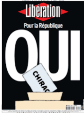
Libération , « Pour la République : OUI Chirac », 2002.

En Une, Libération va jusqu'à donner des consignes de vote en Une, montrant l'importance de ces premières lignes que le regard croise au kiosque sont importantes. Nous pouvons constater ce parti pris en comparant deux Unes, la première datant de 2002 et la seconde de 2022. Deux contextes proches : l'extrême droite arrive au second tour des élections présidentielles. Dans un climat social tendu, Libération sort une Une sur laquelle il est écrit