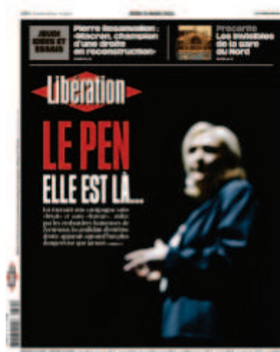
Libération, « Le Pen, elle est là », 31 mars 2022, photo : Denis Allard