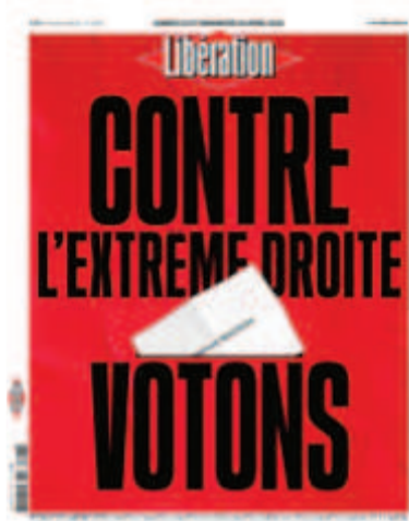
Libération , « Contre l'extrême droite votons », 24 et 25 avril 2022.

«NON», et avec la tête de Jean-Marie Le Pen comme écrasé par les grandes capitales. Pour la der, là aussi le choix politique est ferme : le journal donne une intention de vote : « Pour la République OUI », avec un vote pour Jacques Chirac dessiné comme glissant dans l'urne. En 2022, certains codes sont retenus volontairement. Une nouvelle fois, dans l'édition du samedi 24 et du dimanche 25 avril 2022, le journal donne une consigne de vote : «Contre l'extrême droite VOTONS ». Un bulletin « Emmanuel Macron » glisse à son tour dans une fente rappelant l'urne.