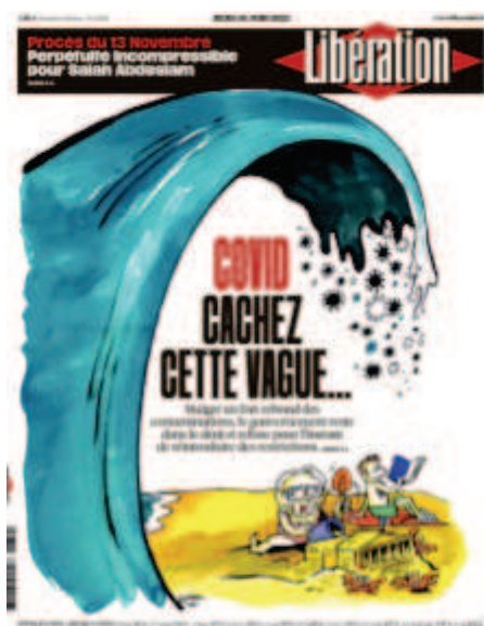
Libération , « Covid cachez cette vague », 30 juin 2022, dessin : Coco