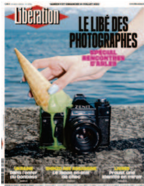
Libération, « Le Libé des photographes », 9 et 10 juillet 2022