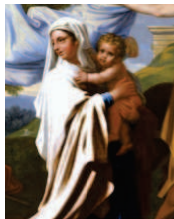
Poussin, Nicolas, La Fuite en Égypte , 1657-1658, huile sur toile, Lyon. (Détail)