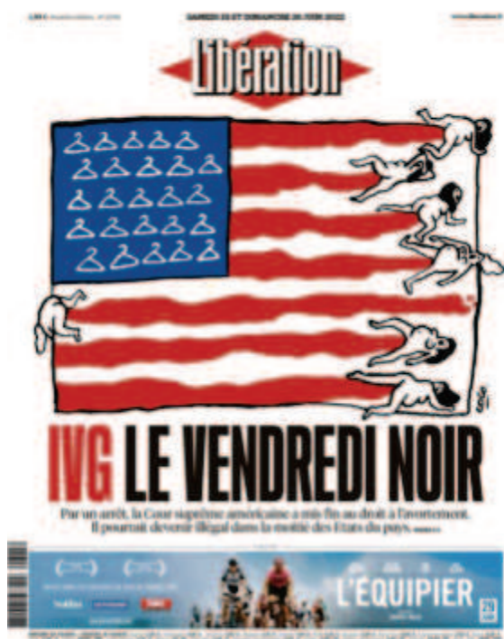
Libération , « IVG, le vendredi noir », samedi 25 et dimanche 26 juin 2022, illustration : Coco

Cette stratégie est visible dans la manière qu'a Libération de communiquer sur les réseaux sociaux: lors d'événements historiques où les unes sont choisies avec une attention très particulière, il n'est pas rare que des formats vidéos soient publiés pour expliquer ces choix. Ce fut notamment le cas au lendemain de la mort de la reine Elisabeth II d'Angleterre,