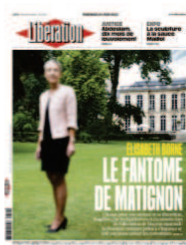
Libération, « Elisabeth Borne : Le fantôme de Matignon », 24 juin 2022

Le numérique devient un moyen de représentation : le montage, le recadrage ou le floutage, loin d'être discret, deviennent des vecteurs de sens utilisés pour l'image imprimée en Une.