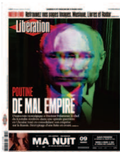
Libération , « Poutine : De mal empire », 5 et 6 mars 2022

d'appréhension de la télévision et de ses messages sont profondément marqués par sa nature électronique qui permet une simultanéité de l'émission de la scène télévisée et de sa réception 41 ». C'est de ce rapport à l'image dont s'inspirent les photographes de Libération qui représentent les figures politiques à travers l'écran. Il s'agit toujours de représenter la réception de l'image politique pour mieux en questionner l'aspect communicationnel.