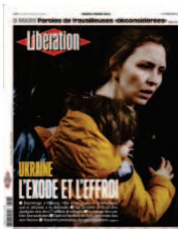
Libération , « L'exode et l'effroi », 8 mars 2022, photo : Gleb Garanich