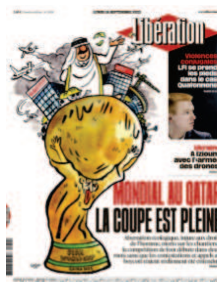
Libération , « La coupe est pleine », 19 septembre 2022, dessin : Coco

En 2021, Coco devient la dessinatrice attitrée du quotidien Libération . Depuis, elle réalise de nombreuses Unes pour le journal. Lorsqu'on la questionne sur le dessin de presse,