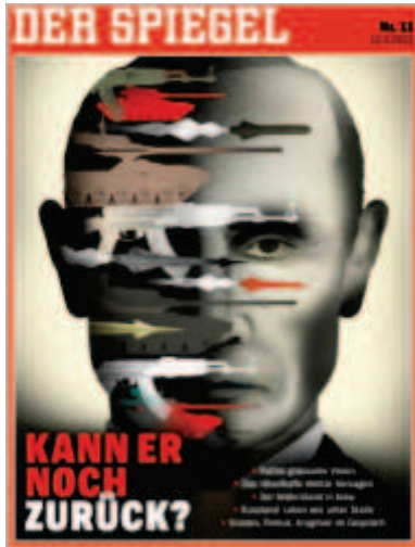
Der Spiegel , « Kann er noch Zurück ? », 12 mars 2022

L'écran de télévision n'est pas une projection mais une diffusion venant de l'objet lui-même. En ce sens, on constate avec étonnement la grande matérialité des photographies qui représentent les images diffusées. Il existe dans l'image une forme de coprésence entre la scène représentée et la scène du quotidien, vécue face à la télévision : « Les modes