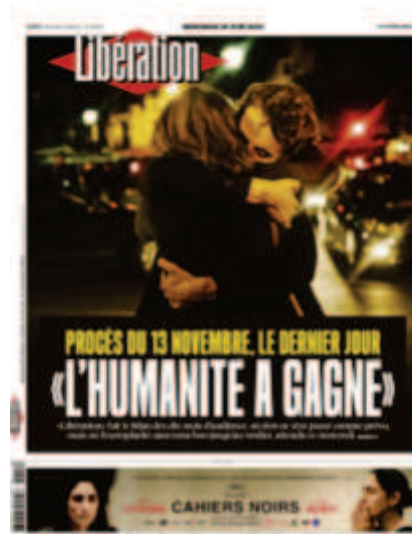
Libération , « L'humanité a gagné », 29 juin 2022, photo : Frédéric Stucin.