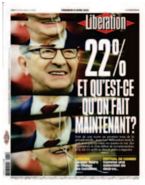
Libération, « 22% et qu'est-ce qu'on fait maintenant ? », 15 avril 2022, photo : Cyril Zannettacci

Le sens n'est pas le même pour la Une du 24 juin 2022 (photo : Noël Saget). Ici, c'est une photo d'agence qui est reprise par Libération est modifiée pour que la figure d'Elisabeth Borne soit floue. Là où Marine Le Pen est représentée sur un fond noir, Elisabeth Borne est