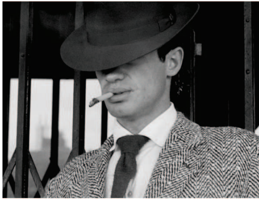
Godard, Jean-Luc, À bout de souffle , 1960 (détail)

Dans les films de Jean-Luc Godard, pour ne prendre que cet exemple, les hommes sont toujours représentés de la sorte. Un effet de mode qui permet d’ancrer Libération dans son contexte culturel.