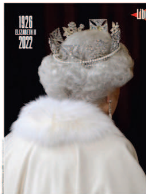
Libération , « La peine d'Angleterre », le 9 septembre 2022

À l'heure où le numérique est omniprésent et où les médias s'orientent vers des formats adaptés aux nouvelles technologies, Libération fait le choix de continuer à valoriser le papier, notamment grâce à ces unes mythiques. Le choix de la une est toujours en lien avec un fait d'actualité, mais celui-ci est interprété, représenté au regard de la ligne éditoriale du journal et d'enjeux commerciaux. L'importance de la Une signe même la fin de l'année 2022, puisque les abonnés ont reçu un mail « Rétro 2022 ». Le mot de l'équipe témoigne de la volonté de la rédaction: maintenir le lien entre le format papier et le lectorat. Entre journalistes, ils ont choisi une Une par mois pour résumer l'année 2022 : « C'est avant tout grâce à vous que Libération continue d'être ce journal libre et engagé, pluraliste dans ses débats et pugnace dans ses combats. À l'image de ses unes fortes, comme celles que nous avons sélectionnées ici : douze unes emblématiques d'une belle année Libé 16 ». Le lien du journal au lecteur est immédiatement souligné pour le fidéliser.