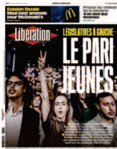
Libération , « Le pari des jeunes », 16 juin 2022

Les sujets politiques ont énormément occupé les Unes de presse de l'année 2022, marquée par la campagne et l'élection présidentielle ainsi que par les élections législatives.