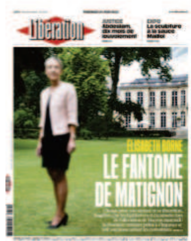
Libération, « Elisabeth Borne : Le fantôme de Matignon », 24 juin 2022

Le numérique devient un moyen de représentation : le montage, le recadrage ou le floutage, loin d'être discret, deviennent des vecteurs de sens utilisés pour l'image imprimée en Une. On observe une prédominance de ces moyens de représentation pour les sujets politiques, ce qui rejoint ce que nous a dit Denis Allard : il faut passer outre les aspects communicationnels savamment mis en place par les personnalités politiques pour pouvoir produire une image nouvelle. Pour la Une du 31 mars 2022 (photo : Denis Allard), on reconnaît Marine Le Pen complètement floue. Le journal titre : «Le Pen, elle est là...». Sa figure est presque fantomatique et sous-entend la peur de sa possible accession au pouvoir dans le contexte des élections présidentielles. Aussi, on reconnaît le goût du contraste propre aux photographies de Denis Allard : cela durcit son visage, ses yeux sont complètement dans l'ombre tout comme la moitié de son visage. L'image suggère l'inquiétude, et le flou est un moyen technique qui permet l'indéfinition de l'image : les formes ne sont pas franches, donc le lecteur peut laisser place à son imagination. C'est là que surgit l'angoisse. Le flou permet tout de même la présence de la figure et de ses caractéristiques, permettant de la reconnaître : Marine Le Pen est caractérisée par sa chevelure blonde, que le lecteur peut reconnaître.