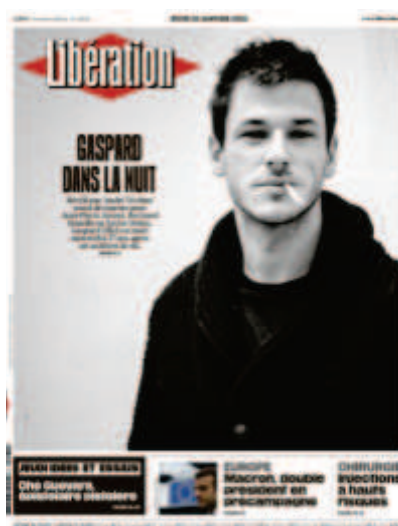
Libération , « Gaspard dans la nuit », 20 janvier 2022, photo : Renaud Monfourny.