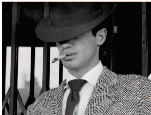
Godard, Jean-Luc, À bout de souffle , 1960 (détail)

Dans les films de Jean-Luc Godard, pour ne prendre que cet exemple, les hommes sont toujours représentés de la sorte. Un effet de mode qui permet d’ancrer Libération dans son contexte culturel.