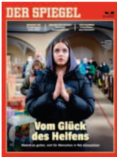
Der Spiegel , « Vom Glück des Helfens », 16 avril 2022.