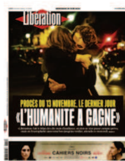
Libération , « L'humanité a gagné », 29 juin 2022, photo : Frédéric Stucin.