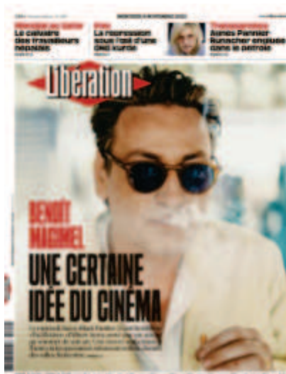
Libération , Benoît Magimel, 9 novembre 2022, photo : Bobby

Libération n'échappe pas aux types de représentation visuelles à la mode depuis sa création. Si le journal innove dans son recours à l'image, il lui arrive d'user de topos visuels pour créer du sens et pour parler à un lectorat de sa génération. Nous pouvons prendre l'exemple des portraits d'acteurs et des réalisateurs masculins à la Une. Le 20 janvier 2022, la mort de Gaspard Ulliel fait la Une (photo : Renaud Monfourny), le 9 novembre, Benoît Magimel est représenté après la sortie du film Pacification , (photo : Bobby) et le 14 septembre, c'est la mort de Godard qui occupe la page (photo : Richard Dumas). Sur les trois images, les hommes sont représentés cigarette ou cigare à la main, la fumée se répandant sur leurs visages et sur l'image. Elle peut représenter la pensée, de par son aspect vaporeux et mouvementé. Ce topos visuel est très caractéristique des représentations masculines des années 1960, juste avant la naissance du journal. Libération colle aux représentations de sa génération en usant de ses codes, peut-être pour être reconnu par un lectorat appartenant lui aussi à cette génération.