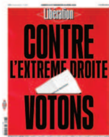
Libération , « Contre l'extrême droite votons », 24 et 25 avril 2022.

«NON», et avec la tête de Jean-Marie Le Pen comme écrasé par les grandes capitales. Pour la der, là aussi le choix politique est ferme : le journal donne une intention de vote : « Pour la République OUI », avec un vote pour Jacques Chirac dessiné comme glissant dans l'urne. En 2022, certains codes sont retenus volontairement. Une nouvelle fois, dans l'édition du samedi 24 et du dimanche 25 avril 2022, le journal donne une consigne de vote : «Contre l'extrême droite VOTONS ». Un bulletin « Emmanuel Macron » glisse à son tour dans une fente rappelant l'urne.