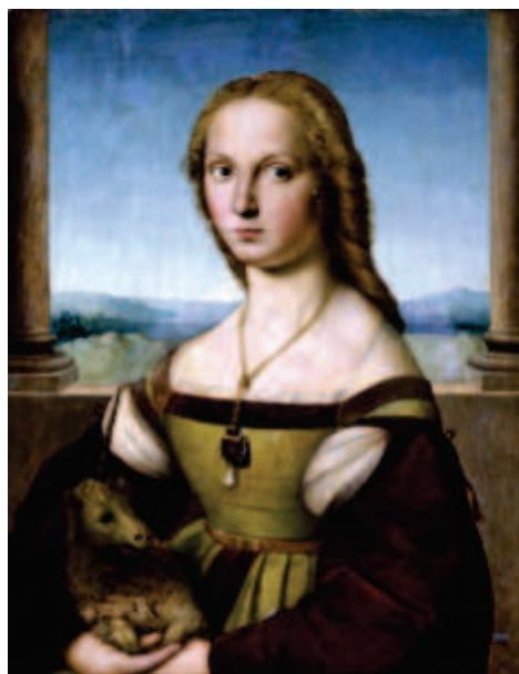
Raphaël, La Dame à la licorne , 1506, huile sur toile appliquée sur bois, Rome.