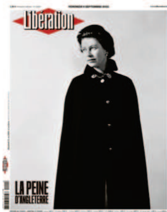
Libération , « La peine d'Angleterre », le 9 septembre 2022, photo : Cecil Beaton

sur le site de Libération et qu'une partie des revenus sera reversée à des associations favorisant l'accès à l'IVG. La dimension commerciale est importante dans ces vidéos : la communication choisie met en avant le format papier et l'importance de la une comme objet de collection.