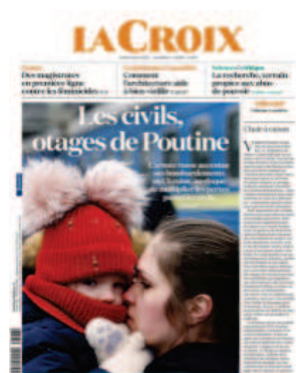
La Croix , « Les civils otages de Poutine », 8 mars 2022

Une étude comparée des Unes publiées le mardi 8 mars 2022 dans Libération , La Croix , Le Monde et Le Figaro permet de comprendre ces différences de sensibilité et de références culturelles en fonction du type d'information mis en avant. Le contexte est le même : treize jours après l'invasion Russe en Ukraine, la Russie assure l'ouverture de « couloirs