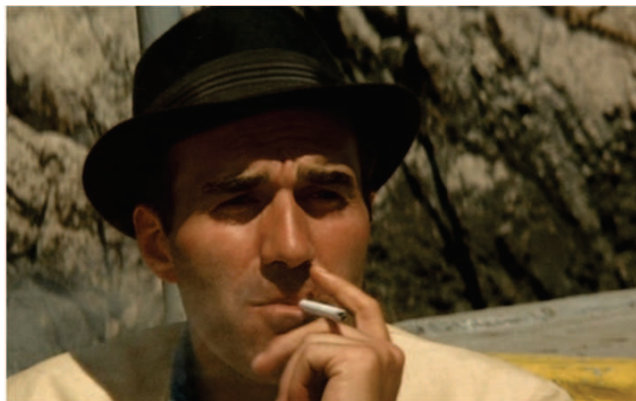
Godard, Jean-Luc, Le Mépris , 1963 (détail)