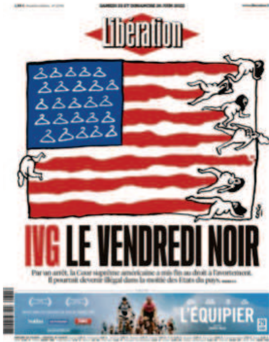
Libération , « IVG, le vendredi noir », samedi 25 et dimanche 26 juin 2022, illustration : Coco

Cette stratégie est visible dans la manière qu’a Libération de communiquer sur les réseaux sociaux: lors d’événements historiques où les unes sont choisies avec une attention très particulière, il n’est pas rare que des formats vidéos soient publiés pour expliquer ces choix. Ce fut notamment le cas au lendemain de la mort de la reine Elisabeth II d’Angleterre,