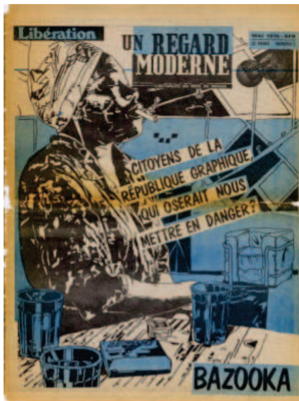
Libération , mai 1978, illustration : Bazooka

Mais Libération naît aussi suite aux mouvements de mai 1968, à la fois politiques, sociaux et culturels, et qui influenceront grandement sa constitution : “ Journal “mouvementiste” dans une tradition soixante-huitarde revendiquée, Libération était la chambre d’échos et le livre d’images des grandes manifestations de la jeunesse ou des grandes grèves salariales. Libération était le réceptacle fiévreux des grands drames de l’histoire immédiate ” souligne lyriquement Laurent Joffrin 5 . L’image est forte : le journal a vocation à recueillir les passions, à représenter une forme d’histoire du présent, à la fois en train de s’écrire et déjà en réflexion. Pour ce faire, le journal a toujours opté pour des choix éditoriaux très marqués, qu’il s’agisse de l’écriture, de la maquette ou de l’importance des images. Dans le paysage médiatique français, Libération fait de la forme une force, qui n’est pas qu’au service du fond, mais qui sait aussi se faire vectrice de sens. Tout était déjà dans le titre : Libération, sortir des carcans et des maquettes rigides au lendemain de Mai 68.