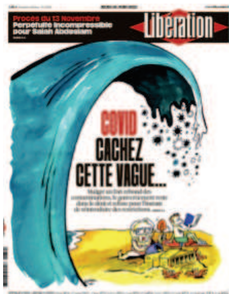
Libération , « Covid cachez cette vague », 30 juin 2022, dessin : Coco