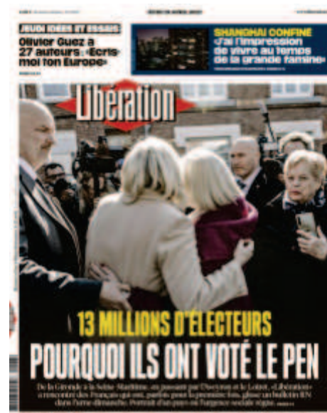
Libération, « Pourquoi ils ont voté Le Pen », 28 avril 2022

Au cours d'une année qui s'est écoulée dans l'incertitude, voyant monter le Rassemblement National de Marine Le Pen, le parti Renaissance d' Emmanuel Macron et La France Insoumise de Jean-Luc Mélenchon, il ne semblait pas y avoir de favoris. Libération a traité cette fracture sociale avec beaucoup de réalité. On observe notamment que les images traitant