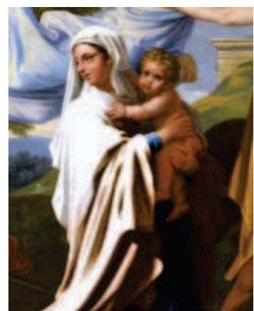
Poussin, Nicolas, La Fuite en Égypte , 1657-1658, huile sur toile, Lyon. (Détail)