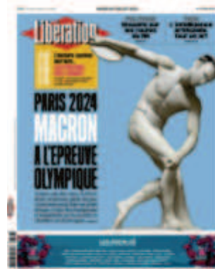
Libération , « Macron à l'épreuve olympique », 26 juillet 2022

Les références à l'histoire de l'art permettent de créer du sens pour un lecteur qui sait en déchiffrer les codes. Les références iconographiques choisies par Libération sont marquantes dans la culture occidentale. Plus ou moins explicites, elles densifient la compréhension de l'image.