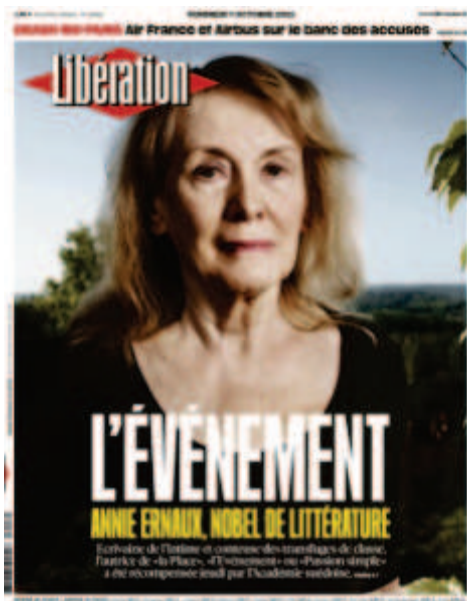
Libération , « L'évènement », 7 octobre 2022