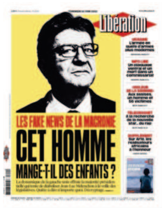
Libération, « Cet homme mange-t-il des enfants ? », le 10 juin 2022

Jean-Luc Mélenchon (...) Quitte à dire n'importe quoi ” précise le sous-titre. En faisant de ce dernier une figure ogresque, le journal invite le lecteur à mesurer les accusations portées par la majorité présidentielle contre le représentant de la gauche unie. En somme, que ce soit par la litote ou l'hyperbole, l'ironie bouscule le lecteur. Ce dernier doit rétablir le curseur de sa propre pensée : où se trouve le juste milieu ?