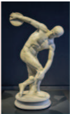
Myron, Le Discobole , entre 460 et 450 av. J.-C., marbre et bronze.

3.1. Les références à l'histoire de l'art : faire écho aux habitudes iconographiques et visuelles occidentales dans un but communicationnel.