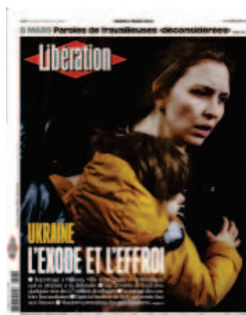
Libération , « L'exode et l'effroi », 8 mars 2022, photo : Gleb Garanich