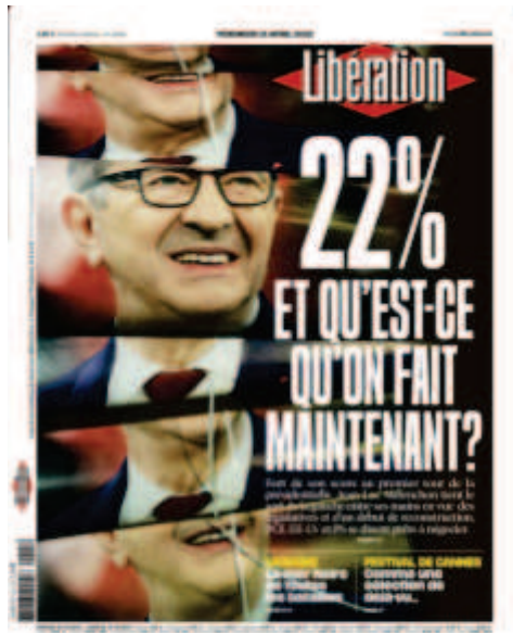
Libération, « 22% et qu'est-ce qu'on fait maintenant ? », 15 avril 2022, photo : Cyril Zannettacci

Le sens n'est pas le même pour la Une du 24 juin 2022 (photo : Noël Saget). Ici, c'est une photo d'agence qui est reprise par Libération est modifiée pour que la figure d'Elisabeth Borne soit floue. Là où Marine Le Pen est représentée sur un fond noir, Elisabeth Borne est