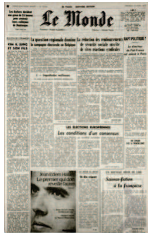
Le Monde , 15 avril 1977

C’est d’abord avec ses unes singulières que le quotidien affirme sa différence: des photographies ou des dessins en pleine page remplacent les colonnes de textes étroites et rigides qui ornent le paysage journalistique français de l’époque, comme nous pouvons le voir sur l’édition du Monde datant du 15 avril 1977. Dès 1977, Serge July, cofondateur du