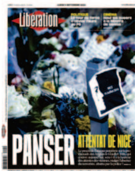
Libération , « Panser : Attentat de Nice », 5 septembre 2022, photo : Olivier Monge.