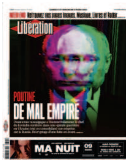
Libération , « Poutine : De mal empire », 5 et 6 mars 2022, photo : Rafael Yaghobzadeh

d'appréhension de la télévision et de ses messages sont profondément marqués par sa nature électronique qui permet une simultanéité de l'émission de la scène télévisée et de sa réception 41 ». C'est de ce rapport à l'image dont s'inspirent les photographes de Libération qui représentent les figures politiques à travers l'écran. Il s'agit toujours de représenter la réception de l'image politique pour mieux en questionner l'aspect communicationnel.