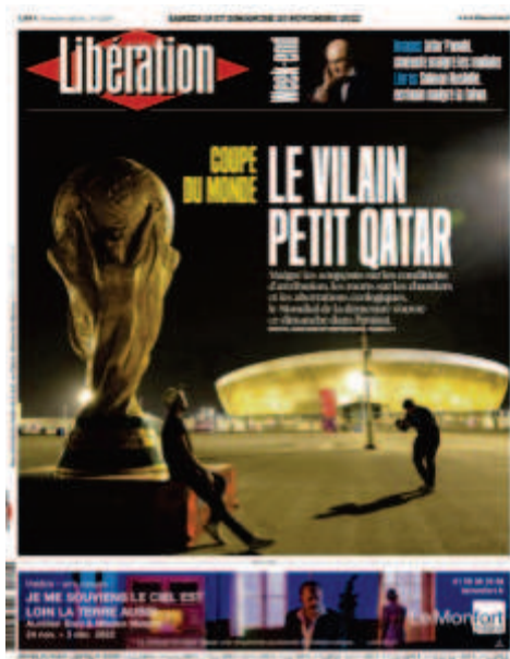
Libération , « Le Vilain petit Qatar », 19 et 20 novembre 2022, photo : Keita Iijima.

morts sur les chantiers et les aberrations écologiques, le Mondial de la démesure s'ouvre ce dimanche dans l'émirat ». Le titre fait immédiatement écho au conte populaire, Le Vilain Petit Canard , et le lecteur comprend que le Qatar est l'hôte mal-aimé, petit face aux grandes nations qui ont l'habitude d'organiser la grand-messe du ballon rond. En une phrase, et sans même lire le sous-titre, nous comprenons le propos du papier qui nous attend dans les premières pages du journal puisque la référence est comprise et résonne avec l'actualité chaude. En somme, cette liberté dans le choix des stéréotypes, des expressions populaires et des jeux de mots renoue avec les principes éditoriaux initiaux du journal, présents dès sa genèse : le goût pour le langage oral, compréhensible par le plus grand nombre.