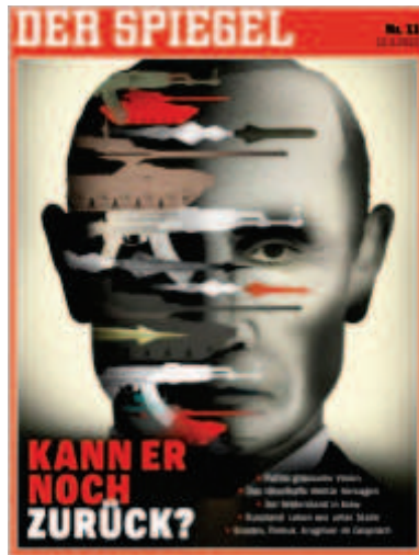
Der Spiegel , « Kann er noch Zurück ? », 12 mars 2022

L'écran de télévision n'est pas une projection mais une diffusion venant de l'objet lui-même. En ce sens, on constate avec étonnement la grande matérialité des photographies qui représentent les images diffusées. Il existe dans l'image une forme de coprésence entre la scène représentée et la scène du quotidien, vécue face à la télévision : « Les modes