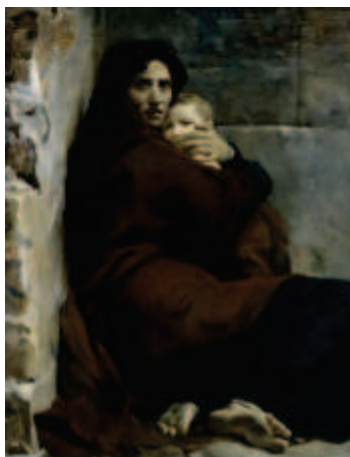
Cogniet, Léon, Le Massacre des Innocents , 1824, huile sur toile, Rennes. (Détail)

La Croix et Libération font des choix opposés, propres à leurs choix éditoriaux. Pour Libération , une femme ukrainienne et son enfant sont représentés en plan serré. Pas d'éléments de décor, aucun contexte autre que le titre : « Ukraine : L'exode et l'effroi » (photo : Gleb Garanich). Prise à la gare de Kiev par le photographe ukrainien Gleb Garanich pour l'agence Reuters, il s'agit d'illustrer la fuite des Ukrainiens après le début de la guerre. L'image est presque picturale pour le spectateur occidental, qui peut y voir des références multiples, notamment au Massacre des Innocents de Léon Cogniet, huile sur toile de 1824. Là aussi, le regard sombre, la main protectrice de la mère sur le visage rond de l'enfant et l'angoisse prédominante accrochent le regard du spectateur. Loin d'être une référence mondaine ou vaine, il s'agit de faire écho à des codes occidentaux ancrés dans la culture collective pour mieux susciter l'émotion, et pour rapprocher un événement qui peut paraître lointain, désincarné, de nos propres références. La Croix fait un choix similaire en titrant « Les civils, otages de Poutine ». La légende de la photographie, prise par Kai Pfaffenbach, souligne « À la gare de Lviv, en Ukraine, une mère et sa fille attendent de monter dans un train pour la Pologne, samedi 5 mars ».