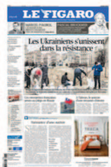
Le Figaro , « Les Ukrainiens s'unissent dans la résilience », 8 mars 2022

Dans d'autres cas, les références à l'histoire de l'art sont plus subtiles et n'ont pas pour but principal de mettre en avant des connaissances culturelles. Certaines références iconographiques servent plus à faire appel à des codes auxquels le spectateur-lecteur contemporain est habitué, afin d'attiser sa sensibilité esthétique.