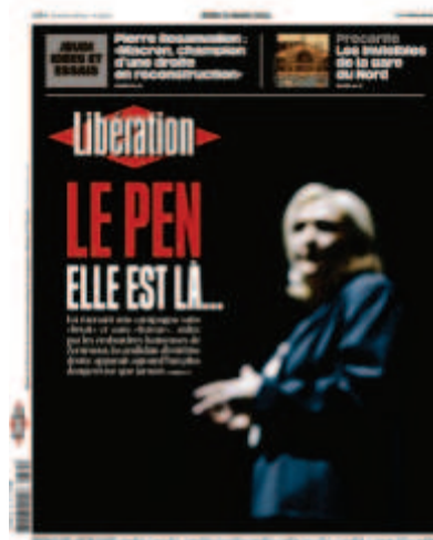
Libération, « Le Pen, elle est là », 31 mars 2022, photo : Denis Allard