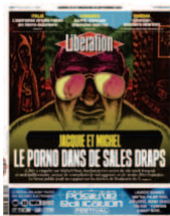
Libération, « Le porno dans de sales draps », 24 et 25 septembre 2022, dessin : Hugues Micol.

C'est une question que toutes les rédactions se posent à l'heure actuelle : alors que l'image est au cœur de l'expérience du lecteur, comment combler le manque d'image ? Comment garantir la force de l'image sans possibilité de représenter pleinement le sujet traité ? Pour donner plus de force à certains sujets pour lesquels on ne peut pas avoir d'image photographique impactante, la rédaction fait souvent le choix du dessin. Pour ce faire, les illustrateurs de Libération sont amenés à représenter certaines enquêtes. Pour l'enquête sur le site pornographique