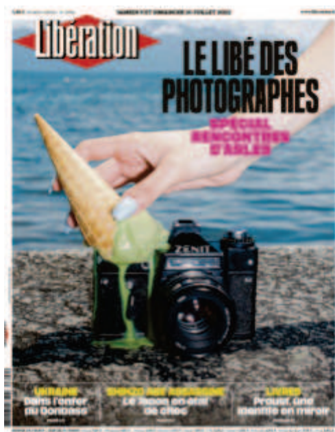
Libération, « Le Libé des photographes », 9 et 10 juillet 2022