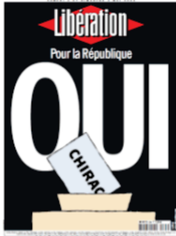
Libération , « Pour la République : OUI Chirac », 2002.

En Une, Libération va jusqu'à donner des consignes de vote en Une, montrant l'importance de ces premières lignes que le regard croise au kiosque sont importantes. Nous pouvons constater ce parti pris en comparant deux Unes, la première datant de 2002 et la seconde de 2022. Deux contextes proches : l'extrême droite arrive au second tour des élections présidentielles. Dans un climat social tendu, Libération sort une Une sur laquelle il est écrit