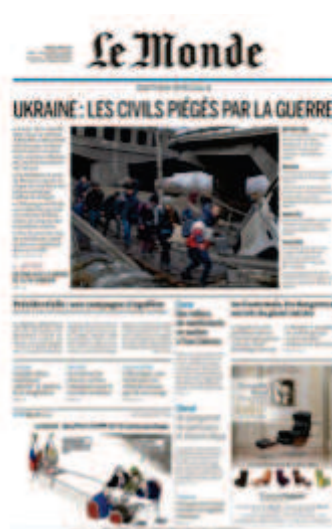
Le Monde , « Ukraine : Les civils piégés par la guerre », 8 mars 2022