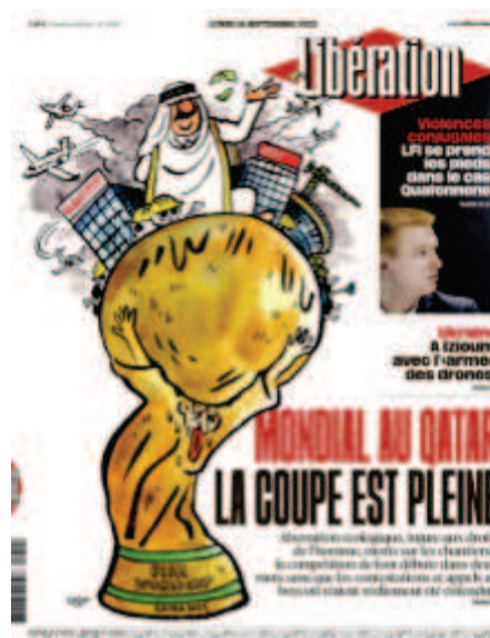
Libération , « La coupe est pleine », 19 septembre 2022, dessin : Coco

En 2021, Coco devient la dessinatrice attitrée du quotidien Libération . Depuis, elle réalise de nombreuses Unes pour le journal. Lorsqu'on la questionne sur le dessin de presse,