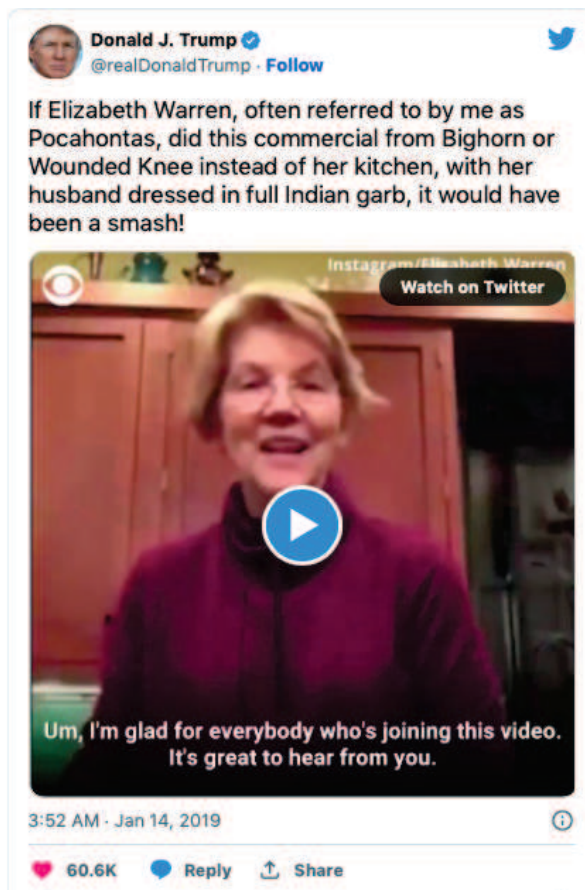
Réaction de Donald Trump à la vidéo d'Elisabeth Warren, Twitter, 14 janvier 2019