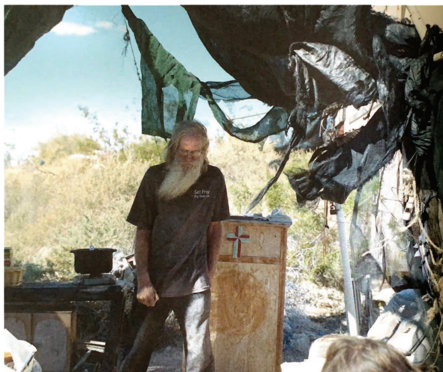
Laura Henno, « Outremonde », America n°4, p.137-149, hiver 2018

En tant que support hybride, le mook America donne aussi une place particulière à la photographie. Chaque numéro est doté d'un portfolio qui n'aborde pas nécessairement le même thème que le dossier. Ces photographies ont pour objectif de montrer une autre Amérique, loin des fantasmes. Dans la revue numéro 8, le portfolio réalisé par la photographe Laura Henno, « Outremonde », veut montrer les visages d'une Amérique invisible. Réalisées en Californie, près du lac de la Salton Sea, à Slab City, ces photographies capturent le quotidien de squatteurs dans un campement délabré de mobiles homes.