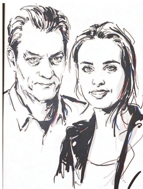
Dessin de Paul et Sophie Auster dans « Partis Pris », America n°15, p.11, automne 2020

Les revues America offrent aux écrivains un support médiatique où ils peuvent s'exprimer sans contrainte. C'est ce qu'illustrent les « Partis Pris » où, pour chaque numéro, un ou plusieurs auteurs parlent sur un sujet librement choisi. Ils sont publiés en version originale et en version française. Une illustration représentant l'auteur précède toujours le récit. Dans la revue numéro 15, Paul et Sophie Auster signent dans « Votez ! » une lettre ouverte destinée aux électeurs américains pour se hisser face à la réélection de Donald Trump. Paul Auster s'adresse aux déçus, à ceux qui ne croient pas au couple formé par Joe Biden et Kamala