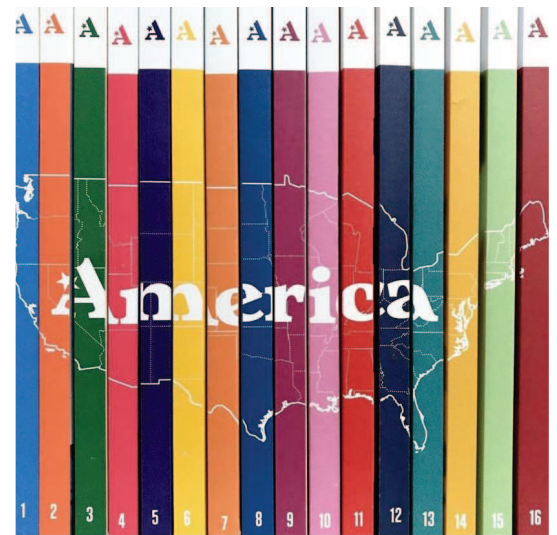
Les seize revues America forment le drapeau américain.

Suite à notre analyse, nous pensons que choisir le mook comme support renferme aussi une ambition de postérité. America couvre les années Trump mais souhaitait aussi capturer le regard d'écrivains américains appartenant à une génération en train de disparaître. On peut citer les auteurs Toni Morrison, Tom Wolfe mais aussi Gay Talese qui ont participé à la revue. Grâce à ses graphismes et à sa taille, le support du mook permet aussi de créer une collection. C'est ce que montre America avec ses seize revues. En les associant toutes, leur dos forment le drapeau américain.