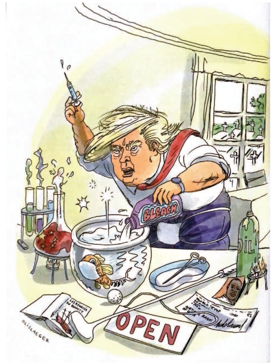
« La chronique du poisson rouge », dessin de François Olislaeger, America n°3, p. 21, été 2020

Le mook America n'hésite pas à critiquer le 45ème président des États-Unis. Cependant, la revue veut surtout résister aux conséquences du trumpisme en mobilisant les écrivains. America estime que la littérature est le meilleur rempart pour saisir le réel face aux mensonges. C'est ce que nous allons étudier dans la troisième partie.