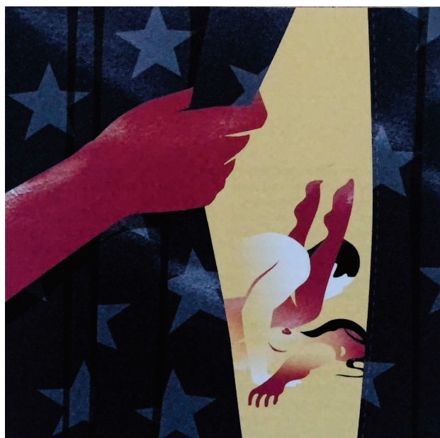
Illustration dans «Prostitution - un autre trafic», America n°14, p.139, été 2020

Mais pourquoi commencer par une histoire sur les armes pour évoquer le trafic sexuel au Mexique ? Le personnage créé par Gabino Iglesias réapparaît à la fin du récit. L'homme américain se rend à Tijuana, ville frontalière du Mexique, réputée pour être la plaque tournante du trafic sexuel. En plus d'être coupable d'une fusillade, il profite de cet esclavagisme. Dans ce récit, l'écrivain veut dénoncer l'hypocrisie des États-Unis qui fournit des armes et alimente la prostitution forcée : « De même que la majorité des armes utilisées par les cartels provient des États-Unis, la majorité de l'argent généré par la prostitution au Mexique provient de clients américains 43 . » D'autant plus que le personnage de fiction de Gabino Iglesias est un soutien de Trump. Il valide donc sa politique migratoire tout en profitant de la misère à la frontière. Ici, utiliser la fiction permet de révéler une réalité face à