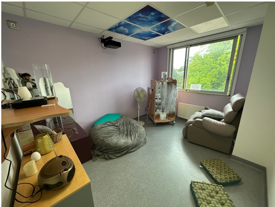
Image n°1 : Salle d'apaisement de l'unité Gaudi équipée d'un environnement multi-sensoriel.

Certains infirmiers de l'unité ont pu être formés à des thérapies sensorielles, dont l'approche multi-sensorielle au travers d'une formation « snoezelen » notamment.