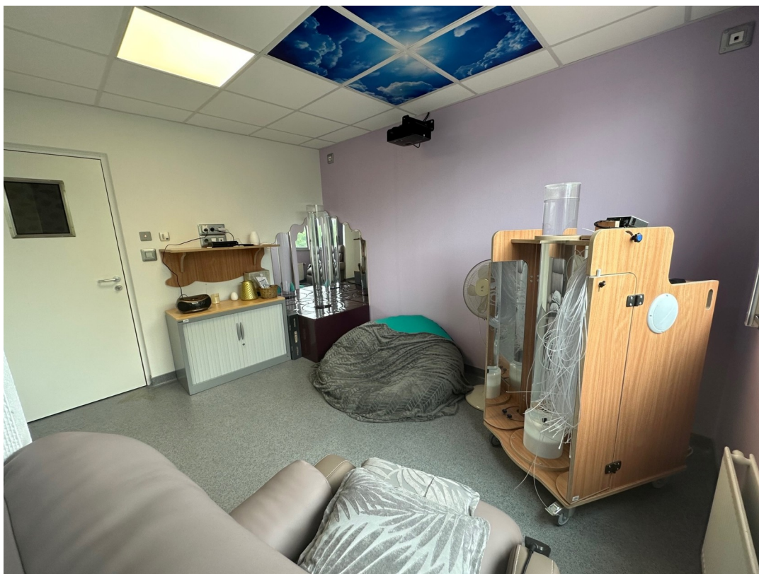
Image n°2 : Salle d'apaisement de l'unité Gaudi équipée d'un environnement multi-sensoriel.