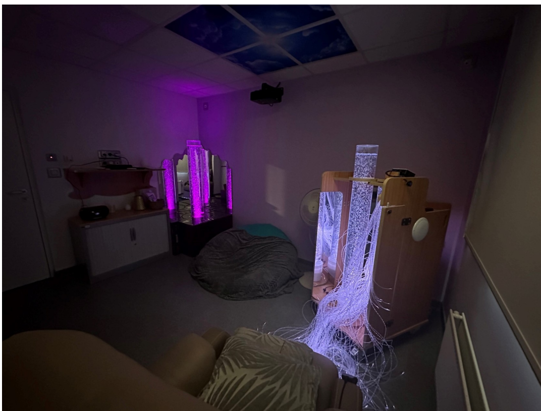
Image n°3 : Salle d'apaisement de l'unité Gaudi équipée d'un environnement multi-sensoriel.