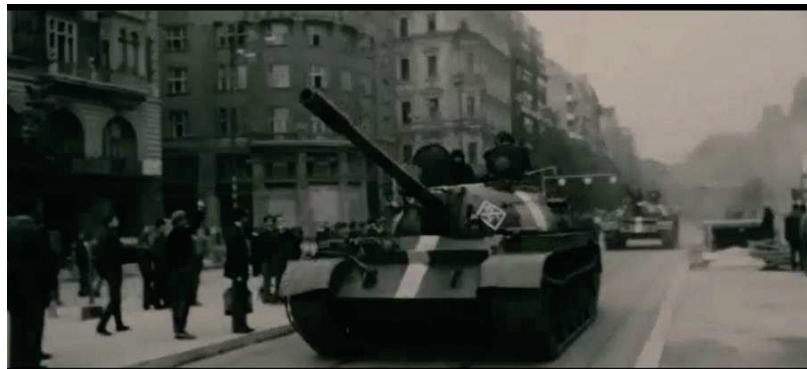
Figure 24 : la diversité du travail journalistique de Raymond Depardon, des chars russes en Tchécoslovaquie...