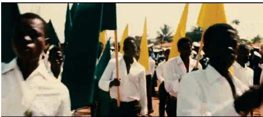
Figure 19 : Raymond Depardon, jeune journaliste, continue de s'entraîner en marchant même si "ces plans ne servent qu'à lui", comme ici au Venezuela.