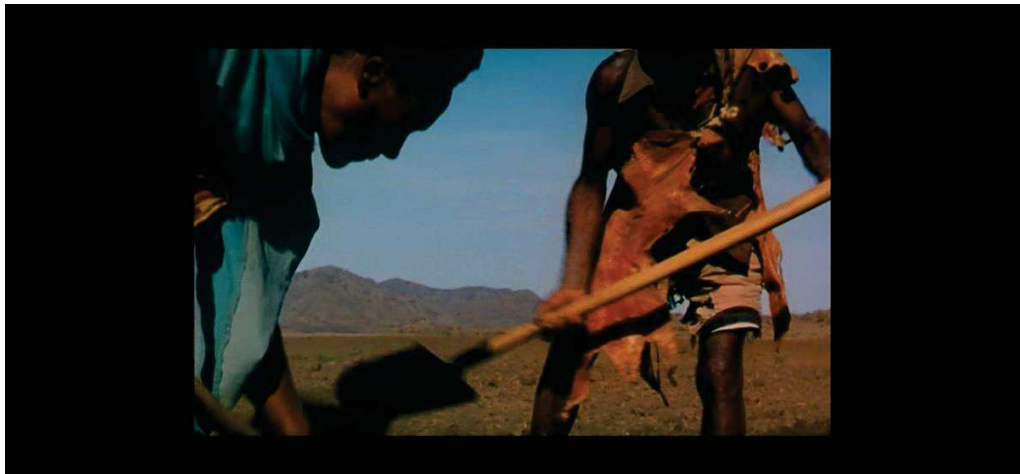
Figure 4 : Le travail quotidien n'était pas seulement une façon de s'entraîner à photographier et à filmer, il s'agit d'un véritable recours narratif et journalistique pour Raymond Depardon, il ponctue ses œuvres