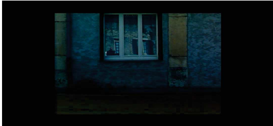
Figure 23 : le caractère autobiographique des documentaires de Depardon se matérialise par ses apparitions fugaces, comme ici dans le reflet d'une fenêtre de la ferme du Gare.

Pour l'historien et critique d'art, introduire de l'autobiographie, du « moi » au sein du travail documentaire était une réponse à la double crise qui frappe le photojournalisme à la fin des années 1970. Concurrencés par la télévision, le reportage photo comme le reportage d'auteur vivent la fin de leur âge d'or, sur lequel régnait les figures mythiques de la photographie comme Cartier Bresson, Capa, ou encore Seymour. Il faut se réinventer. En rédigeant des « Notes », en assumant sa subjectivité dans des commentaires intimes, Raymond Depardon s'aventure à la recherche d'un nouveau modèle, le sien, contrairement aux autres photographes qui « ne cherchaient à s'affirmer que d'un point de vue photographique. » 20