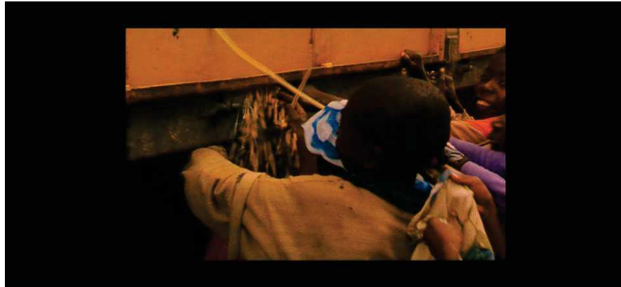
Figure 8 : A l'image des enfants qu'il enregistre, Raymond Depardon fait confiance à l'improvisation

Dans les documentaires de Raymond Depardon, toutes les personnes filmées continuent à faire ce qu'elles font d'ordinaire. C'est la définition du cinéma que donne le mouvement Kino-pravda, ou « cinéma vérité » en 1920. Né en Russie, celui-ci entend remplacer l'œil humain par celui de la caméra, plus précis, plus objectif pour rendre compte du réel. Raymond Depardon s'inscrit dans cet héritage lorsqu'il laisse sa caméra tourner sur sa tête pivotante dans Afriques sans un mot.