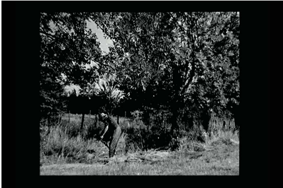
Figure 3 : Le père de Raymond Depardon fauchant ses champs