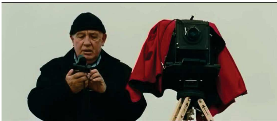
Figure 28 : Raymond Depardon compte et explique le temps de pose de la prise de vue à la chambre.

« Faire des photos à la chambre, c'est tout un exercice ! Il faut ouvrir l'objectif, viser, cadrer, faire le temps de pause, fermer l'objectif, mettre un chassis, bien vérifier qu'on a armé, que tout est fermé, ouvrir le volet, respirer un grand coup. »