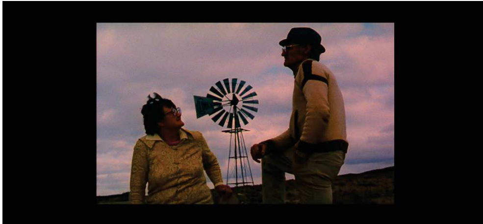
Figure 9 : Raymond Depardon s'efface dans ses documentaire pour laisser à ses filmés "une chance d'apparaître comme ils sont".

Cette obsession pour la quotidienneté se retrouve dans les rares interviews qu'il choisit de garder au montage. Lorsqu'on entend le cinéaste poser des questions, la simplicité prime : « Comment se passe une journée ? » demande-t-il à François Claustre, dans un entretien publié au journal télévisé, repris dans Journal de France , alors que l'archéologue est retenue en otage depuis plus d'un an. Il « récidive » dans Afriques : « La vie dans la prison est dure ici ? ». C'est une des premières interrogations qu'il pose à une femme, présumée génocidaire, enfermée dans la prison de Kigali en attente de son procès quelques mois après le drame rwandais. Poser des questions banales lui permet de mettre en valeur la quotidienneté et ainsi dans le même temps de souligner qu'il n'a pas altéré le réel en le capturant. L'ordinaire lui sert donc également de caution morale et professionnelle.