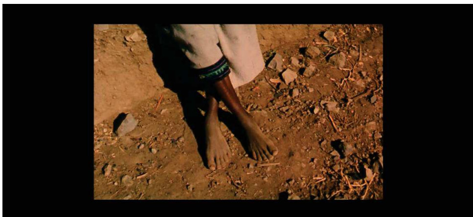
Figure 13 : Filmer les pieds nus d'une ramasseuse de bois éthiopienne, un acte "politique" pour Raymond Depardon.

Dans Afriques , filmer la quotidienneté est de la même façon un engagement, la condition de la formulation de critiques. Lorsqu'il revient en entretien sur la scène des porteuses d'eau et de bois éthiopiennes, il précise : « Je filme cette femme qui marche comme ça, apparemment il n'y a rien d'extraordinaire. [...] Je montre qu'elle est pieds nus pour bien dire où on est, c'est un acte politique ce plan, voilà. » Par petites touches, le cinéaste dénonce.