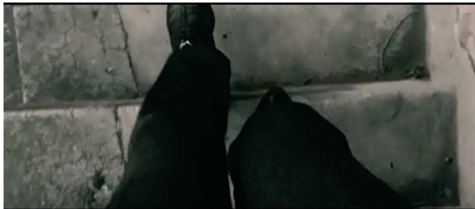
Figure 18 : ... et en descendant les marches de la ferme de ses parents