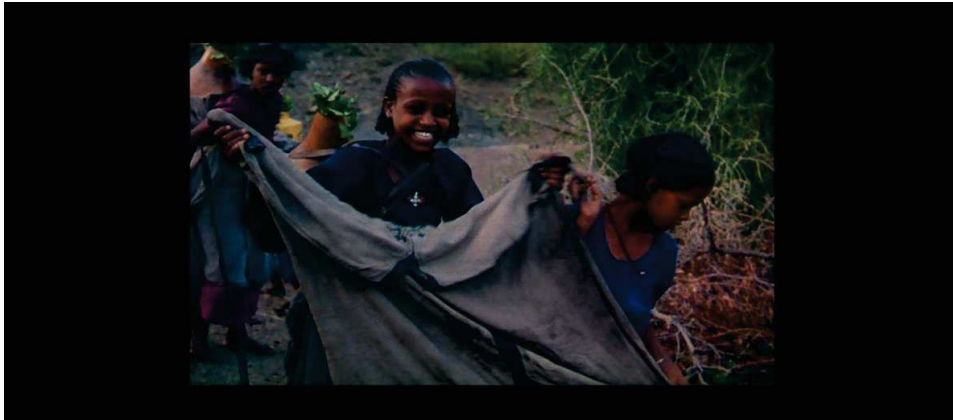
Figure 16 : Le cinéaste compare sa "douleur" à la légèreté des porteuses d'eau, malgré la difficulté de leur quotidien

Ce souci du détail, cette volonté de transmettre le réel dans son intégralité pratique, de donner à voir, à sentir, de se mettre dans la peau d'autrui, oblige au plan séquence. Ces scènes sont particulièrement prisées par Raymond Depardon. Depuis ses débuts au cinéma, il utilise ce mode d'enregistrement. Dans Journal de France , son Claudine Nougaret, commentatrice des rushes et extraits-souvenirs des archives du couple, nous montre ses premiers tours de manivelle. En 1962, à la ferme du Garet, la maison familiale, Raymond Depardon s'entraîne à monter et descendre des escaliers en filmant, une scène qu'il commente d'ailleurs dans Les Années Déclics , « c'était difficile pour moi d'être cinéaste, ça s'est arrêté à des essais. » Mais il persévère et enregistre un essai dans Paris avec une consigne : ne jamais couper la caméra.