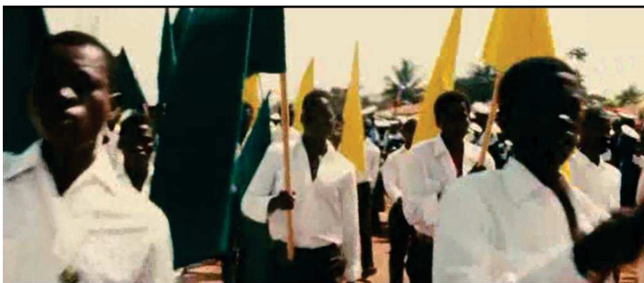
Figure 19 : Raymond Depardon, jeune journaliste, continue de s'entraîner en marchant même si "ces plans ne servent qu'à lui", comme ici au Venezuela.