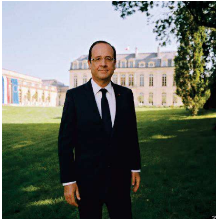
Figure 1 : Photographie officielle du Président de la République François Hollande, par Raymond Depardon (source : site internet de l'Élysée).

C'est d'ailleurs dans cette perspective que Raymond Depardon a été choisi pour réaliser la photographie du Président François Hollande, en 2012.