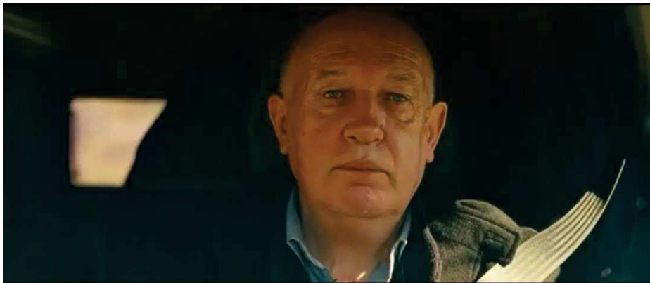
Figure 33 : Raymond Depardon derrière le volant et le pare-brise de sa camionnette. Qui filme ? (source : capture d'écran de Journal de France )