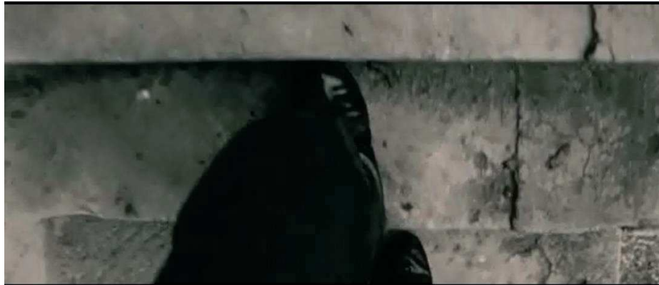
Figure 17 : Raymond Depardon s'entraîne adolescent à filmer en montant...