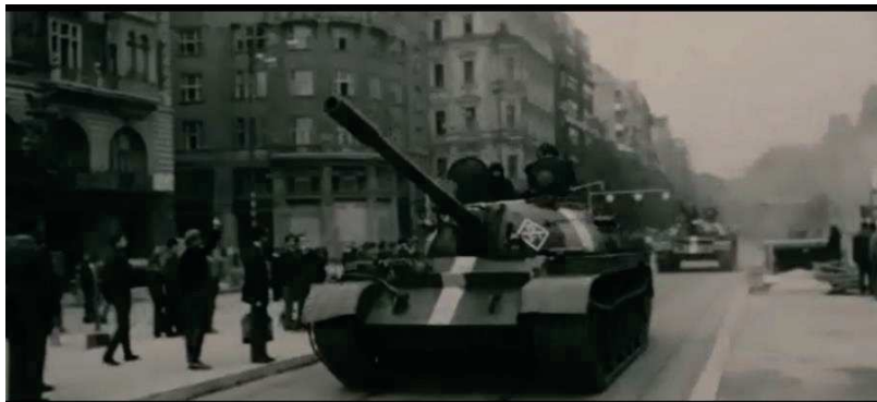
Figure 24 : la diversité du travail journalistique de Raymond Depardon, des chars russes en Tchécoslovaquie... (source : capture d'écran de Journal de France )