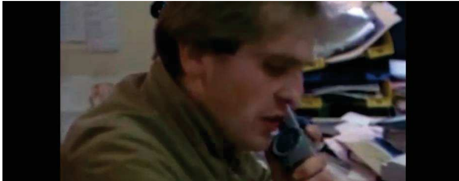
Figure 11 : le travail du journaliste consiste aussi à répartir les sujets, trouver et envoyer ses collègues photographes sur le terrain.