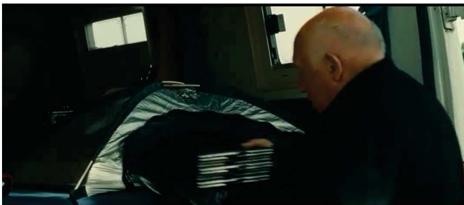
Figure 29 : Raymond Depardon va jusqu'à montrer sa chambre noire portative, l'envers du décor.