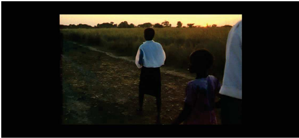
Figure 21 : ne pas trahir la réalité passe par filmer certains couchers de soleil pour Raymond Depardon.

Médiateur de la petite et de la grande histoire, son traitement fidèle du temps attribue même à son travail un aspect artistique, poétique comme lorsqu'il s'arrête et filme un coucher de soleil au Soudan. « Regardons ensemble le soleil se coucher sur une petite route. Chacun rentre dans son village, sa maison, toujours très digne malgré leur pauvreté. »