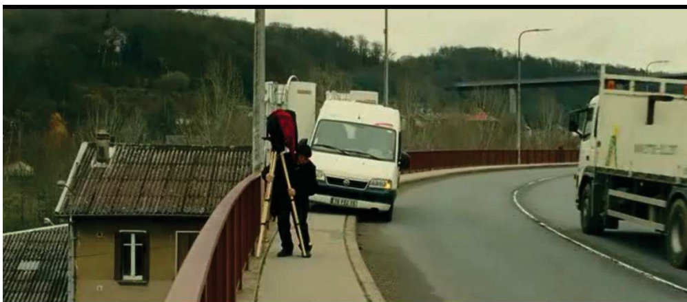
Figure 30 : Raymond Depardon et son trépied sur les routes de France.