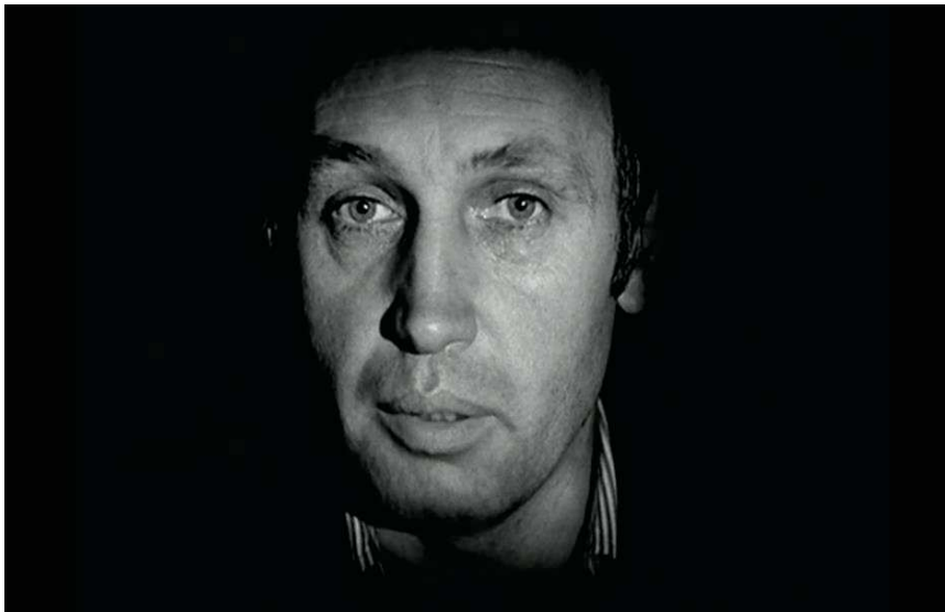
Figure 32 : Raymond Depardon se livre à la caméra et à son public dans les Années Déclics (source : capture d'écran des Années Déclics )

Raymond Depardon se met en danger, passant même devant la caméra, comme c'est le cas dans Journal de France et dans Les Années Déclics . A la fin de ce dernier documentaire, autobiographique, il conclue : « Je n'ai pas l'habitude de parler dans un micro. Mais je n'ai pas à répéter et nous n'avons pas à recommencer. C'était du vrai direct. » Il ne donne pas l'impression de goûter à ce spectacle, de s'offrir à la fois à l'image et au son par gaîté de cœur. Son visage est tiré, il ne sourit pas, mais il le fait tout de même, comme par devoir. Un devoir vis-à-vis de son public ?