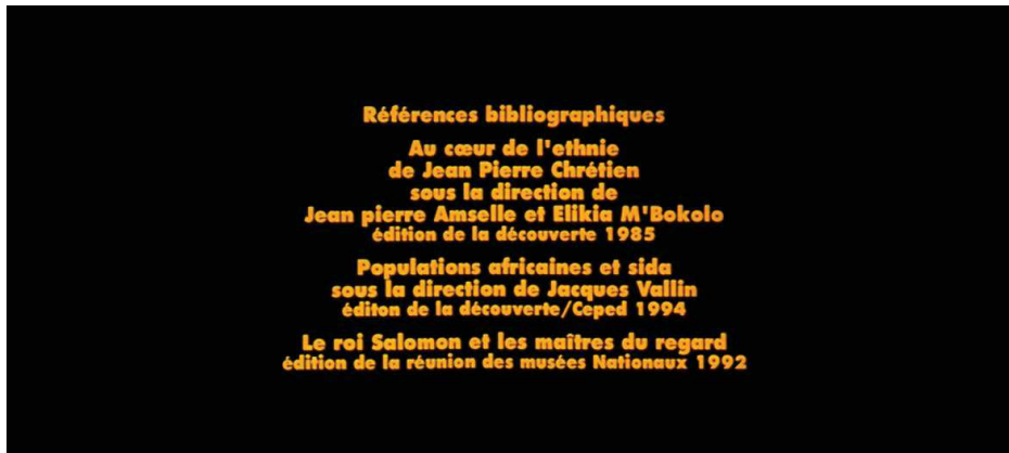
Figure 5 : Raymond Depardon cite ses sources à la fin d' Afriques

des deux côtés », contextualise : « l'Angola arrive en tête – du nombre de victimes de mines antipersonnel - avec l'Afghanistan et le Cambodge, suivi de près par le Mozambique. » Comme le font traditionnellement les journalistes professionnels, Raymond Depardon « cite ses sources », les ouvrages dont il a puisé ses inspirations et données à la fin du film.