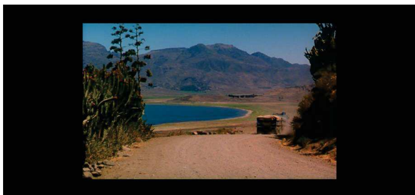
Figure 25 : ... aux divagations nostalgiques et poétiques devant les lacs éthiopiens. (source : capture d'écran d' Afriques )