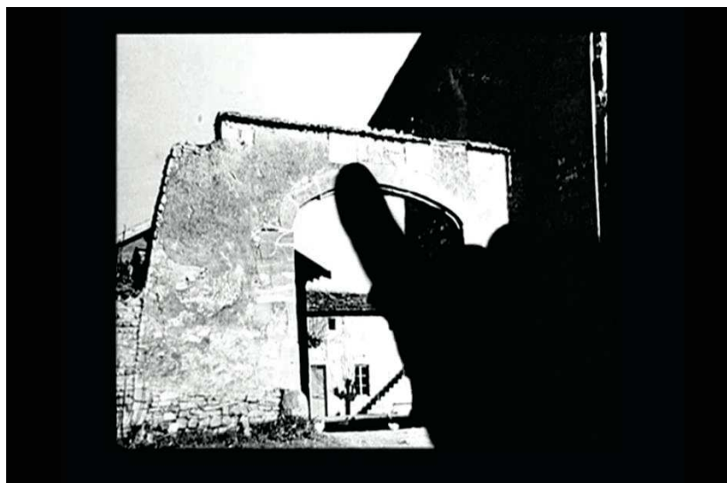
Figure 31 : le doigt de Raymond Depardon sur le rétroprojecteur guide le téléspectateur dans sa lecture des images.