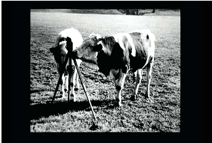
Figure 27 : l'oeuvre de Raymond Depardon est sous tendue par son tiraillement entre ses origines sociales paysannes et sa passion pour l'image. (source : capture d'écran des Années Déclies , photographie de R.D alors adolescent à la ferme du Garet)

avait eu besoin d'un simple déclenchement, d'une simple prise pour que son destin se révèle à lui. En ce qui concerne sa carrière de cinéaste, Depardon semble la dissocier de sa carrière de photographe : il dit ainsi « j'avais envie d'être photographe ou chasseur d'image (...) il y a une autre chose aussi, c'est que j'avais envie de faire du cinéma... ».