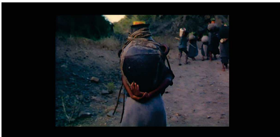
Figure 15 : Raymond Depardon suit le quotidien de porteuse d'eau, au sens propre comme figuré

Filmer le quotidien, la vie de tous les jours suppose d'en prendre le temps. Si l'on entend régulièrement l'expression « ville à taille humaine », il en est de même pour le cinéma : il existe des « films à temps humains ». C'est-à-dire des films qui respectent la durée d'un regard, d'une respiration. Celle de Raymond Depardon par exemple, lorsqu'il souffle, peinant à suivre les porteuses d'eau éthiopiennes. Le téléspectateur comprend l'endurance de ces femmes, la dureté de leur vie : elles n'ont pas l'air de souffrir de l'effort tandis que le cinéaste a du mal à trouver son souffle. Nous retrouvons d'ailleurs une nouvelle fois le lien entre le travail et le quotidien « Combien de kilomètres elles parcourent avec ce lourd fardeau à plus de 2 000 mètres d'altitudes vers leurs villages et leur maison ? » Raymond Depardon formule la question que chacun se pose durant le plan panoramique suivant. Il poursuit : « Moi qui souffre comme un malheureux à marcher 200 mètres, elles, cela ne les empêche pas de rire devant la caméra. [...] J'ai du mal à oublier les visages de femmes et de jeunes filles, rencontres muettes mais qui me touchent peut-être plus que tous les réfugiés rencontrés dans les camps [...] Il n'y a plus d'urgence ici, il a seulement la misère de tous les jours. »