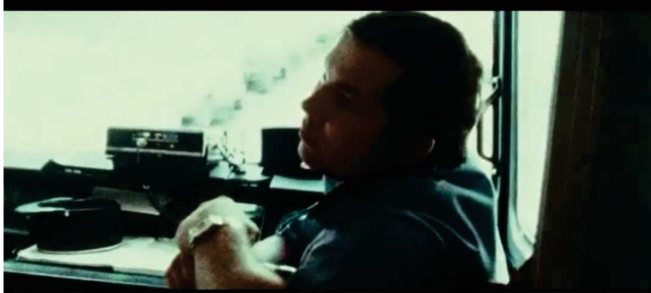
Figure 10 : Dans la camionnette de Police Secours

Cette réserve du cinéaste lui sert donc de caution morale, éthique : ce qu'il filme est vrai, ses documentaires sont empreints de la plus pure réalité, puisque les filmés s'habituent à sa présence jusqu'à ne plus s'apercevoir de la caméra. Raymond Depardon se fond dans le décor, il donne à voir le quotidien pour filmer « une autre actualité ».