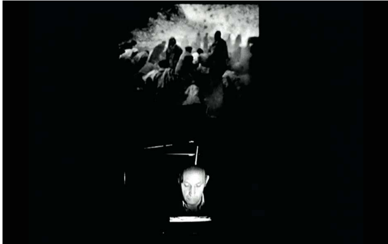
Figure 26 : le dispositif technique du documentaire autobiographique de Raymond Depardon : un rétroprojecteur pour les photos, et un vidéo-projecteur pour les vidéos.

l'impression qu'il se confronte au monde de plus en plus, à la fois lui-même et son objectif ce qui crée encore une impression d'indissociabilité entre l'homme et le photographe.