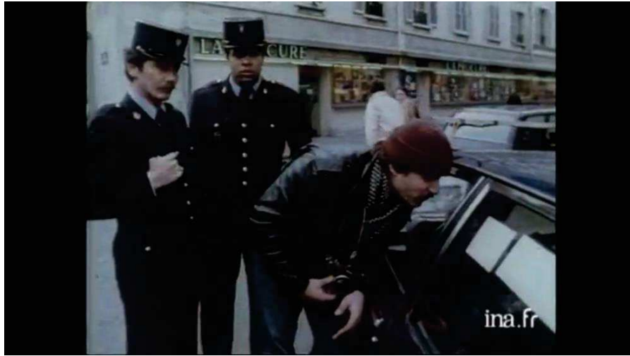
Figure 12 : Les photographes de l'agence Gamma négocient une photo de l'acteur Richard Gere alors qu'il s'est plaint aux policiers de l'insistance des journalistes.

Dans Afriques , filmer la quotidienneté est de la même façon un engagement, la condition de la formulation de critiques. Lorsqu'il revient en entretien sur la scène des porteuses d'eau et de bois éthiopiennes, il précise : « Je filme cette femme qui marche comme ça, apparemment il n'y a rien d'extraordinaire. [...] Je montre qu'elle est pieds nus pour bien dire où on est, c'est un acte politique ce plan, voilà. » Par petites touches, le cinéaste dénonce.