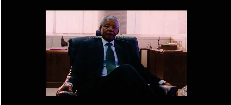
Figure 20 : Nelson Mandela pose pendant une "vraie" minute devant la caméra de Raymond Depardon

Ce plan fixe peut paraître long dans le sens où il n'y s'y passe rien. Il fait penser à un instantané. Mais plus qu'il ne dit la carrière de photographe de Raymond Depardon, il vise surtout à exprimer la souffrance d'un homme enfermé 27 ans, son courage, sa détermination et le défi qui l'attend. Raymond Depardon n'en était pas à son premier coup d'essai. Lors d'un de ses premiers reportages, à Prague, il filme la minute de silence pour l'immolation de Ian Palach. Il se remémore dans les Cahiers du cinéma en 1992 : « tout s'est arrêté. [...] heureusement pour mon plan, je suis sauvé par un clignotant de voiture, sinon on croirait que c'est une photo ! C'est curieux parce que c'est sans doute le premier plan qu'on voit de tous mes films, et c'est presque un plan photographie. C'est le hasard... »