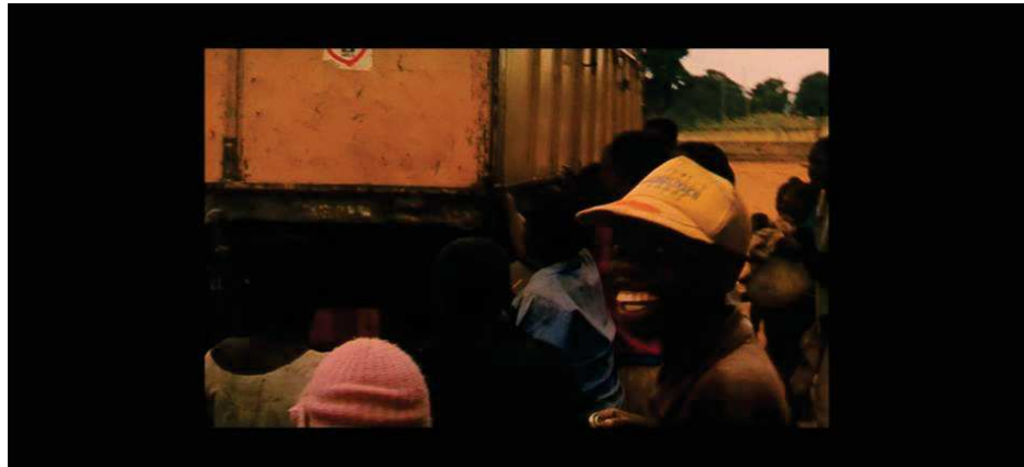
Figure 6 : Raymond Depardon capte dans ses documentaires la magie du quotidien

ramasser le plus rapidement le plus de grains possible, véritable concours d'ingénierie pratique. L'effervescence autour du camion, la surprise et la joie communicative des enfants pour qui cette nourriture tombe du ciel, témoigne d'une scène inédite, captée de leur quotidien.