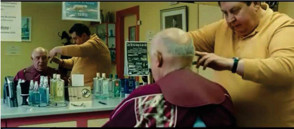
Figure 22 : Raymond Depardon n'hésite pas à mettre en scène son propre personnage.

l'authentique). En cinéma, il cherche alors la bonne place, parfois même en tournant sur lui-même à 360° comme dans Afriques . Alors qu'en photographie, la place du photographe se fait plus remarquer, est moins dissimulée, ne cherche pas à se faire discrète (on le voit dans Journal de France où il parle à ses modèles, les interroge – comme le barbier-).