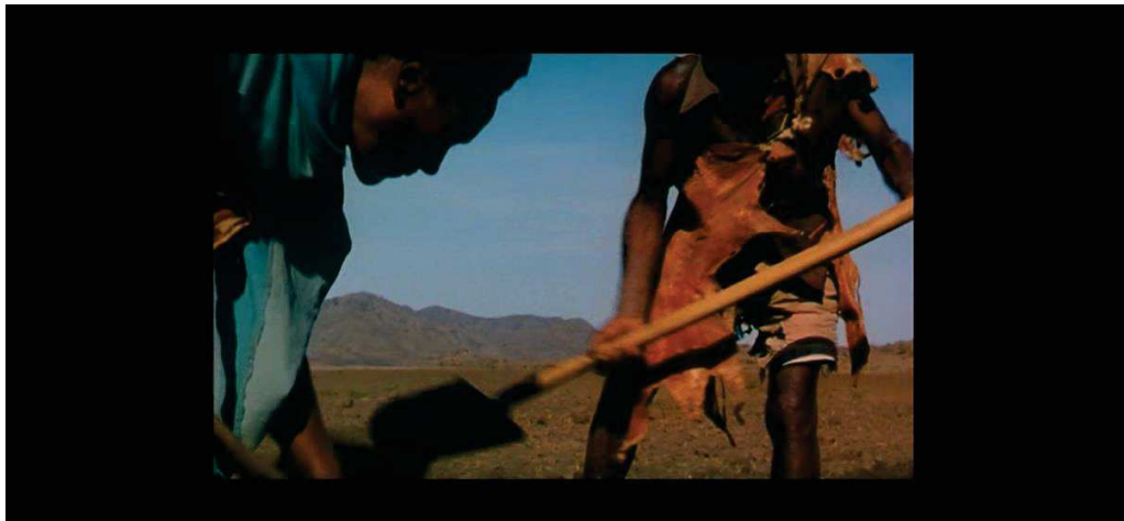
Figure 4 : Le travail quotidien n'était pas seulement une façon de s'entraîner à photographier et à filmer, il s'agit d'un véritable recours narratif et journalistique pour Raymond Depardon, il ponctue ses œuvres