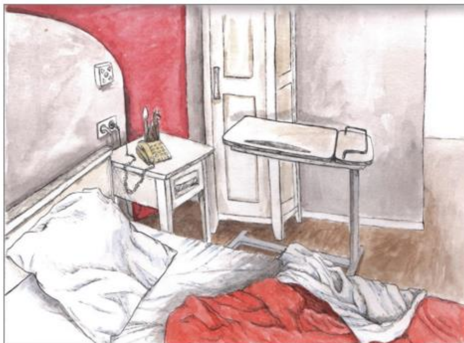
Peintures d'après photographies