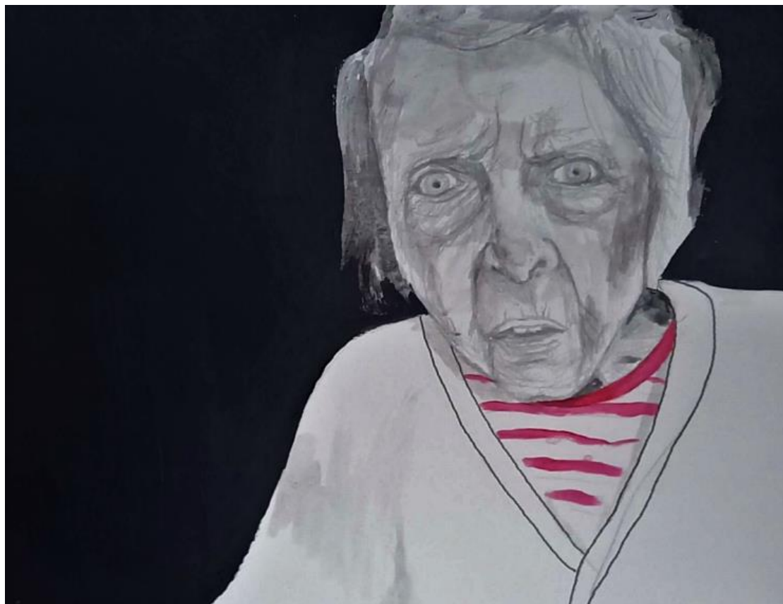
Dessin d'après photographie

En revoyant cette photographie, j'ai tout à coup un mot en tête : apeiron. L'Apeiron : quand tout devient flou, sans contour, chaotique au sens premier du terme. Le « chaos » c'est ce qui n'est pas défini, ce qui n'est pas délimité. Ce qui est tout et rien à la fois. Le chaos contient une dimension évidente de négatif lié à l'idée de néant, mais également, une dimension souvent oubliée de positif comme potentialités illimitées, car le chaos, puisqu'il n'est pas encore défini, peut donner lieu à n'importe quoi. Ainsi, « ne plus savoir dire, faire ou [se] reconnaître amène désordre et chaos. » (DASSIÉ, 2003 :7).