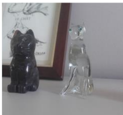
Photographies prises le jeudi 27 octobre 2022